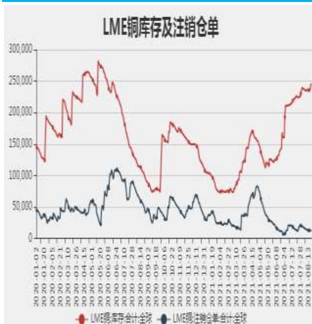
图7：LME铜库存及注销仓单