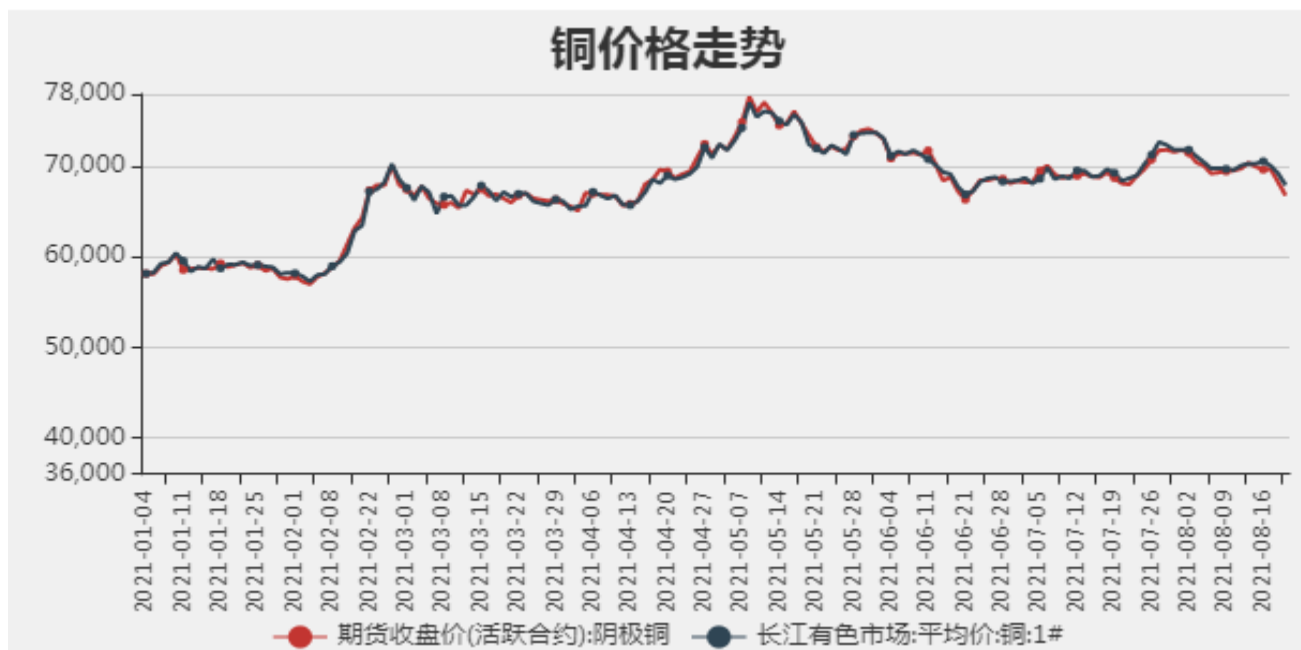
图1：铜期现价格走势

截止至2021年8月20日，长江有色市场1#电解铜平均价为67360元/吨；电解铜期货价格为67200元/吨。