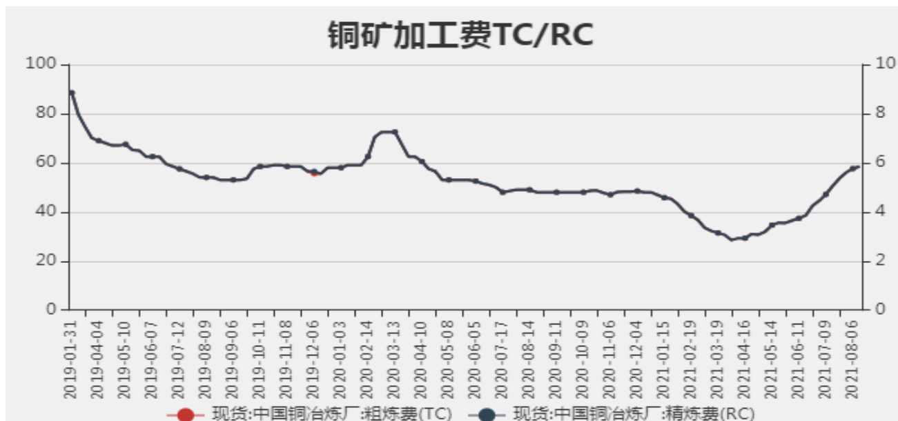
图2：中国铜冶炼加工费

2021年8月13日中国铜冶炼厂粗炼费（TC）为58.5美元/干吨，精炼费（RC）为5.85美分/磅，较上周上调0.09美元/干吨。