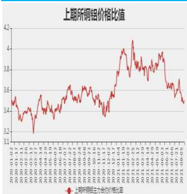
图9：沪铜和沪铝主力合约价格比率