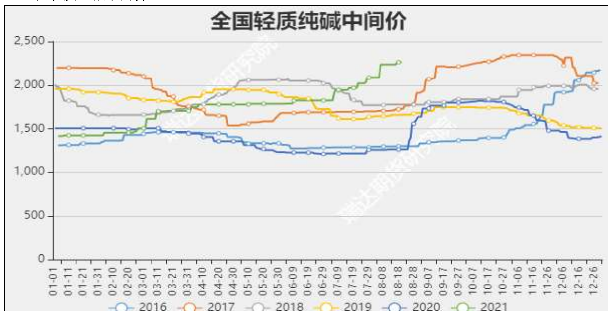
图4: 全国轻质纯碱中间价