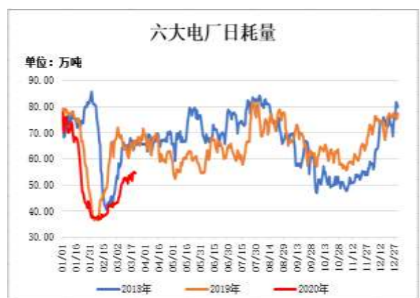
图10：六大电厂日均耗煤量