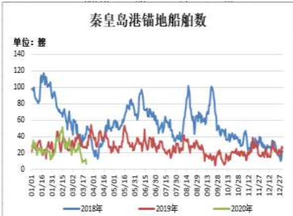
图13: 秦皇岛港锚地船舶数

截止 3 月 20 日, 秦皇岛港锚地船舶数为 7 艘, 较上周一周减 8 艘。