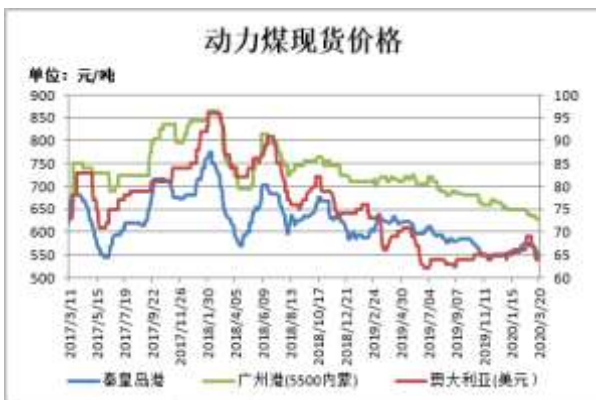
图1: 动力煤现货价格

截止 3 月 20 日,秦皇岛港山西优混(Q5500V28S0.5)平仓含税价报 546 元/吨,较上周跌 12 元/吨;广州港内蒙优混 Q5500, V24, S0.5 港提含税价 625 元/吨,较上周跌 5 元/吨;澳大利亚动力煤(Q5500,A<22,V>25,S<1,MT10)CFR(不含税)报 64 美元/吨,较前一周持平。