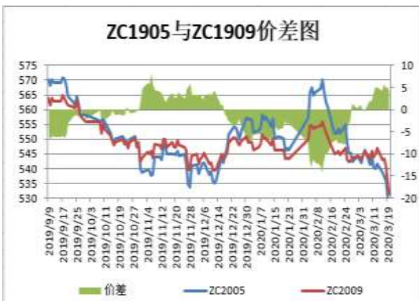
图5：郑煤期货跨期价差

截止3月20日，期货ZC2005与ZC2009（远月-近月）价差为4.2元/吨，较前一周跌1元/吨。