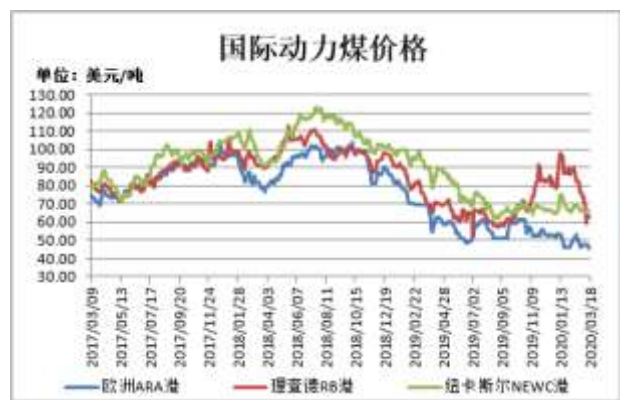
图2: 国际动力煤现货价格

截止 3 月 18 日,欧洲 ARA 港动力煤现货价格报 45.75 美元/吨,较前一周跌 2.1 美元/吨;理查德 RB 动力煤现货价格报 63.25 美元/吨,较前一周涨 2.12 美元/吨;纽卡斯尔 NEWC 动力煤现货价格报 66.29 美元/吨,较前一周涨 0.9 美元/吨。