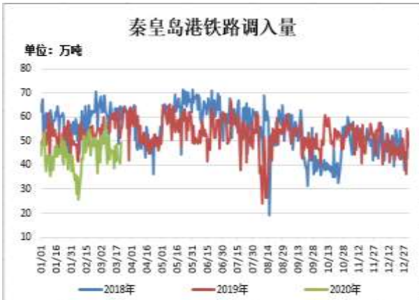
图11: 秦皇岛港铁路调入量

截止 3 月 20 日, 秦皇岛港铁路调入量为 49.3 万吨, 较前一周增 10.5 万吨。