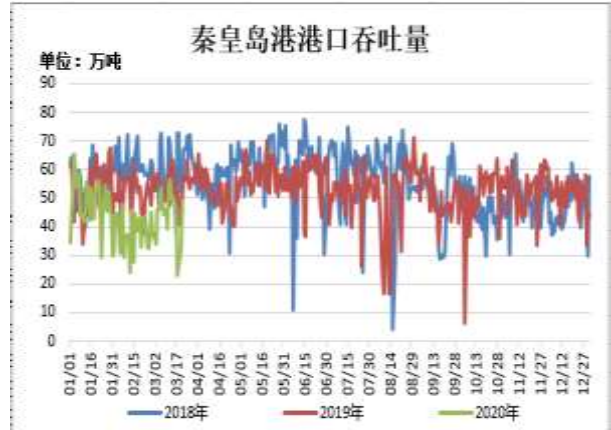
图12: 秦皇岛港港口吞吐量

截止 3 月 20 日, 秦皇岛港港口吞吐量为 49.3 万吨, 较前一周持平。