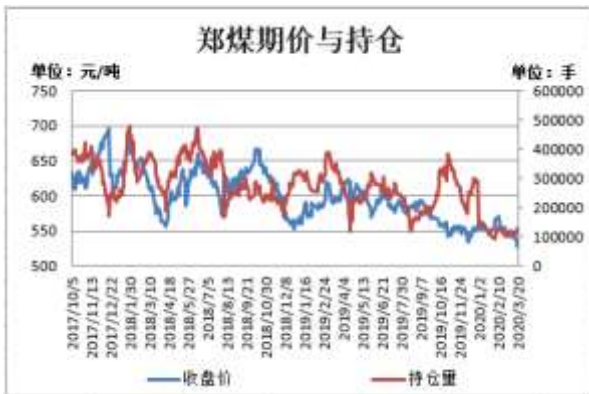
图3：郑煤期货价格与持仓量

截止3月20日，郑煤期货主力合约收盘价527元/吨，较前一周跌14.6元/吨；郑煤期货主力合约持仓量124937手，较前一周增15646手。