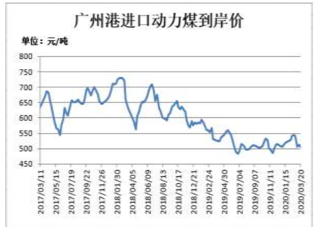
图14: 广州港进口动力煤到岸价

截止 3 月 20 日, CCTD 广州港进口动力煤 (Q5500) 到岸价 505 元/吨, 较前一周跌 7 元/吨。