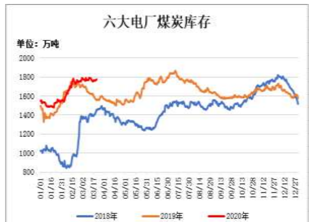
图8：六大电厂煤炭库存

截至3月13日，动力煤港口库存：环渤海三港(秦皇岛港、曹妃甸港、京唐港)港口库存1249.3万吨，环比前一周增92.8吨；其中秦皇岛港库存581.5万吨，比前一周减22.5万吨；曹妃甸港库存264.7万吨，比前一周增35.1万吨；京唐港库存403.1万吨，比前一周增80.2万吨。广州港库存241.7万吨，比前一周减10.7万吨。