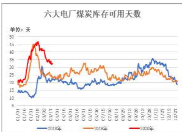
图9：六大电厂煤炭库存可用天数