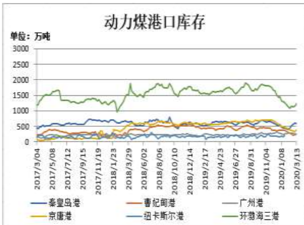
图7：动力煤港口库存

截至3月13日，动力煤港口库存：环渤海三港(秦皇岛港、曹妃甸港、京唐港)港口库存1249.3万吨，环比前一周增92.8吨；其中秦皇岛港库存581.5万吨，比前一周减22.5万吨；曹妃甸港库存264.7万吨，比前一周增35.1万吨；京唐港库存403.1万吨，比前一周增80.2万吨。广州港库存241.7万吨，比前一周减10.7万吨。