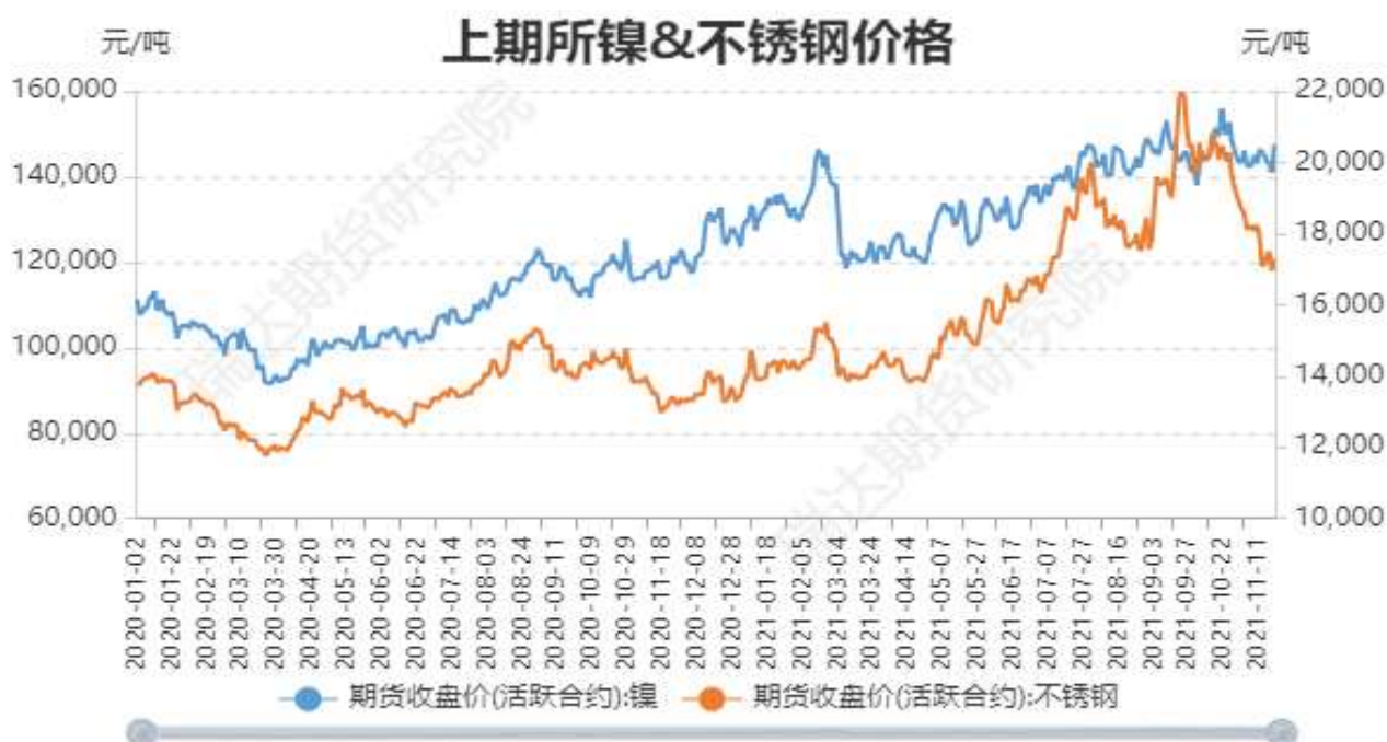
图2：国内镍现货价格

截止至2021年11月19日，沪镍期货价格为147440元/吨，不锈钢期货价格为17290元/吨。