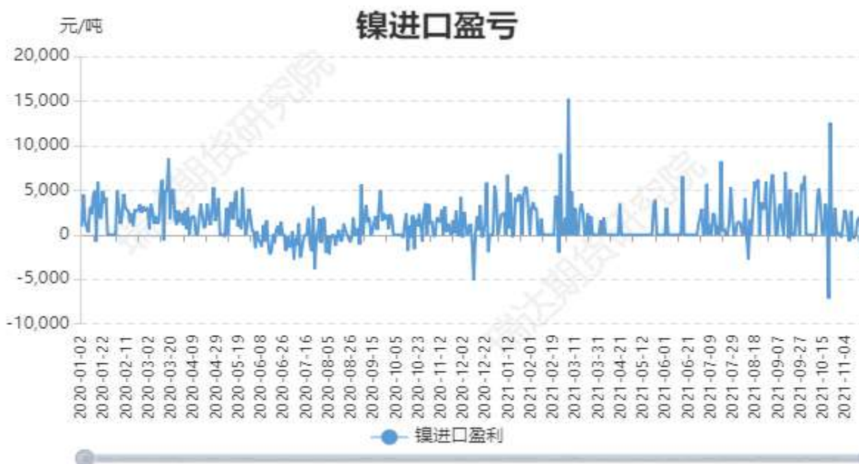
图6：镍进口盈亏分析