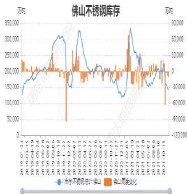
图7：佛山不锈钢月度库存