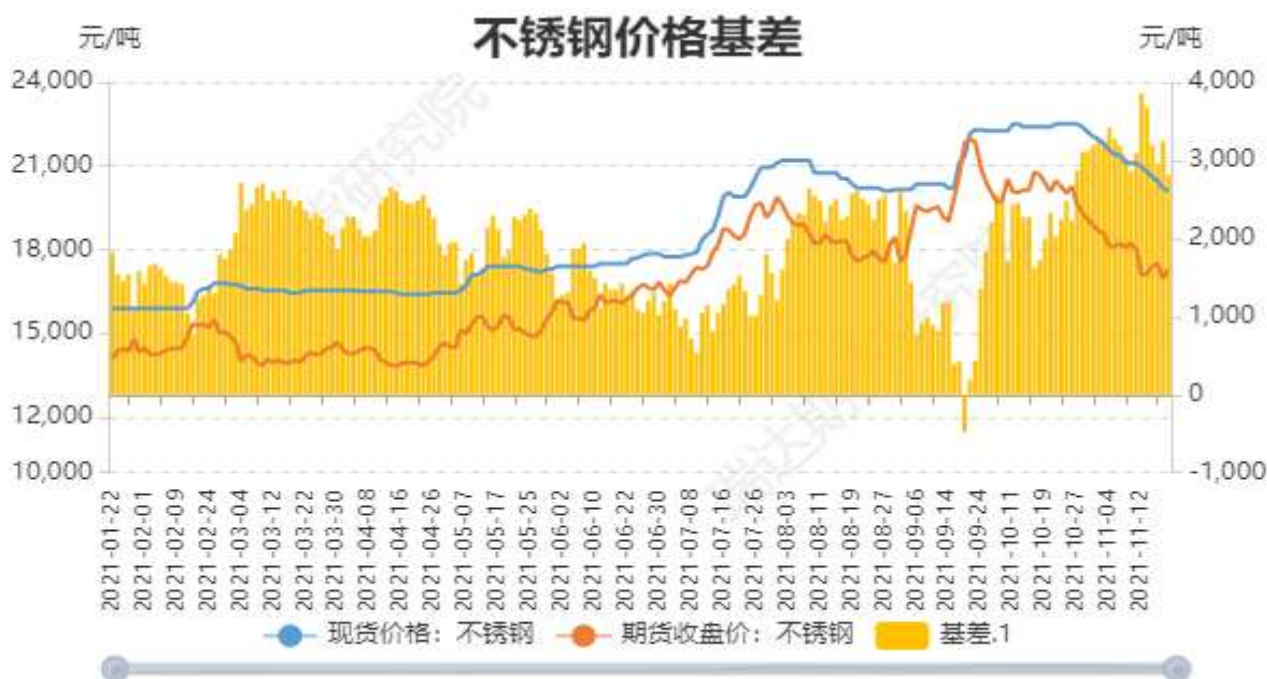
图4：不锈钢价格走势