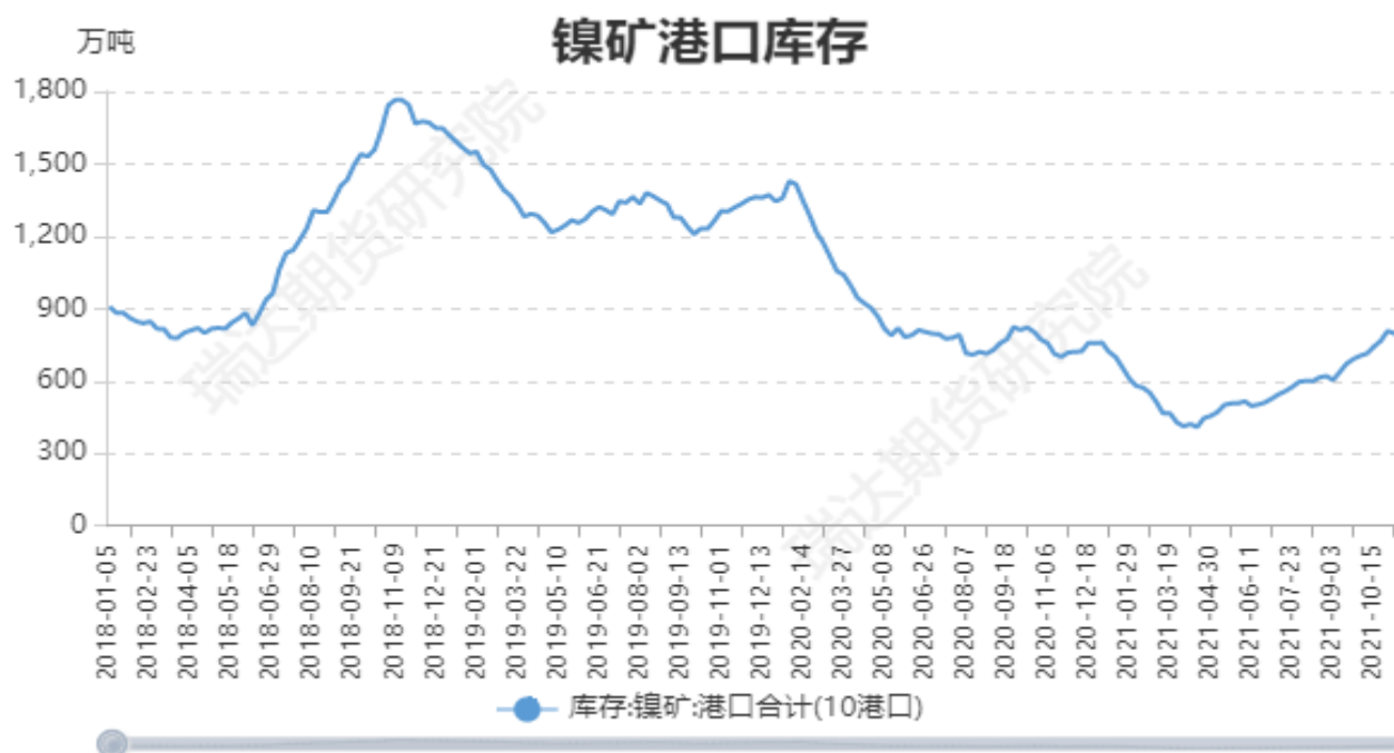
图5：国内镍矿港口库存