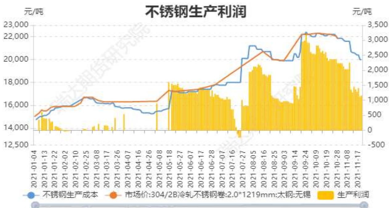
图11：不锈钢生产利润