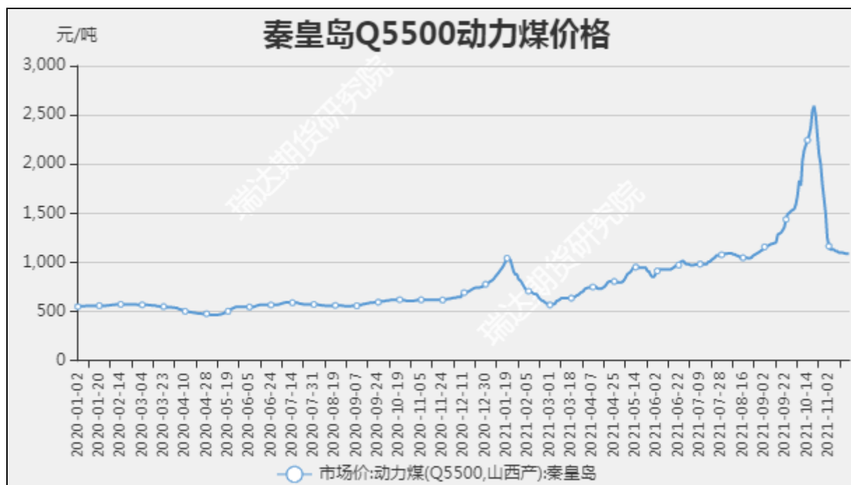
图1 秦皇岛动力煤市场价