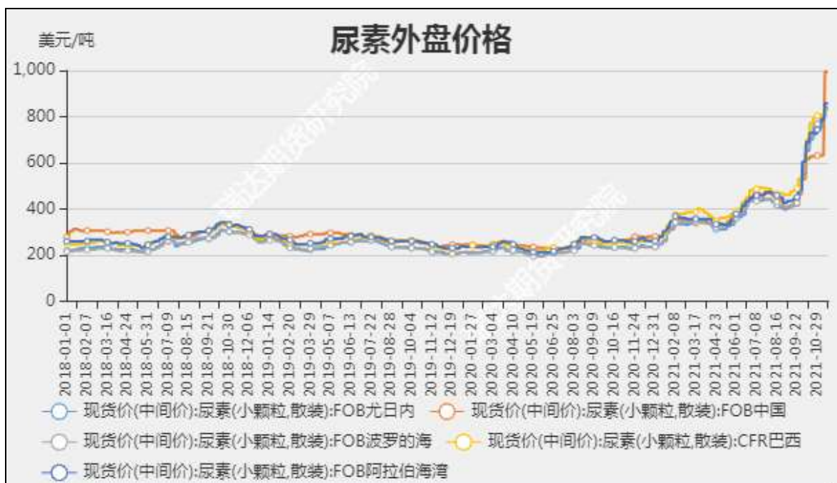
图4 尿素外盘现货价