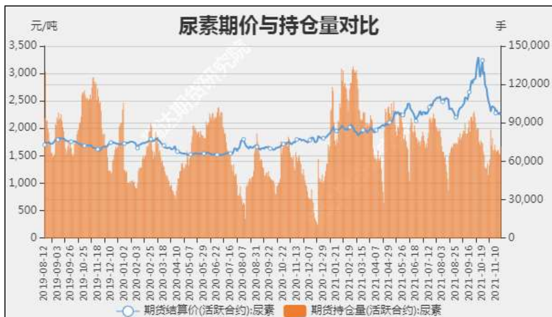
图6 尿素期货持仓量