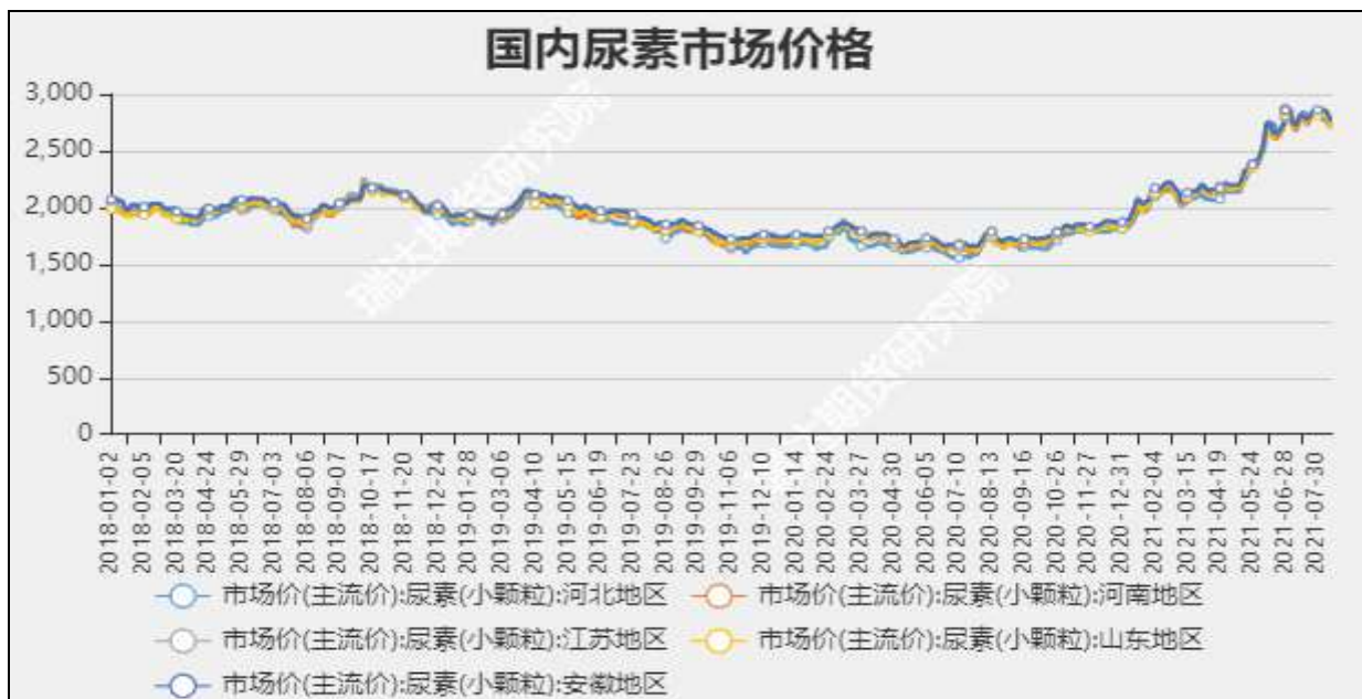
图3 国内尿素市场主流价

截至8月12日，NYMEX天然气收盘价3.91美元/百万英热单位，较上周-0.22美元/百万英热单位。