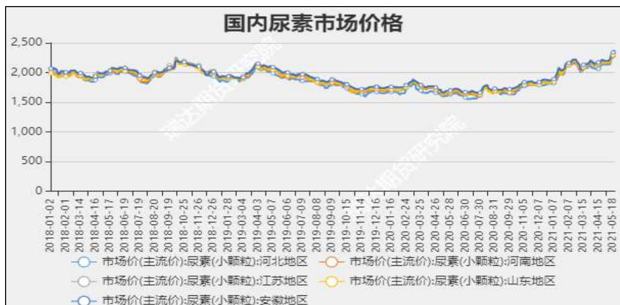
图3 国内尿素市场主流价

截至5月20日, NYMEX天然气收盘价2.95美元/百万英热单位, 较上周-0.02美元/百万英热单位。