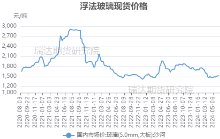
图 2 浮法玻璃现货价格