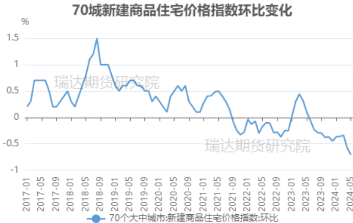
图 11 70 城新建商品住宅价格指数

国家统计局公布的数据显示，2024 年 5 月份，70 个大中城市中，各线城市商品住宅销售价格环比下降、同比降幅略有扩大。自 5 月中旬以来，从全国到地方，一揽子房地产支持政策密集出台落地，对市场情绪起到了明显的带动作用，多个城市新房访盘量、二手房带看量出现回升。在多项政策举措落地后，房地产市场情绪有所好转，特别是核心城市政策效果正在显现，未来市场能否持续修复，还要依赖于接下来政策跟进节奏和力度及居民收入预期的改善。