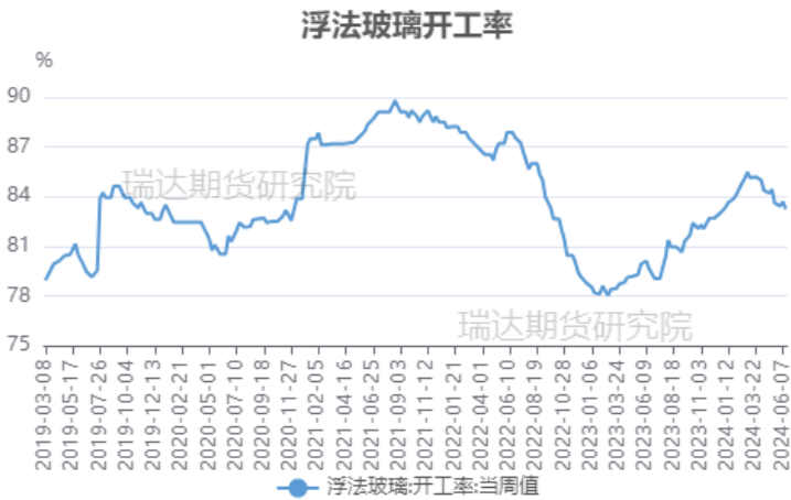
图 4 浮法玻璃开工率

始后不会轻易冷修，需要看到玻璃价格击穿成本线后长期亏损且对后市持续悲观，而当前利润下，玻璃产线出现大规模放水冷修的概率不大，下半年供应预计仍将居于偏高水平。