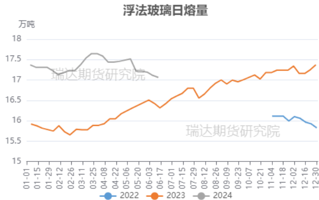
图 5 中国浮法玻璃日产量