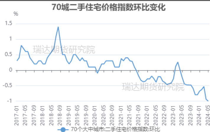
图 12 70 城二手住宅价格指数