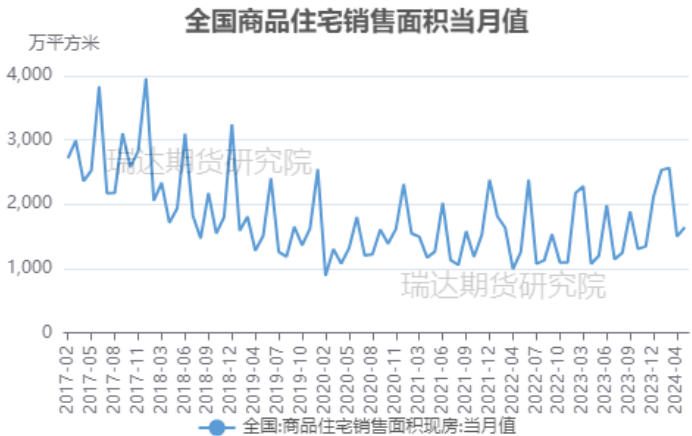
图 9 全国商品住宅销售面积当月值