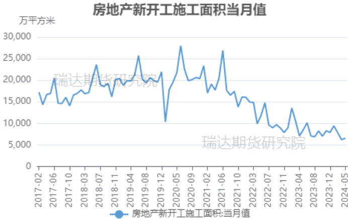
图 8 房屋新开工面积当月值

和去年8月末的稳地产政策相比，本轮政策涉及的领域更为全面，政策稳地产的态度也更坚定。预计随着责任的压实，各个渠道的资金将会流入房地产企业，竣工增速有望回升。在一系列政策支持下，市场对未来地产行业持续回暖、玻璃终端需求不断复苏预期加强，但考虑到商业银行贷款意愿不强、地方政府财政压力较大、地方国企增量资金有限，竣工增速回升的幅度相对有限。另外，按照4年的平均施工周期，今年的潜在竣工面积主要是4年前的新开工面积，从开工端传导而来的走弱预期预计会在2024年的竣工端上兑现，地产竣工步入下行通道，竣工面积的下滑将导致地产后端玻璃需求承压。