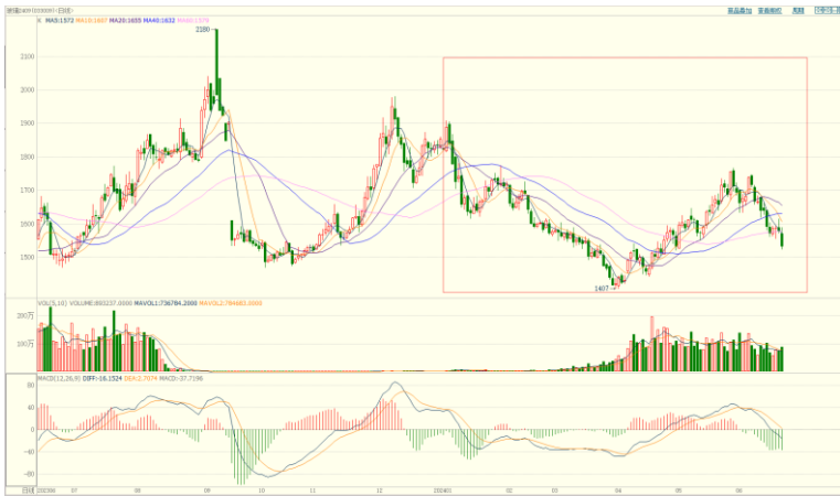
图 1 郑州玻璃期货价格走势

2024 年上半年，郑州玻璃期货价格整体呈倒“N”型走势。一季度房地产偏弱预期背景下，浮法玻璃现货价格接连下滑，并于 3 月末触及年内低位。伴随着玻璃价格的逐步回落，深加工采购增加，带动了浮法玻璃产销率阶段性的提升，浮法玻璃价格触底反弹。由于玻璃的上涨更多是基于预期转暖，而非现实改善，至 6 月份，随着利好逐渐被市场消化，玻璃期货盘面转为交易现实，期价再度回落。