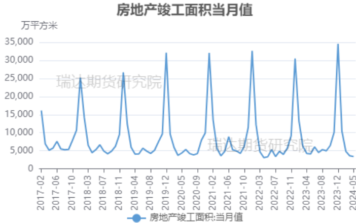
图 10 房地产竣工面积当月值