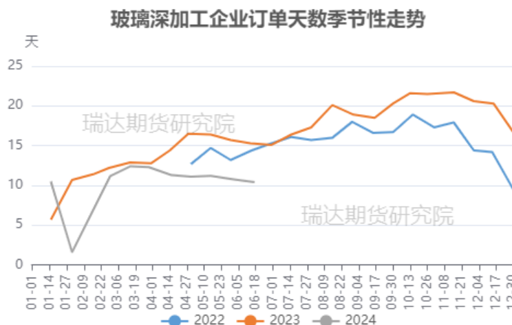
图 7 全国玻璃深加工样本订单走势

限，经销商及期现商拿货后不能持续向终端传导将会影响拿货的持续性；而家装类订单自5月下旬开始转弱，带动整体深加工订单均值下滑。另外，受制于海运费以及舱位紧张等因素，出口订单也有一定下滑。目前深加工企业面临的困境是订单量少、回款难，整体依然接单谨慎，保证自身现金流转，但是旧房改造给深加工带来一定支撑。