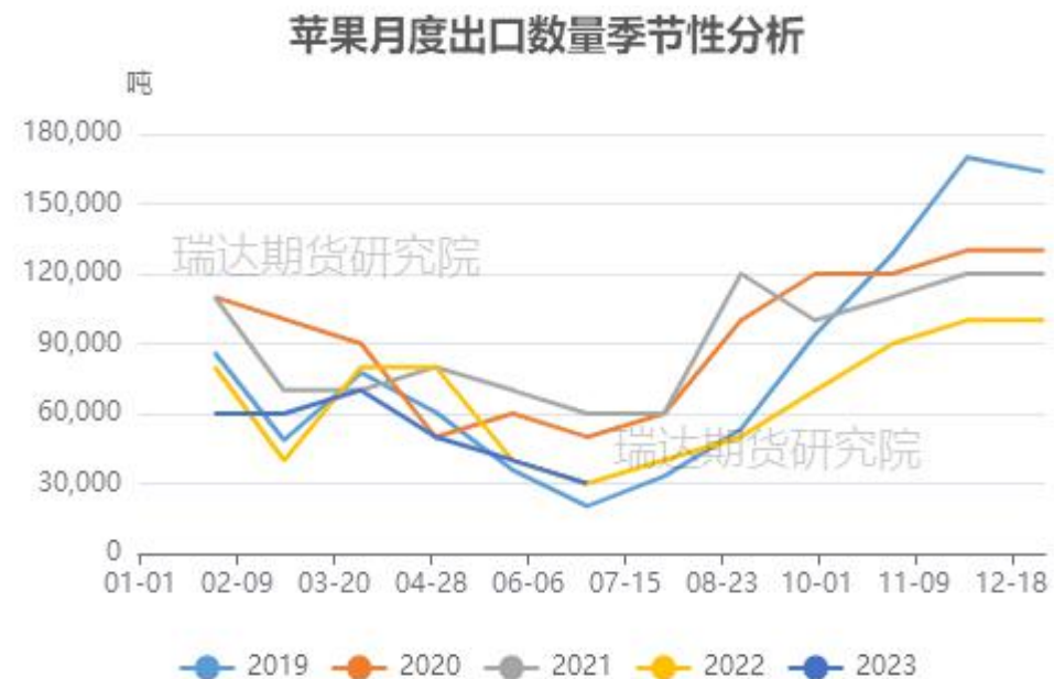
图、苹果出口量季节性情况