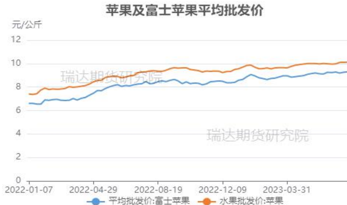
图、全品种苹果及富士苹果批发价格