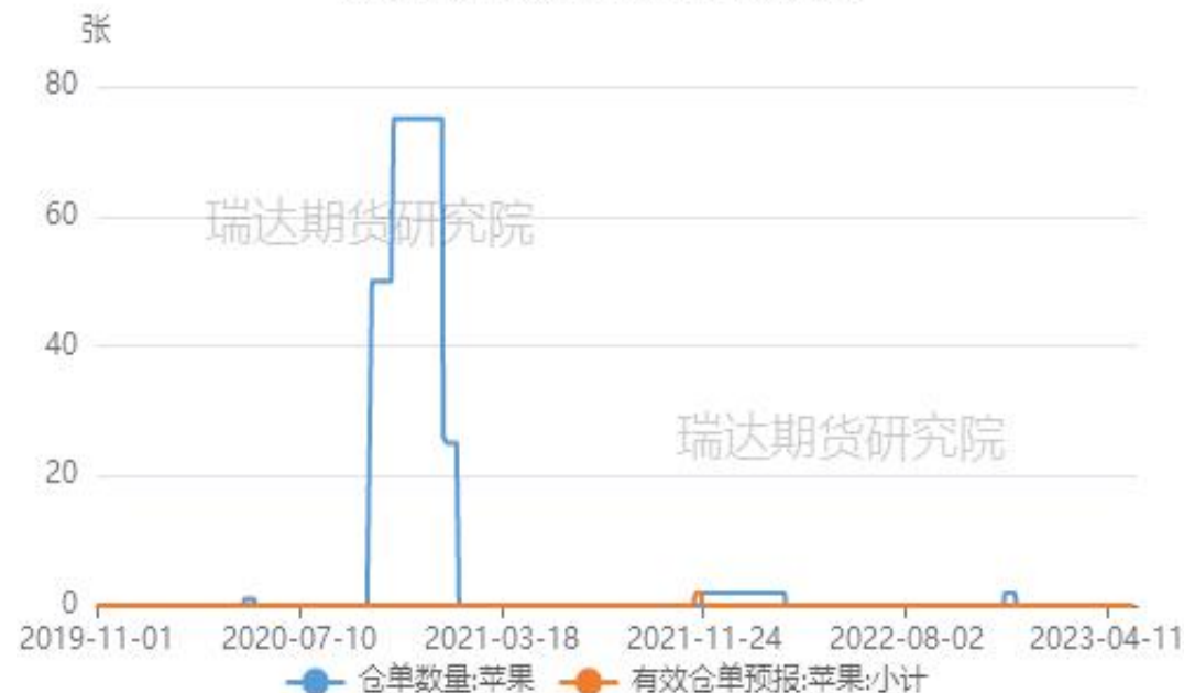
郑商所苹果仓单及有效预报