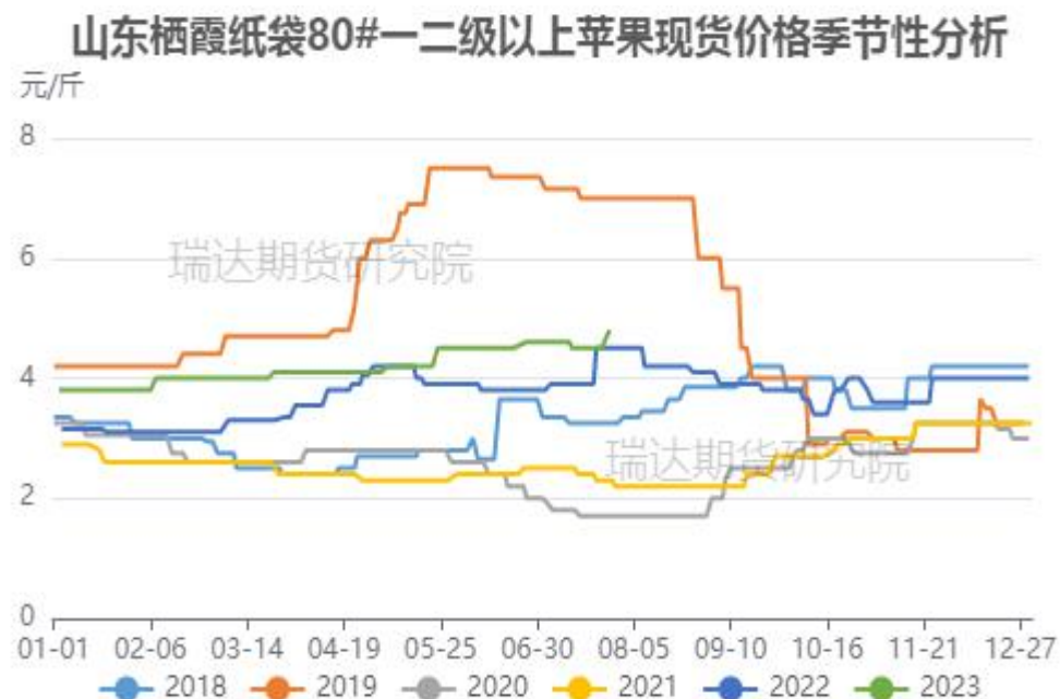
图、山东栖霞80#一二级苹果现货价格季节性走势