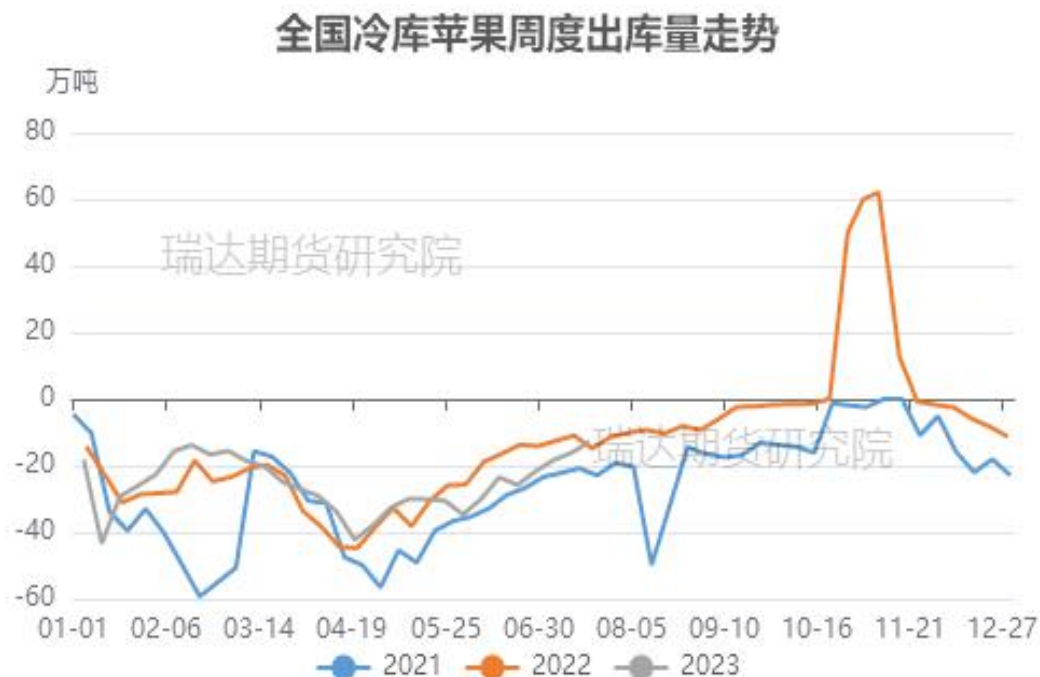
图、全国苹果冷库出库走势