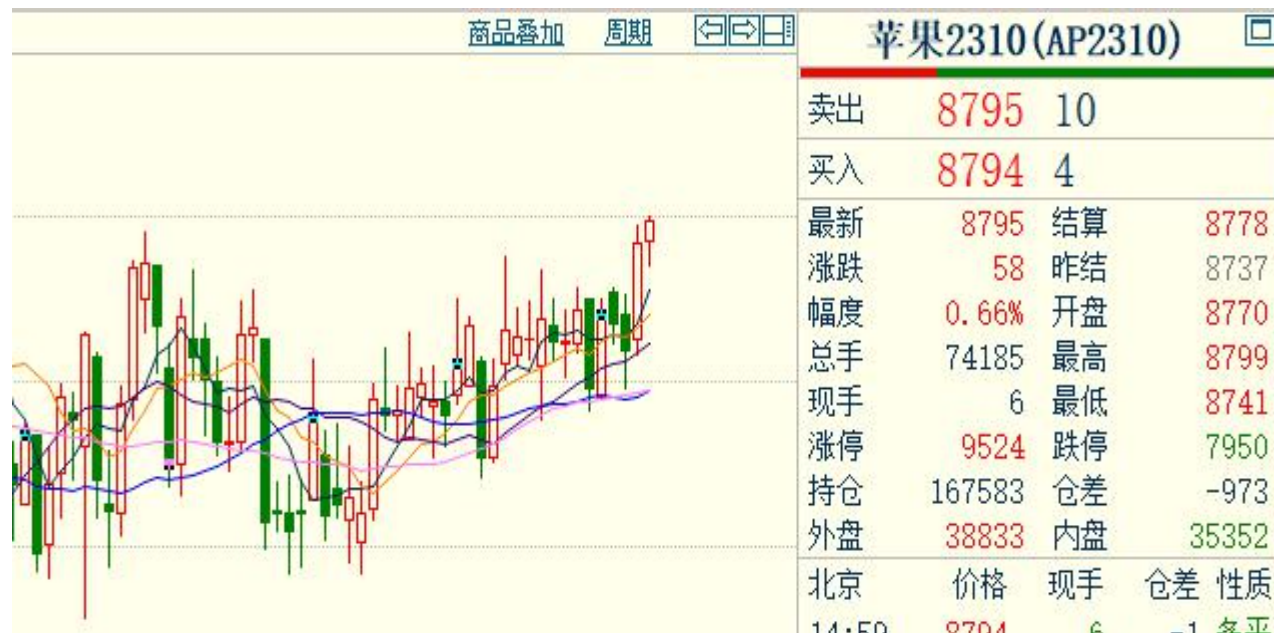
图、苹果主力合约价格走势