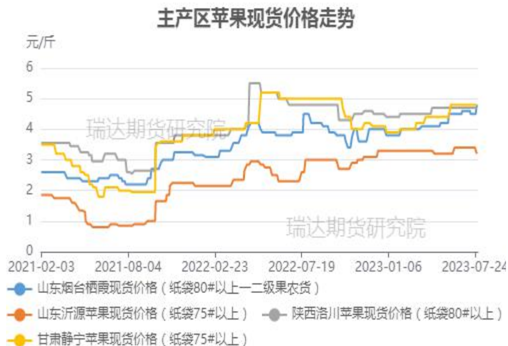
图、主产区苹果现货价格走势