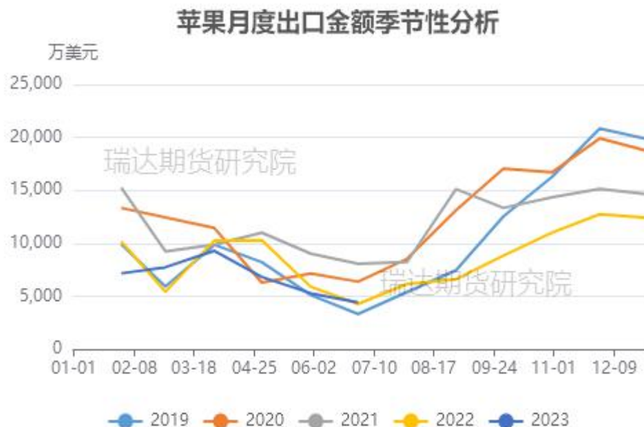
图、苹果出口金额季节性走势