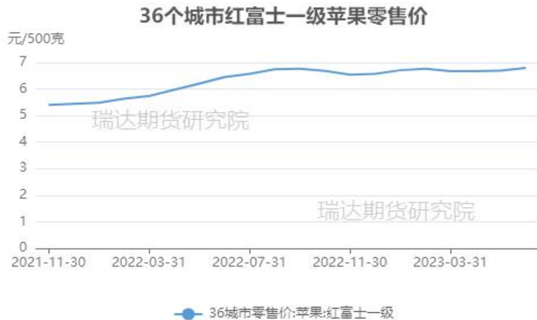
图、36个城市富士苹果零售价格走势