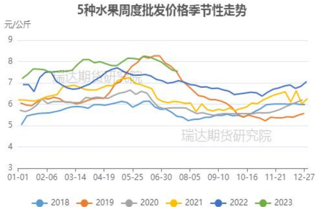
图、5种水果批发价格走势（富士、香蕉、葡萄、鸭梨和西瓜）