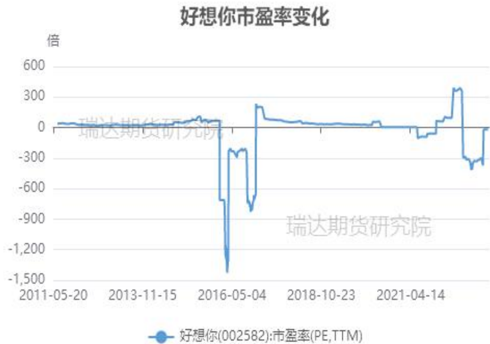
图、宏辉果蔬市盈率