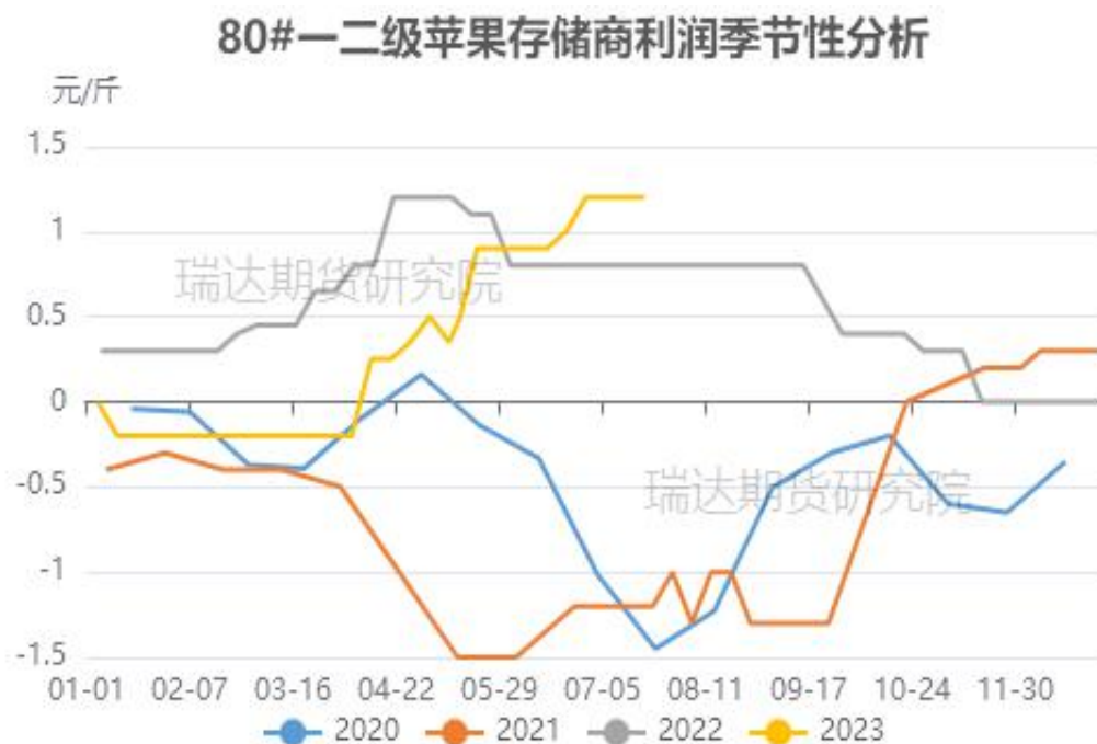
图、80#一二级富士存储商利润走势