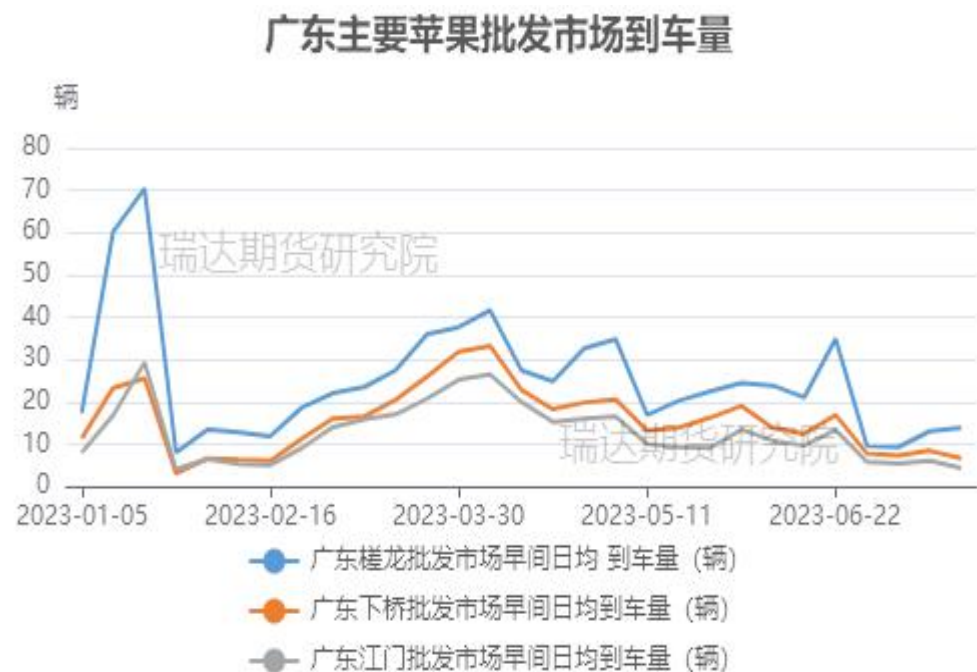
图、苹果批发市场-广东主要批发市场到车辆