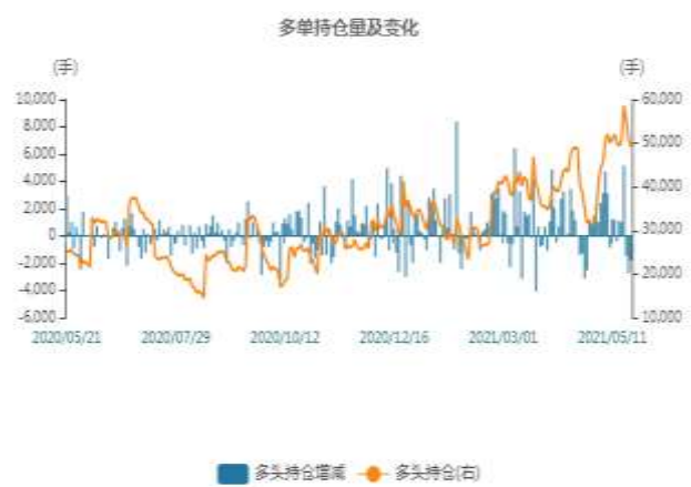
图2：沪铅多头持仓走势图