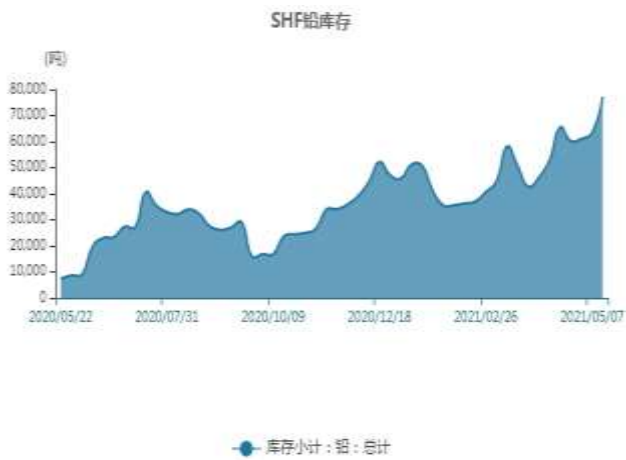
图12：上海铅库存走势图

截止至2021年5月21日，上海期货交易所精炼铅库存为84587吨，较上一周增7367吨。