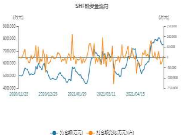
图4：期铅资金流向走势图