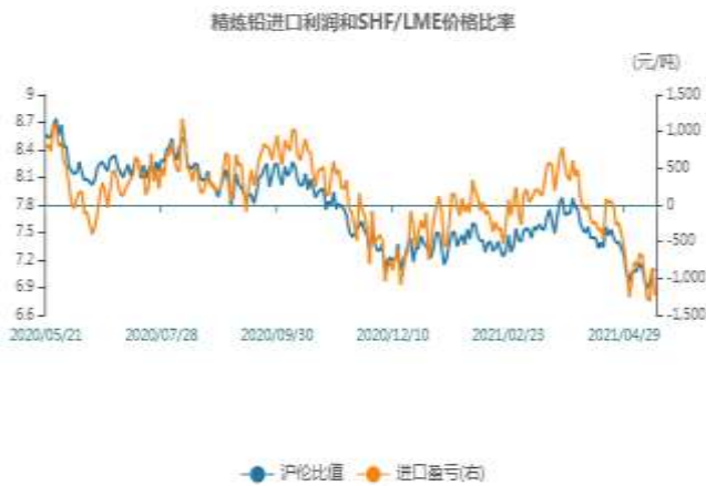
图1：铅两市比值走势图