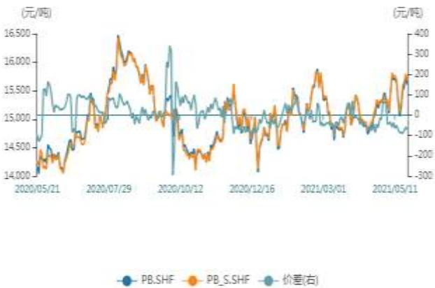
SHF铅主力与次主力合约价格和价差