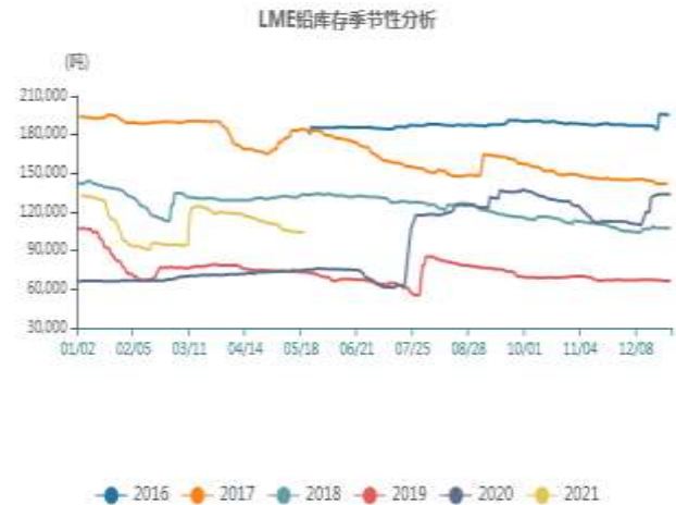
图15：LME铅库存季节性分析

LME 铅库存由上周 105100 降至 103975 吨。从季节性角度分析，当前库存较近五年相比维持在较低水平。