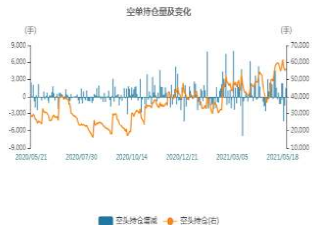
图3：沪铅空头持仓走势图