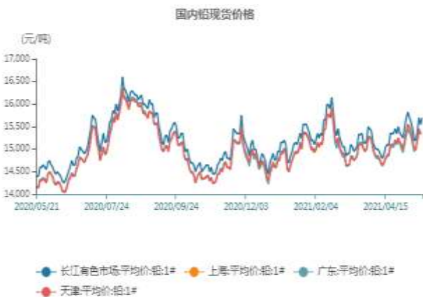
图7、国内铅现货价格走势

截止至2021年5月21日，长江有色市场1#铅平均价为15700元/吨；上海、广东、天津三地现货价格分别为15325元/吨、15325元/吨、15350元/吨。