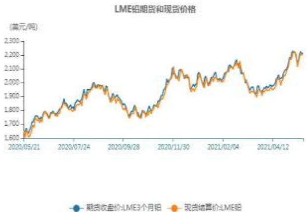
图8、LME铅现货价格走弱

截止至2021年5月20日，LME3个月铅期货价格为2217美元/吨，LME铅现货结算价为2202.5美元/吨。