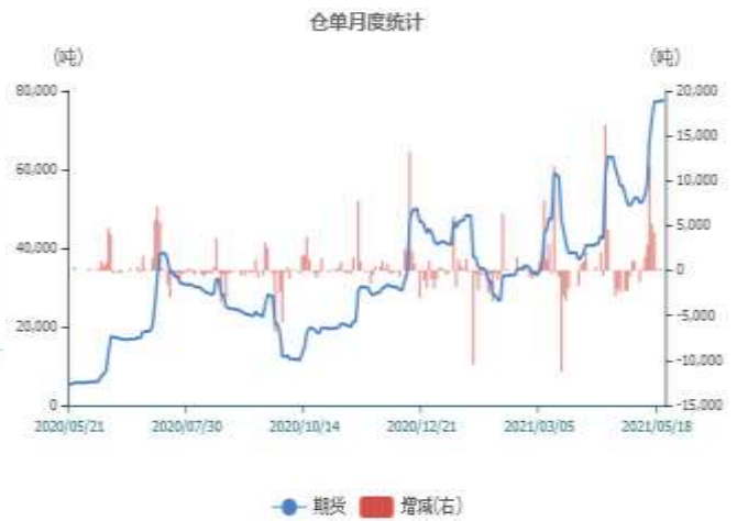
图13：铅仓单库存走势图

截止至2021年5月21日，上海期货交易所精炼铅库存为84587吨，较上一周增7367吨。