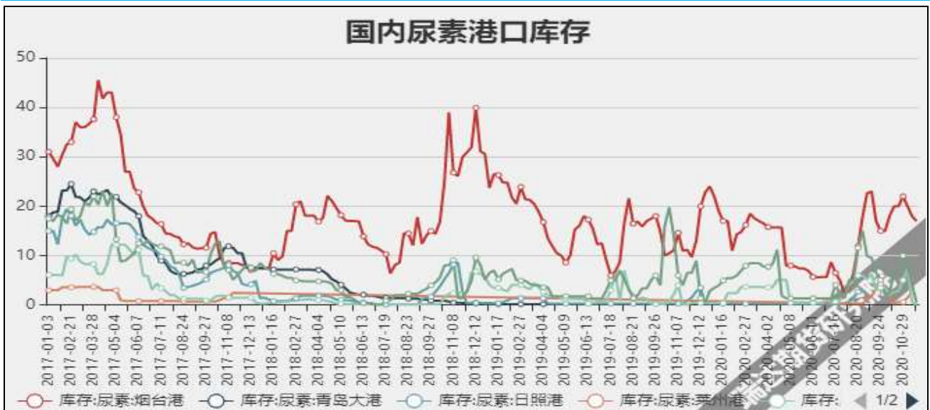
图9 国内尿素港口库存