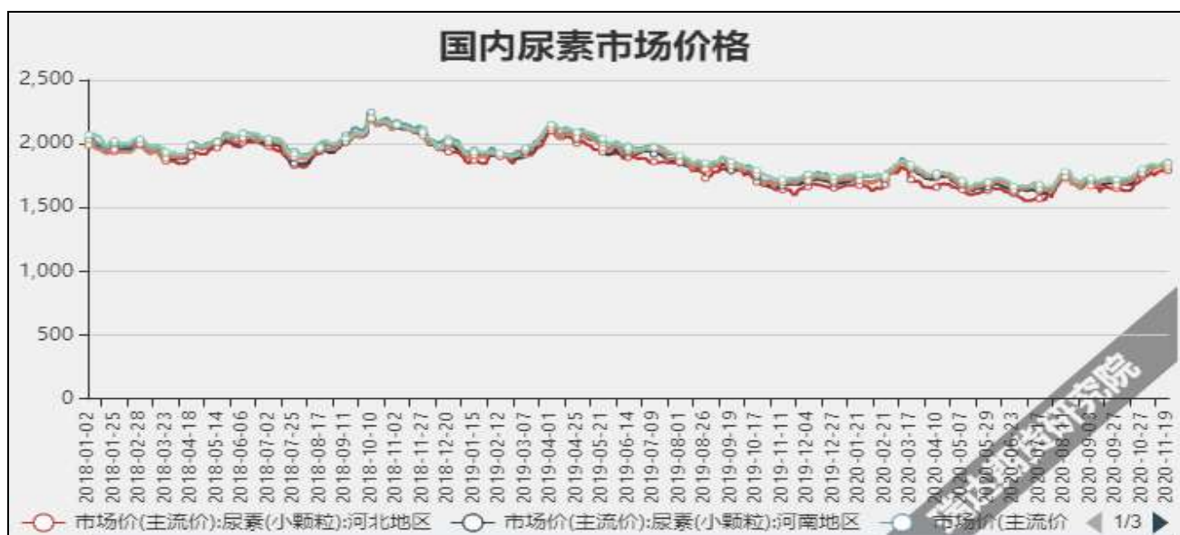
图3 国内尿素市场主流价

截至11月19日, NYMEX天然气收盘价2.6美元/百万英热单位, 较上周-0.35美元/百万英热单位。