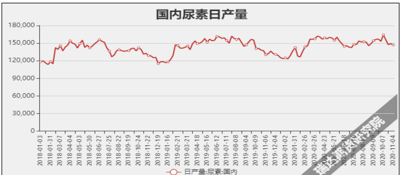
图7 国内尿素日产量