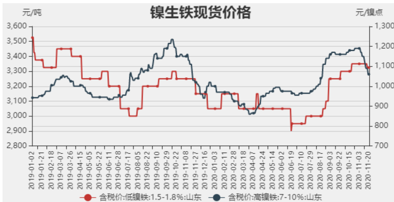
图1：镍生铁现货价格

截止至2020年11月20日，以山东地区为例，低镍铁（FeNi1.5-1.8）价格为3325元/吨，较上周下跌25元/吨，高镍生铁（FeNi7-10）价格为1060元/镍点，较上周下跌50元/镍点。