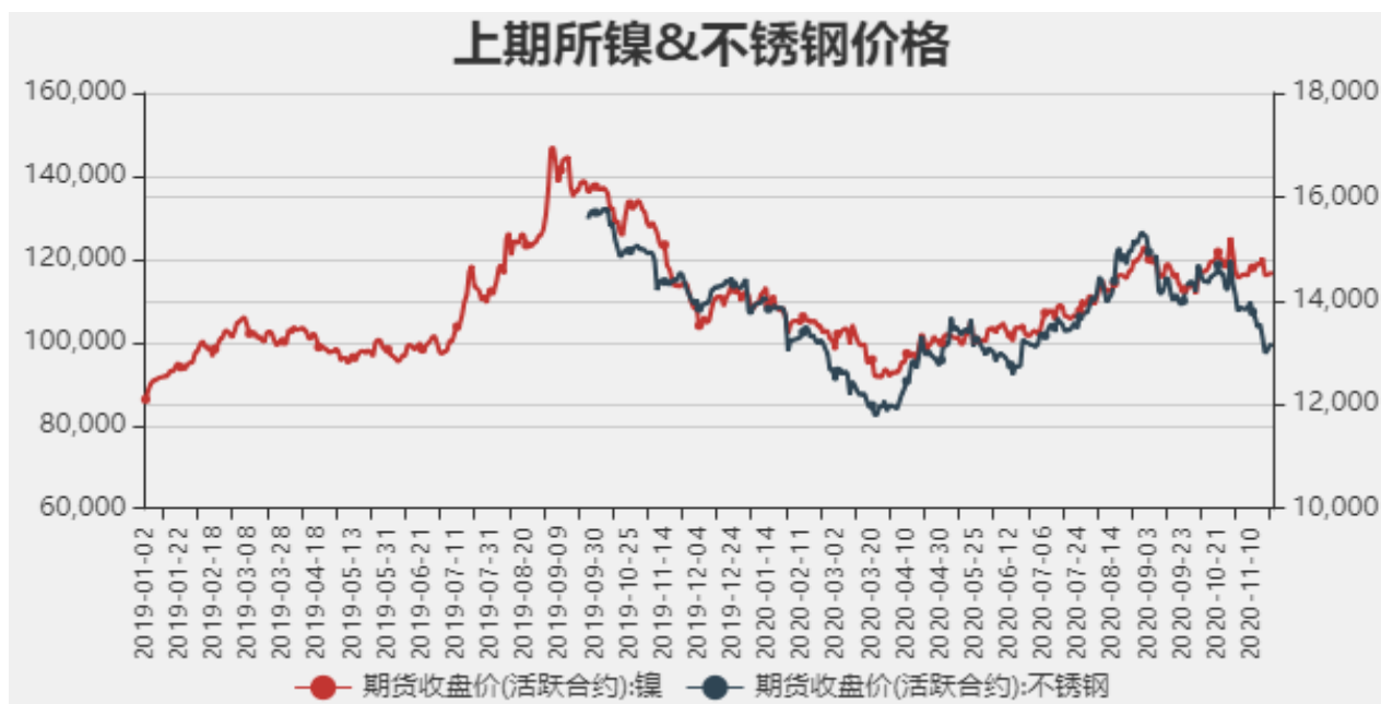
图2：国内镍现货价格

截止至2020年11月20日，沪镍期货价格为116900元/吨，不锈钢期货价格为13170元/吨。