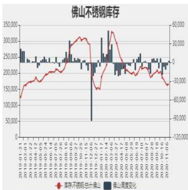
图7：佛山不锈钢月度库存