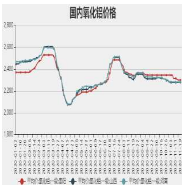
图3：国内氧化铝价格