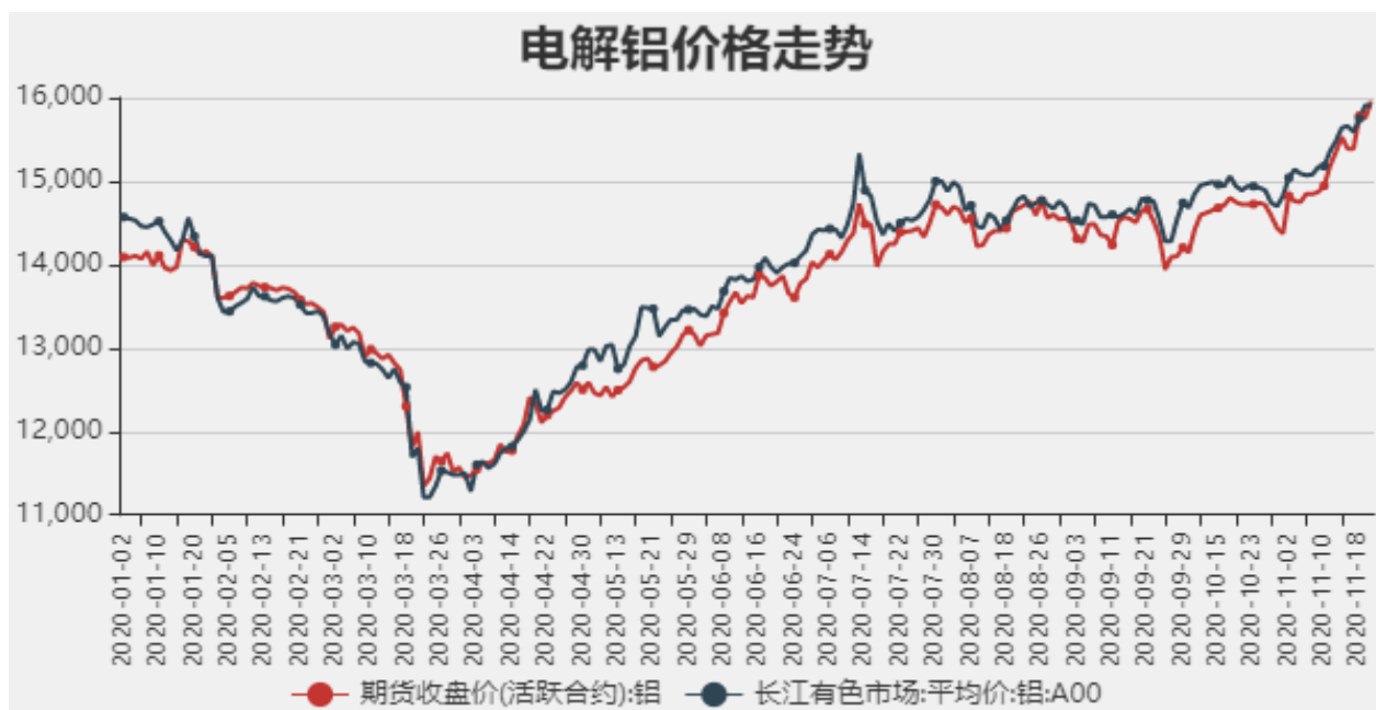
图1：电解铝期现价格

截止至2020年11月20日，长江有色市场1#电解铝平均价为15960元/吨，沪铝期货价格为15910元/吨。