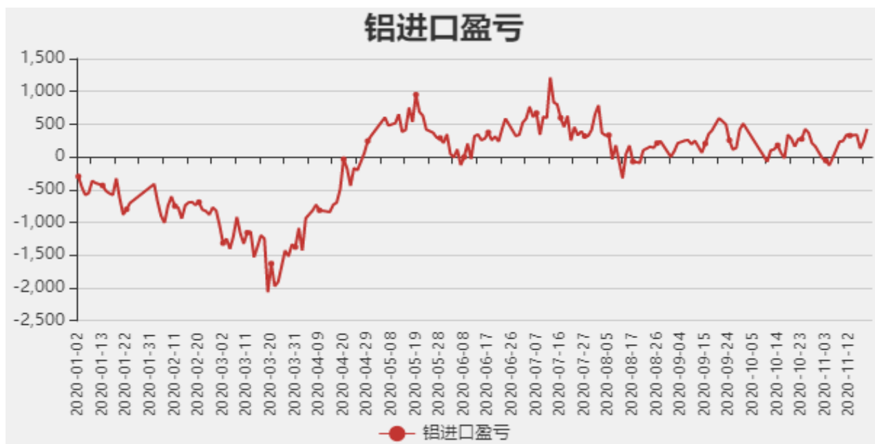
图5：铝进口利润和沪伦比值

截止至11月20日，贵阳氧化铝价格为2300元/吨；库存方面，截止至11月13日，国内总计库存为64万吨。