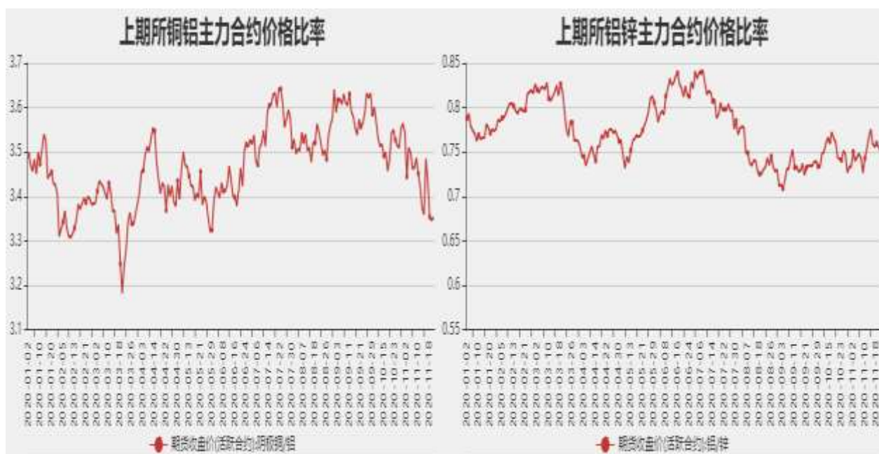
图14：沪铝与沪锌主力合约价格比率

截止至10月20日，铜铝以收盘价计算当前比价为3.3534，铝锌以收盘价计算当前比价为0.7514。