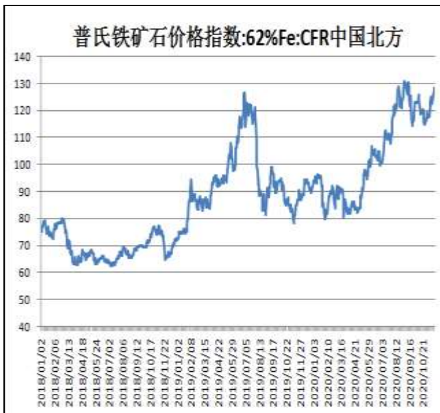
图9：62%铁矿石普氏指数

本周，62%铁矿石普氏指数继续上行，19日价格为128.3美元/吨，周环比+5.65美元/吨