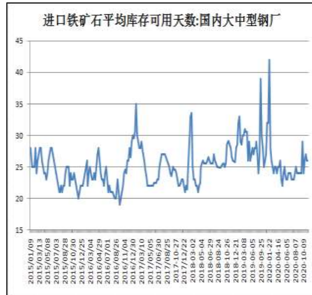
图10：钢厂铁矿石可用天数

19日Mysteel统计64家钢厂进口烧结粉总库存1703.70；烧结粉总日耗58.46；库存消费比29.14，进口矿平均可用天数26天。