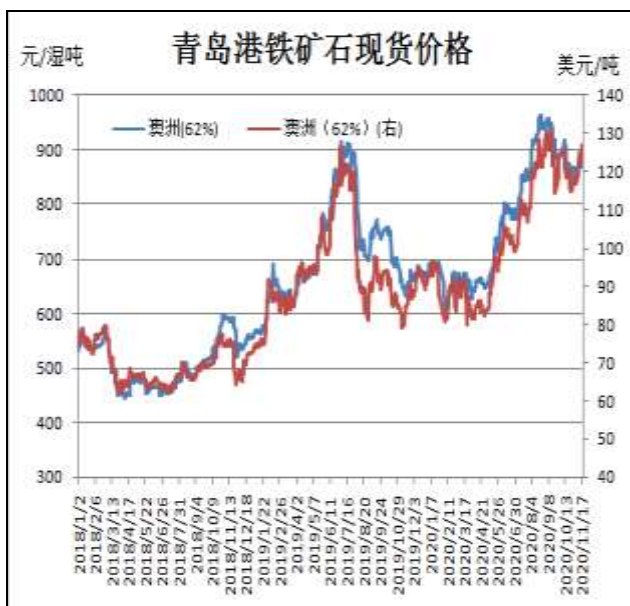
图1：铁矿石现货价格走势