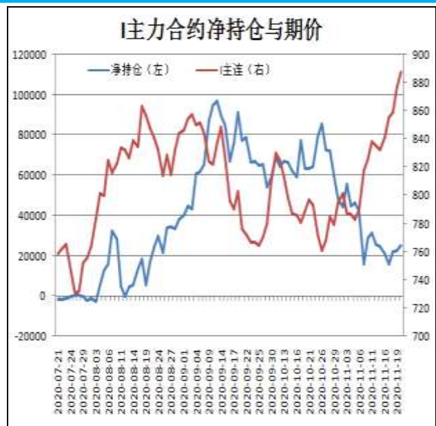
图14: 铁矿主力合约前20名净持仓

I2101合约前20名净持仓情况，13日为净多24454手，20日为净多24910手，净多增加456手，由于主流持仓空单减幅略大于多单。