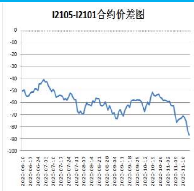
图5：铁矿石跨期套利

本周，I2105合约走势弱于I2101合约，20日价差为-87元/吨，周环比-14元/吨。