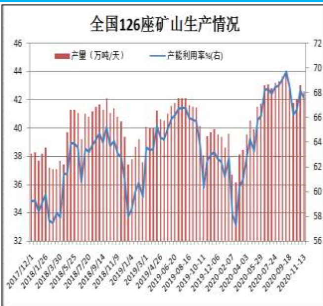
图13: 全国126座矿山产能利用率

据Mysteel统计，截止11月13日全国126座矿山样本产能利用率为67.57%，环比上期调研降0.67%；库存114.73万吨，降9.32万吨。