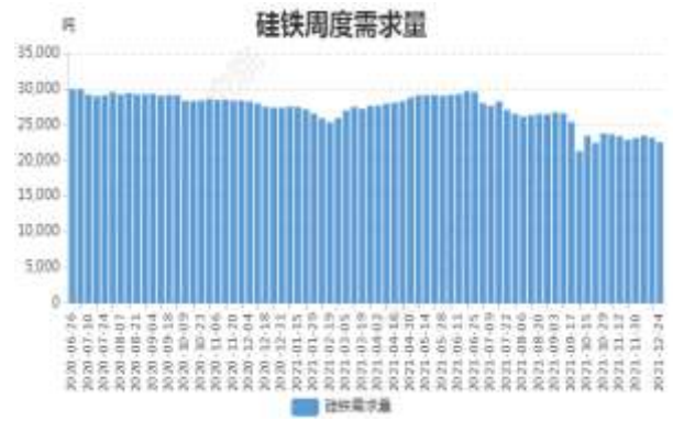
图14: 硅铁周度需求量

截至 12 月 24 日, 全国硅铁需求量(周需求): 22545 吨, 环比上周降 2.84%。