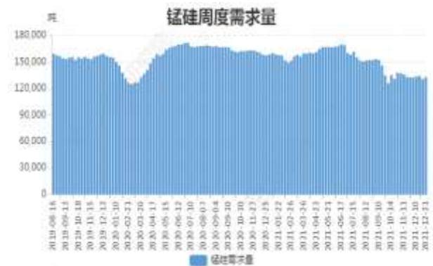
图16: 锰硅周度需求量

截止 12 月 31 日, 全国锰硅需求量(周需求): 133076 吨, 环比上周增 1.96%。