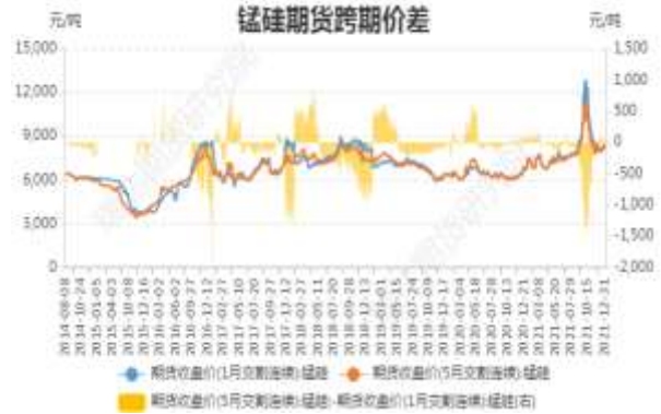
图6：锰硅期货跨期价差

截止 12 月 31 日，期货 SM2201 与 SM2205（远-月-近月）价差为 58 元/吨，较前一周跌 6 元/吨。