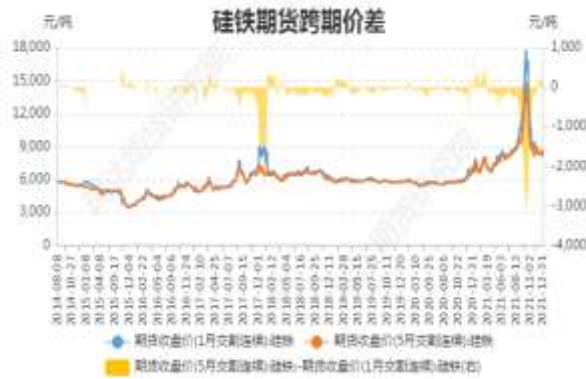
图5：硅铁期货跨期价差

截止 12 月 31 日，期货 SF2201 与 SF2205（远-月-近月）价差为 112 元/吨，较前一周跌 24 元/吨。