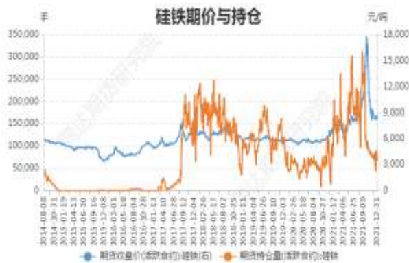
图3：硅铁期价与持仓

截止 12 月 31 日，硅铁期货主力合约收盘价 8312 元/吨，较前一周跌 134 元/吨；硅铁期货主力合约持仓量 74601 手，较前一周增 207 手。