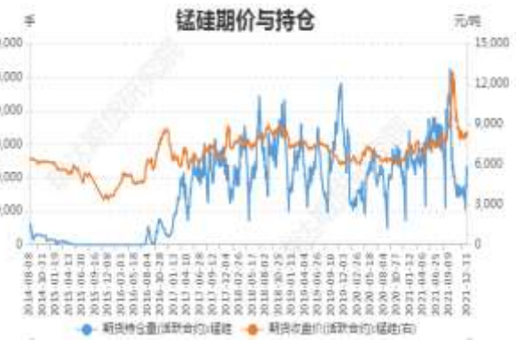
图4：锰硅期价与持仓

截止 12 月 31 日，锰硅期货主力合约收盘价 8178 元/吨，较前一周跌 160 元/吨；锰硅期货主力合约持仓 102420 手，较前一周增 10483 手。