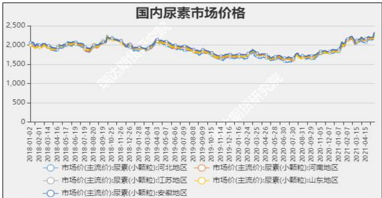
图3 国内尿素市场主流价

截至5月13日, NYMEX天然气收盘价2.97美元/百万英热单位, 较上周+0.04美元/百万英热单位。