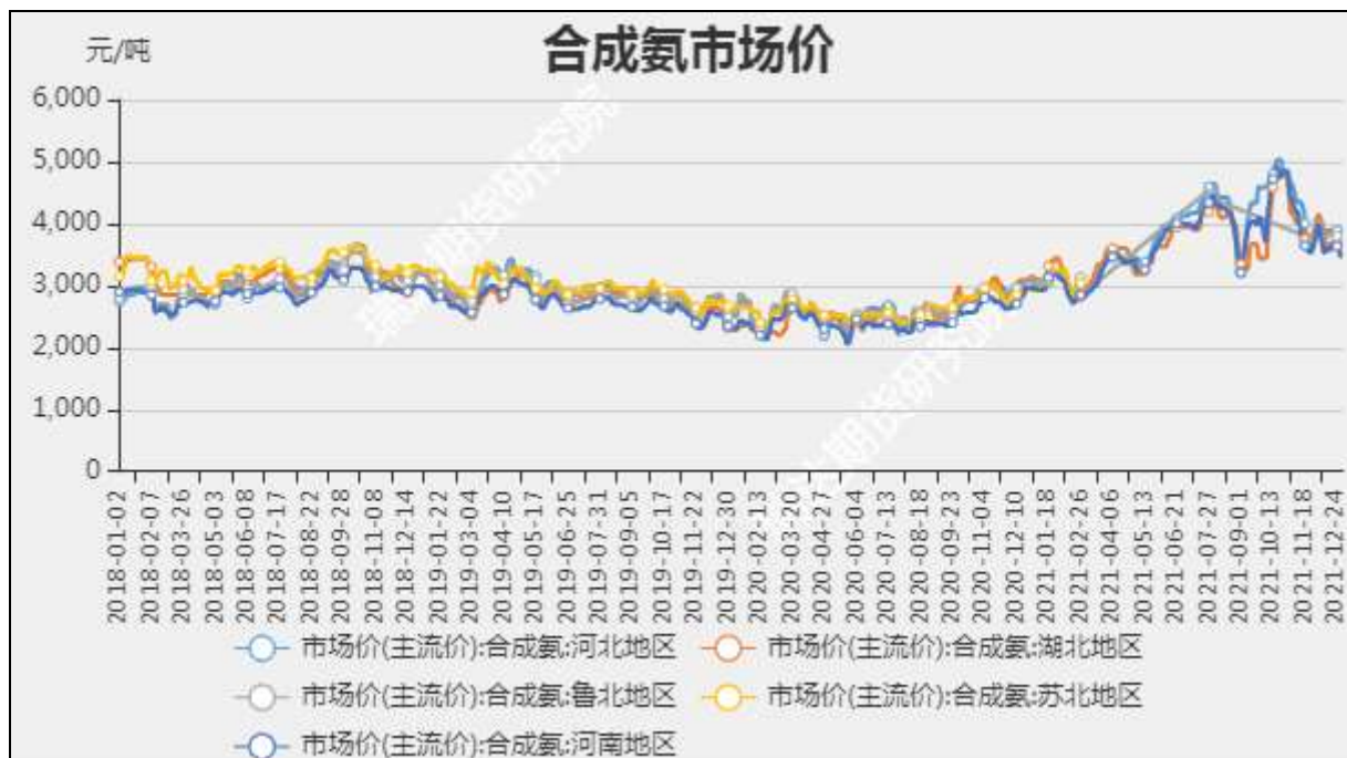
图2: 合成氨市场主流价

截至12月26日, 华东地区原盐市场价600元/吨, +0; 东北地区原盐市场价220元/吨, +0。