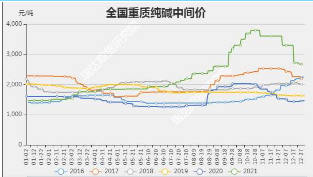
图3：全国重质纯碱中间价