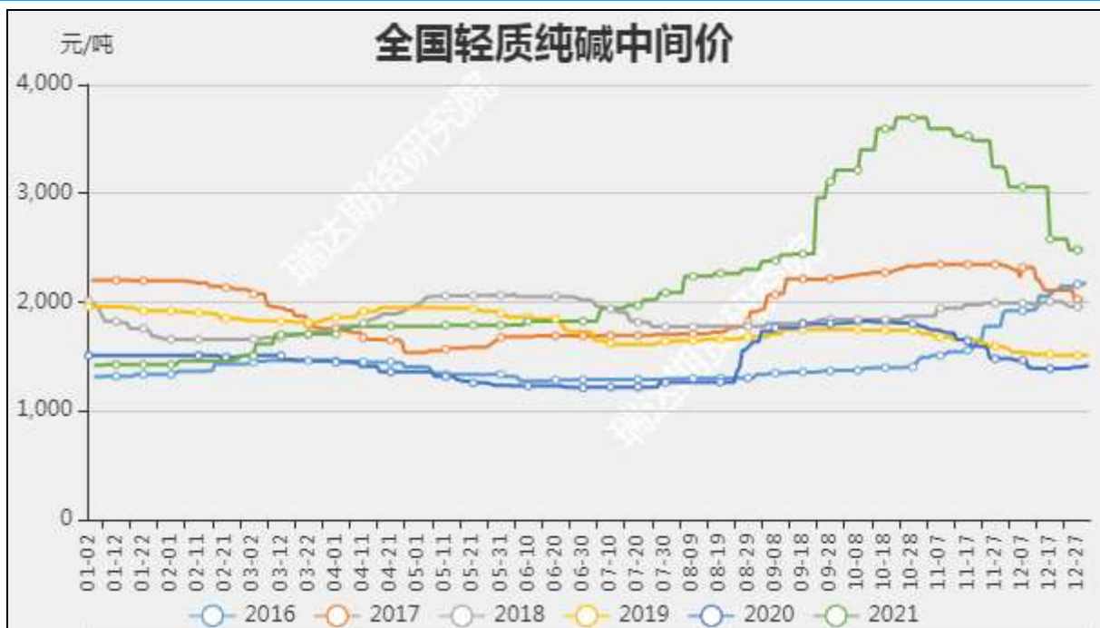
图4：全国轻质纯碱中间价