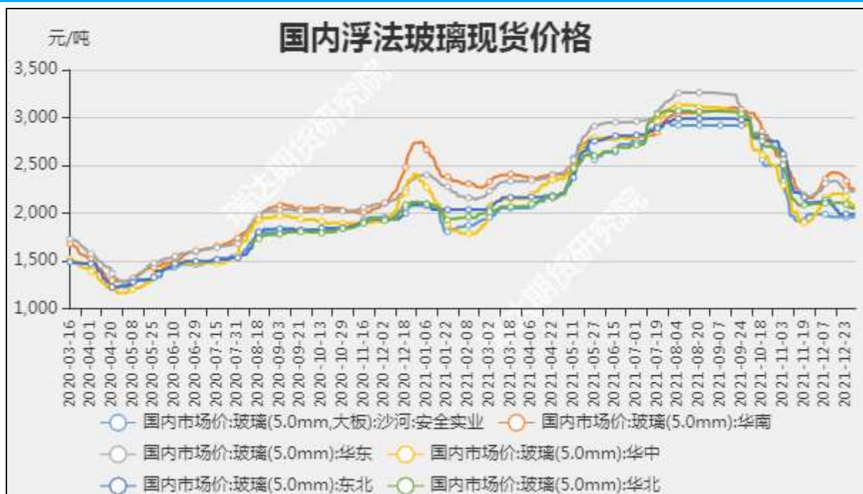
图5：国内玻璃现货价