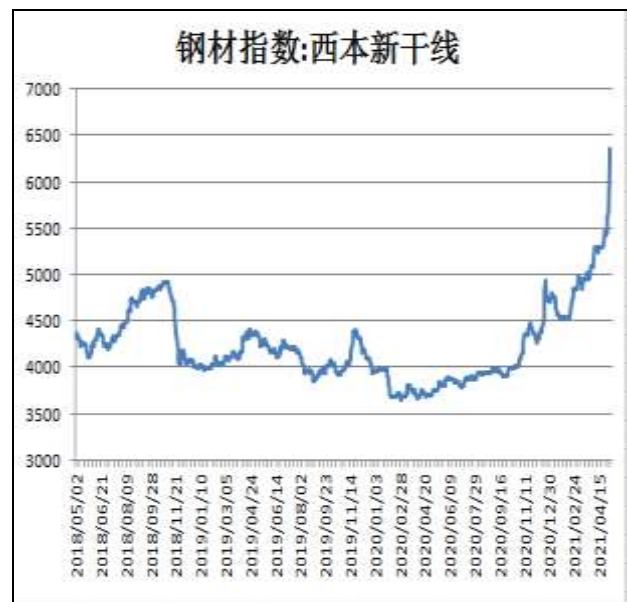
图2：西本新干线钢材价格指数

5月14日，上海热轧卷板5.75mm Q235现货报价为6200元/吨，周环比+200元/吨；全国均价为6514元/吨，周环比+504元/吨。