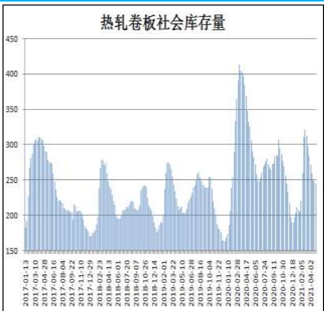
图10：全国33城热卷社会库存

5月13日，据Mysteel监测的全国33个主要城市社会库存为251.48万吨，较上周减少5.73万吨，较去年同期减少54.48万吨。