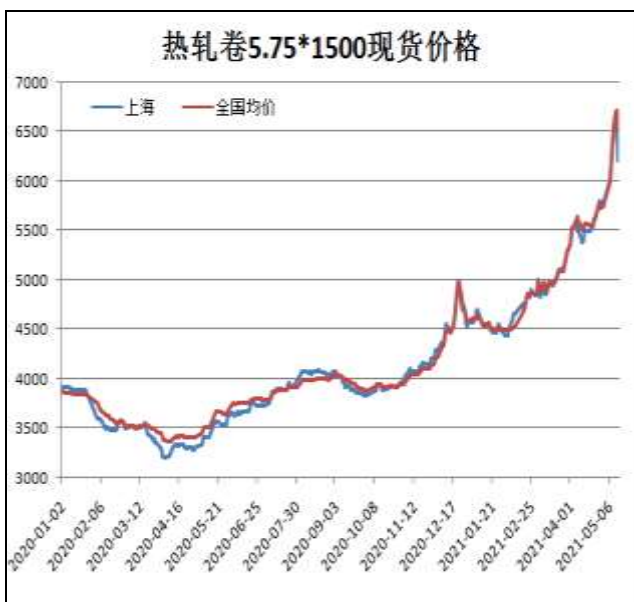
图1：热轧卷板现货价

5月14日，上海热轧卷板5.75mm Q235现货报价为6200元/吨，周环比+200元/吨；全国均价为6514元/吨，周环比+504元/吨。