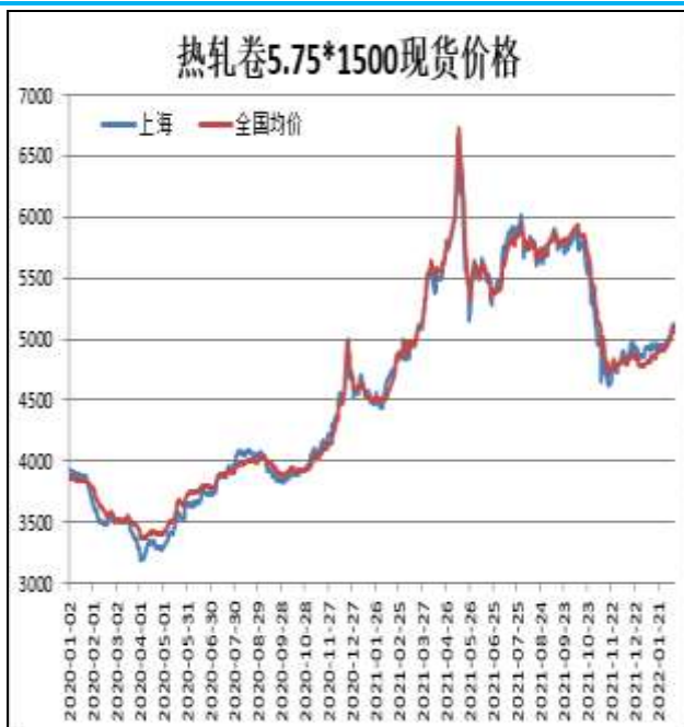
图1：热轧卷板现货价

2月11日，上海热轧卷板5.75mm Q235现货报价为5130元/吨，周环比+190元/吨；全国均价为5100元/吨，周环比+186元/吨。