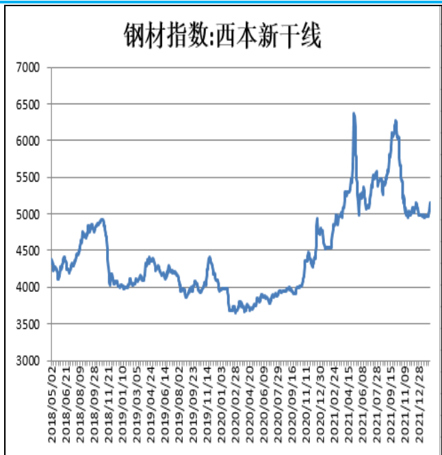
图2：西本新干线钢材价格指数

2月11日，上海热轧卷板5.75mm Q235现货报价为5130元/吨，周环比+190元/吨；全国均价为5100元/吨，周环比+186元/吨。