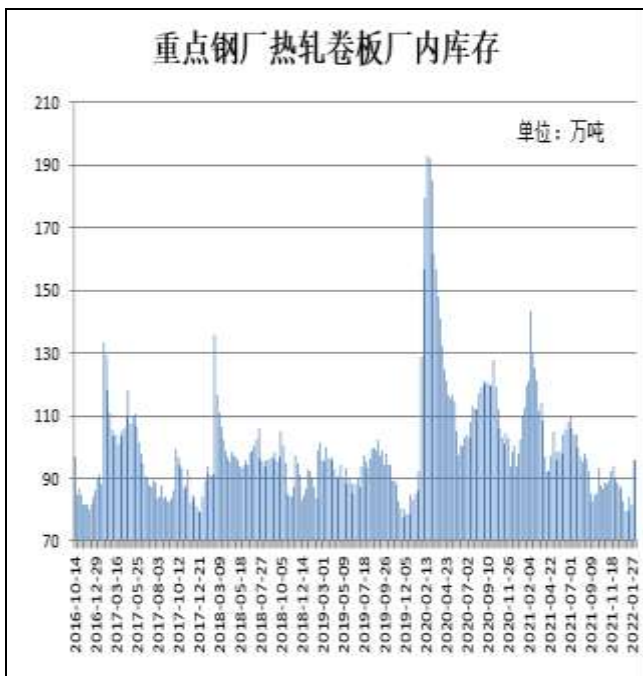
图9：样本钢厂热卷厂内库存

2月10日，据Mysteel监测的全国37家热轧板卷生产企业中热卷厂内库存量为95.93万吨，较上周增加0.38万吨，较去年同期减少47.41万吨。