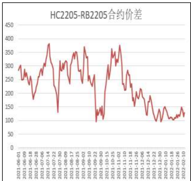
图6：热卷与螺纹跨品种套利

本周，HC2205合约走势强于RB2205合约，11日价差为128元/吨，周环比+12元/吨。