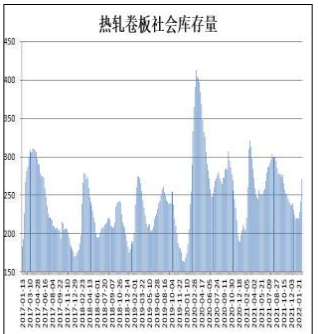
图10：全国33城热卷社会库存

2月10日，据Mysteel监测的全国33个主要城市社会库存为271.12万吨，较上周增加29.78万吨，较去年同期增加10.39万吨。