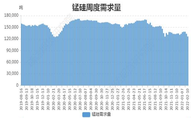
图16: 锰硅周度需求量

截止 2 月 10 日, 全国锰硅需求量(周需求): 126195 吨, 环比上周减 5.32%。