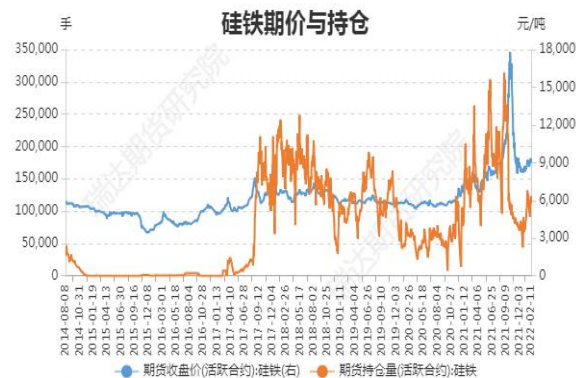
图3：硅铁期价与持仓

截止2月11日，硅铁期货主力合约收盘价 8988 元/吨，较前一周跌 58 元/吨；硅铁期货主力合约持仓量 112906 手，较前一周增 21444 手。