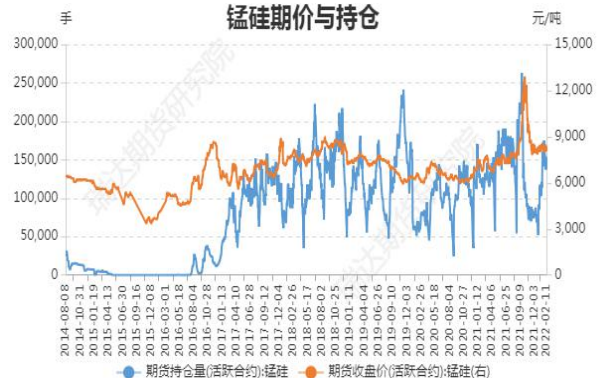
图4：锰硅期价与持仓

截止2月11日，锰硅期货主力合约收盘价 8058 元/吨，较前一周跌 296 元/吨；锰硅期货主力合约持仓量 153858 手，较前一周增 15151 手。