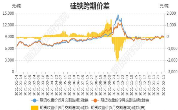
图5：硅铁期货跨期价差

截止 2 月 11 日，期货 SF2205 与 SF2209（远月-近月）价差为-32 元/吨，较前一周增 66 元/吨。