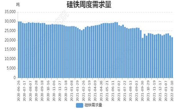
图14: 硅铁周度需求量

截至 2 月 10 日, 全国硅铁需求量(周需求): 21647 吨, 环比上周减 2.51%。