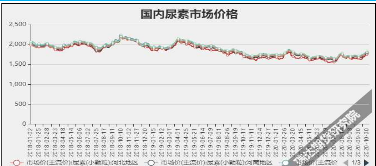
图3 国内尿素市场主流价

截至11月12日, NYMEX天然气收盘价2.95美元/百万英热单位, 较上周+0.02美元/百万英热单位。