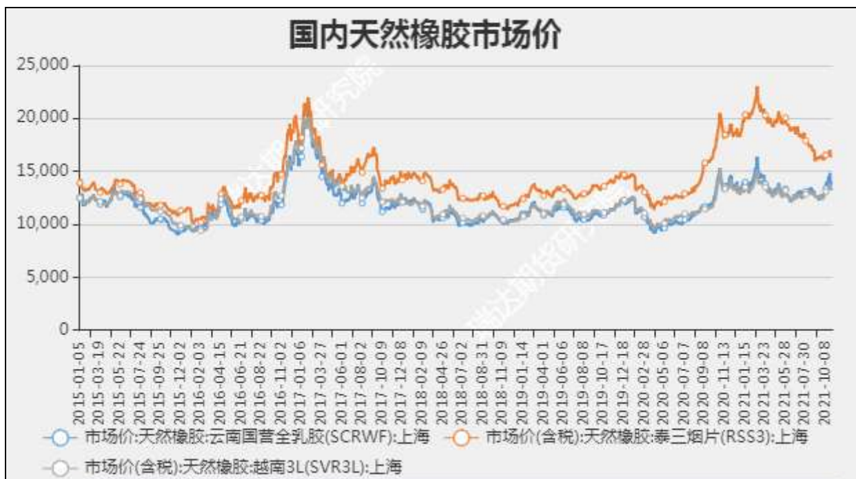
图4 国内天然橡胶市场价