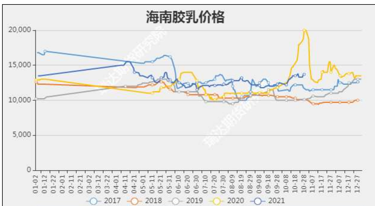
图3 海南新鲜胶乳收购价