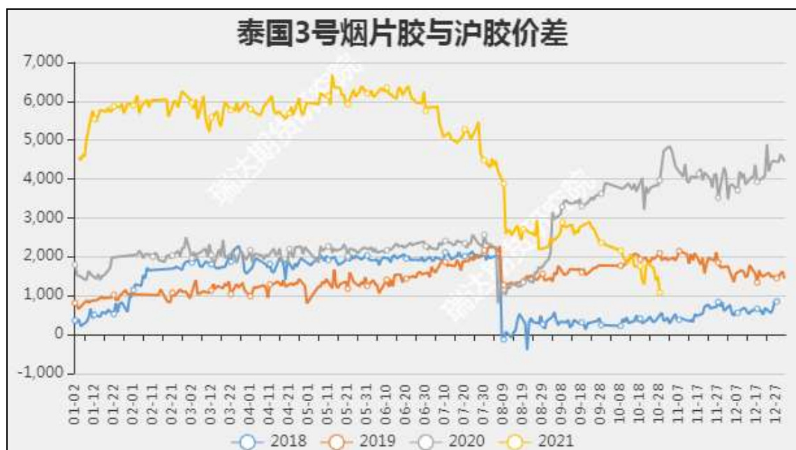
图9 泰国3号烟片胶与沪胶价差