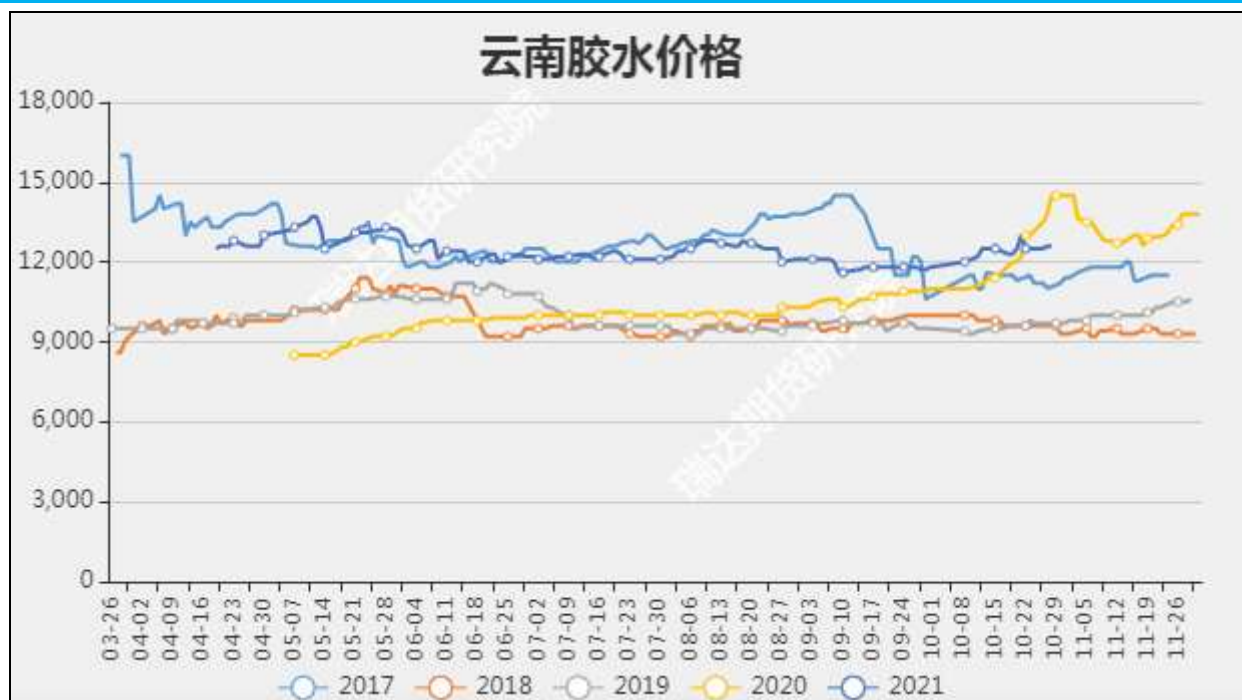
图2 云南胶水收购价