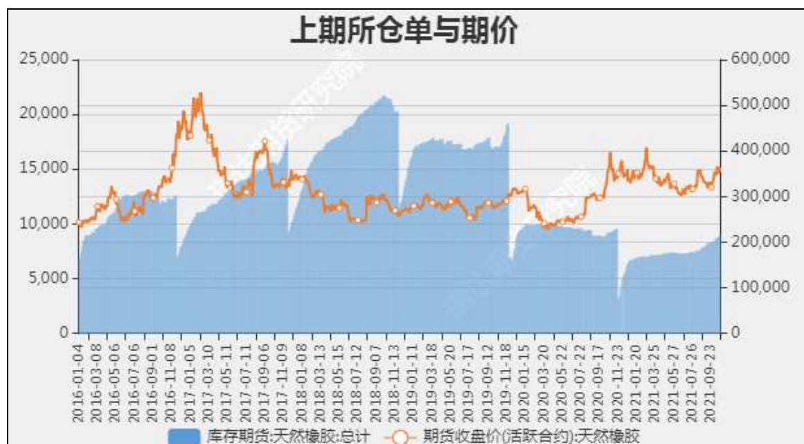
图12 沪胶期价与仓单走势对比