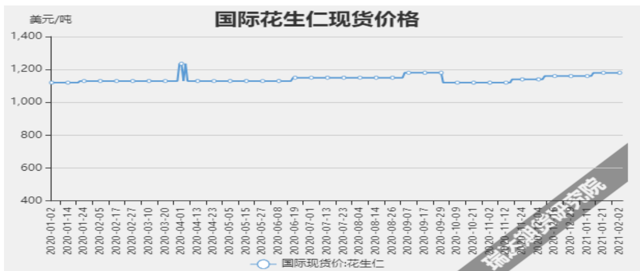
图3：花生仁国际现货价格