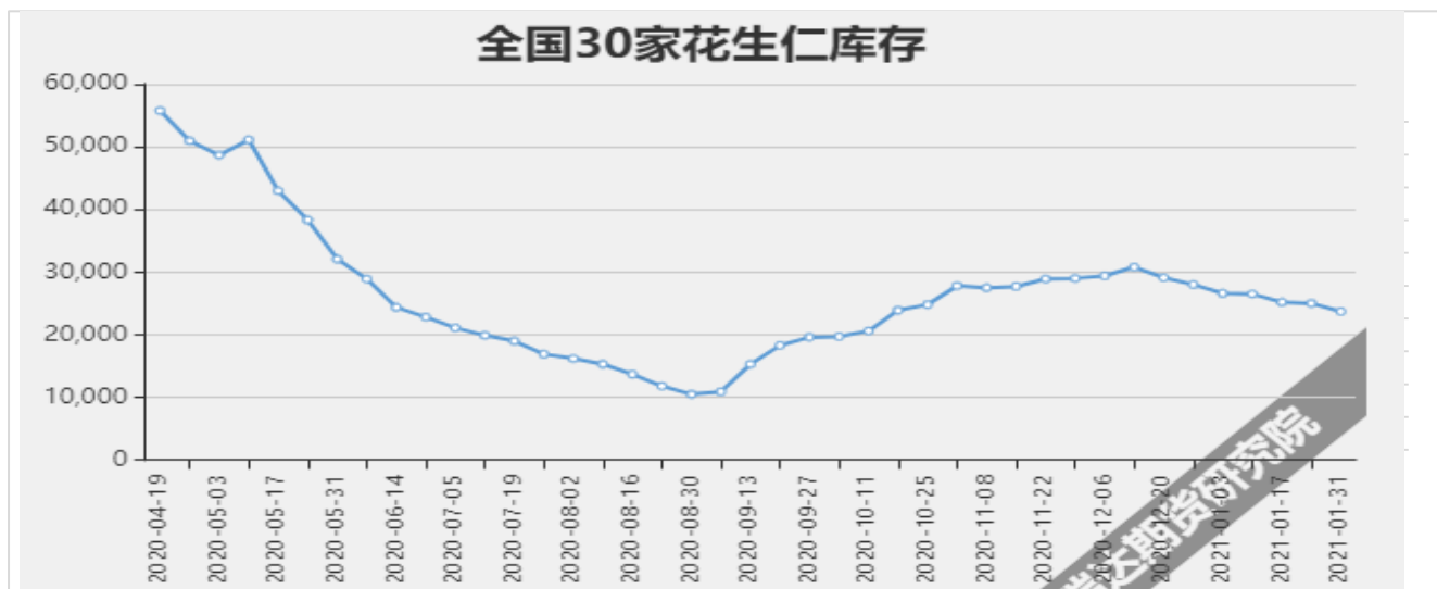
图6：全国30家花生仁库存