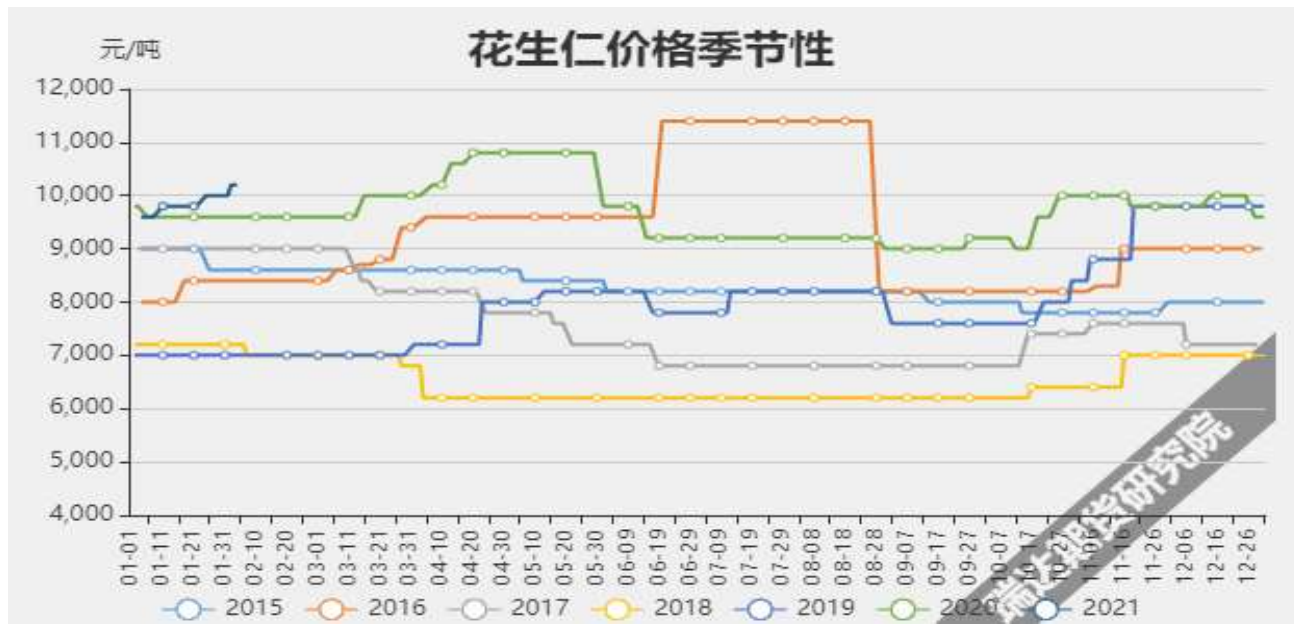
图2：花生现货价格季节性