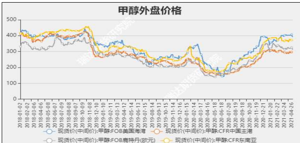
图5 外盘甲醇现货价格