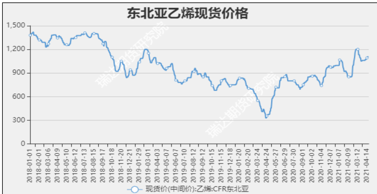
图13 东北亚乙烯现货价

截至5月6日当周，内陆地区部分甲醇代表性企业库存量36.58万吨，较上周+0.26万吨。