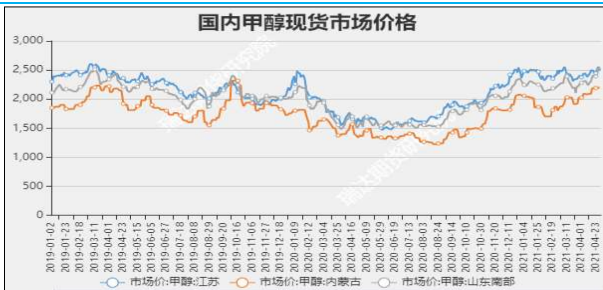
图3 甲醇现货市场主流价

截至5月6日，NYMEX天然气收盘价2.93美元/百万英热单位，较上周+0.02美元/百万英热单位。