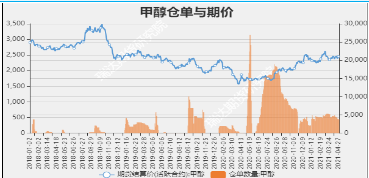
图7 甲醇期价与仓单数量