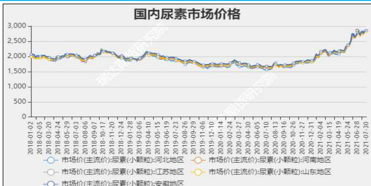
图3 国内尿素市场主流价

截至7月29日, NYMEX天然气收盘价4.06美元/百万英热单位, 较上周+0.06美元/百万英热单位。