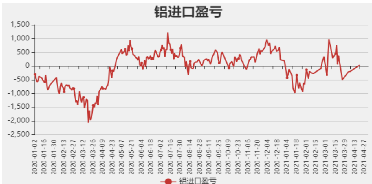
图5：铝进口利润和沪伦比值

截止至4月29日，贵阳氧化铝价格为2350元/吨；库存方面，截止至4月16日，国内总计库存为49.5万吨。