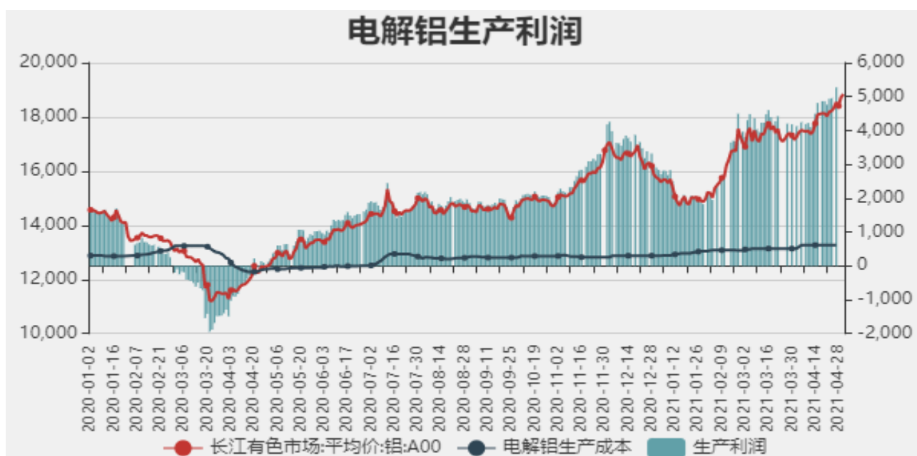
图11：电解铝生产利润