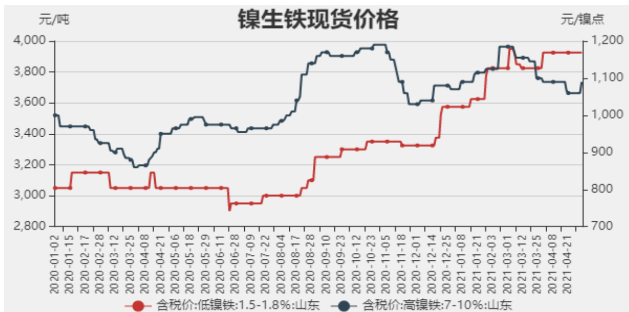
图1：镍生铁现货价格

截止至2021年4月30日，以山东地区为例，低镍铁（FeNi1.5-1.8）价格为3925元/吨，较上周持平，高镍生铁（FeNi7-10）价格为1090元/镍点，较上周上涨30元/镍点。