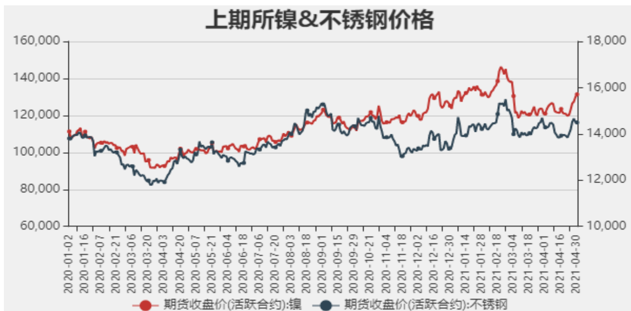
图2：国内镍现货价格

截止至2021年4月30日，沪镍期货价格为131410元/吨，不锈钢期货价格为14495元/吨。