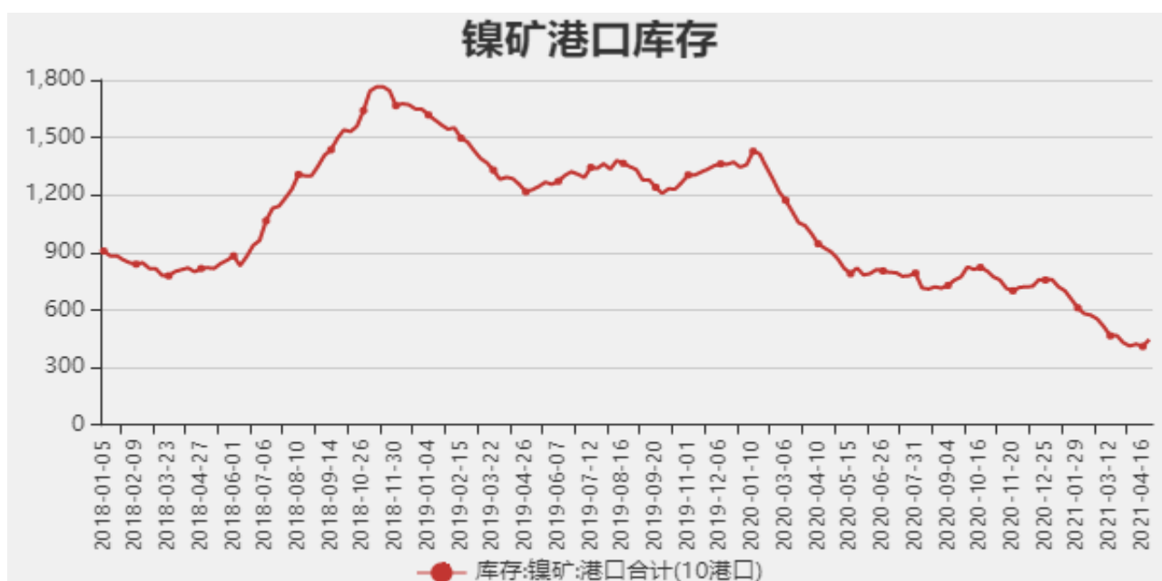
图3：国内镍矿港口库存