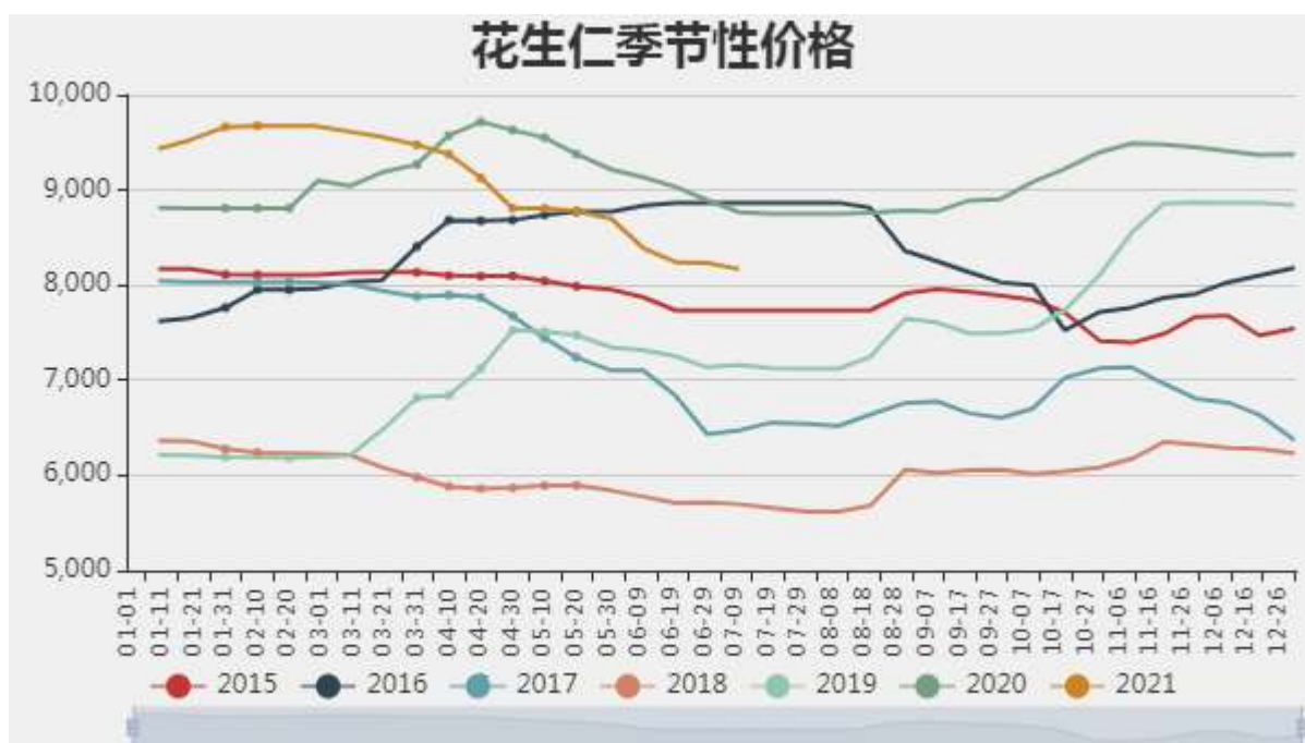
图2：花生仁现货价格季节性

播种季花生价格低去往年，恰逢玉米价格高企，花生、玉米“争地”现在普遍存在，可能因此减少花生种植面积。