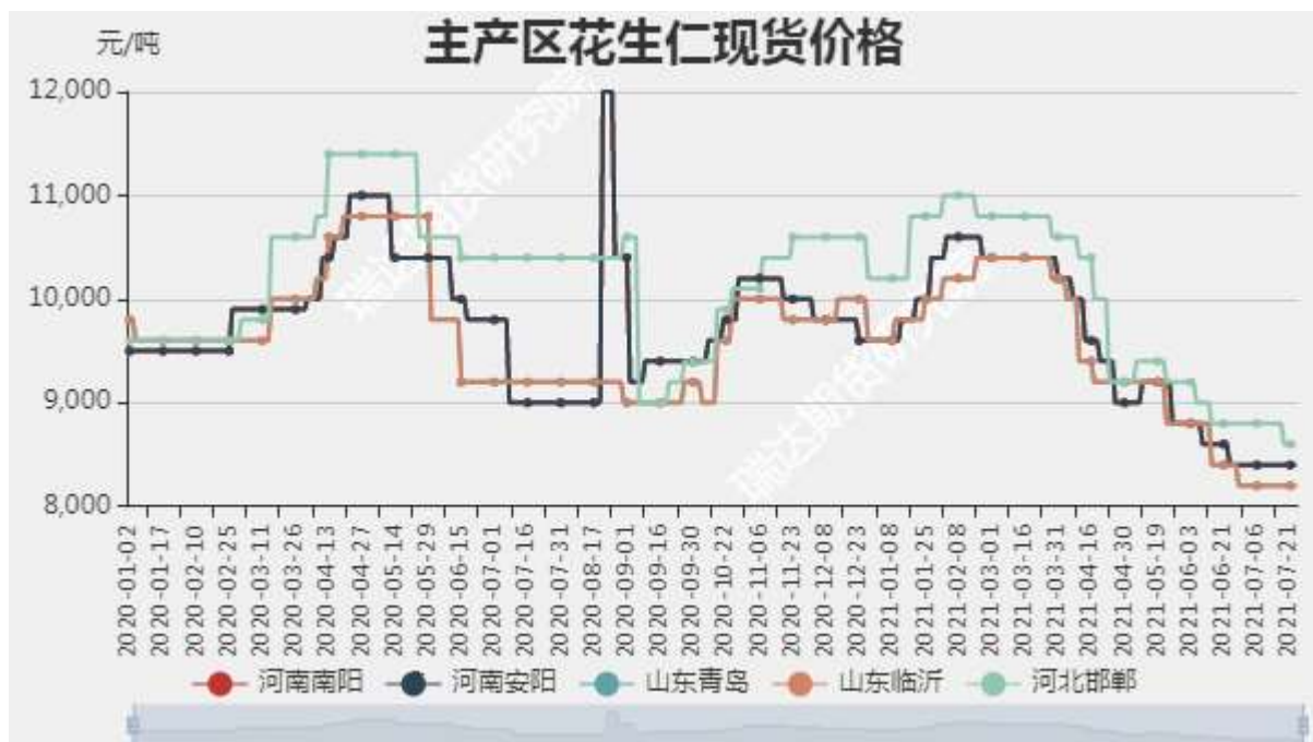
图1：主产区花生仁现货价格

油厂以消耗前期收储库存为主，另有进口低价花生补充需求缺口，对市场上的花生现货需求较少。市场需求疲软，花生价格下探。河南极端强降雨对花生种植产业几何，是否会造成花生大量减产仍需灾后评估。