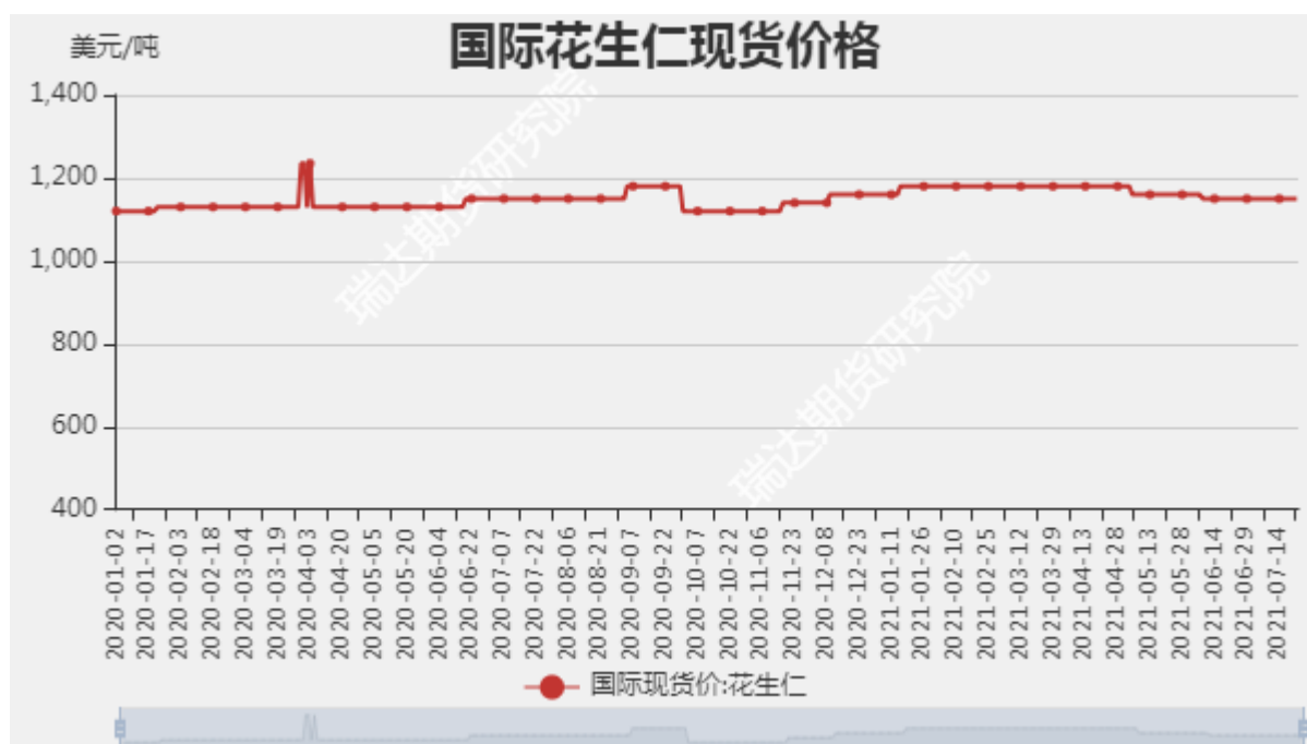
图3：花生仁国际现货价格