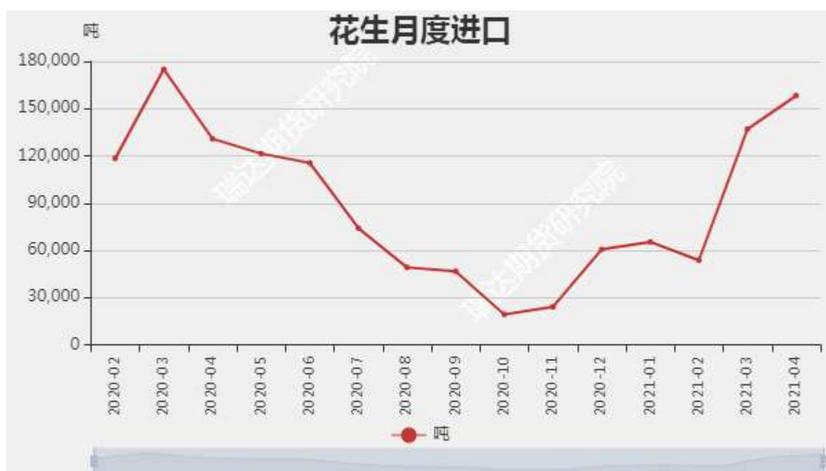
图7：花生月度进口量