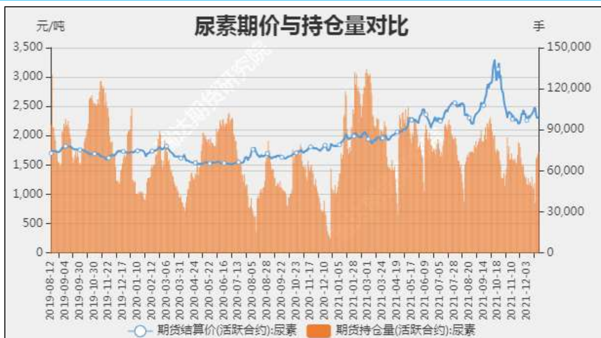
图6 尿素期货持仓量