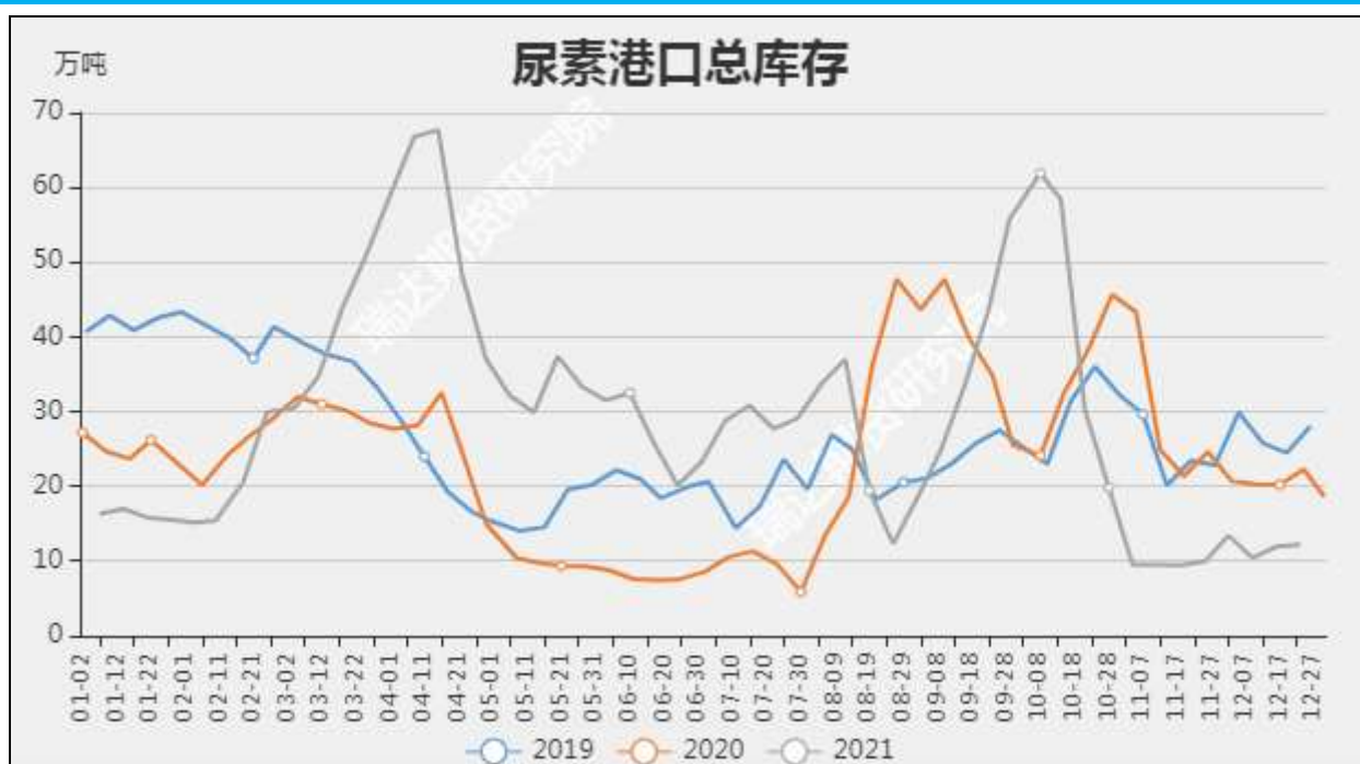
图9 国内尿素港口库存