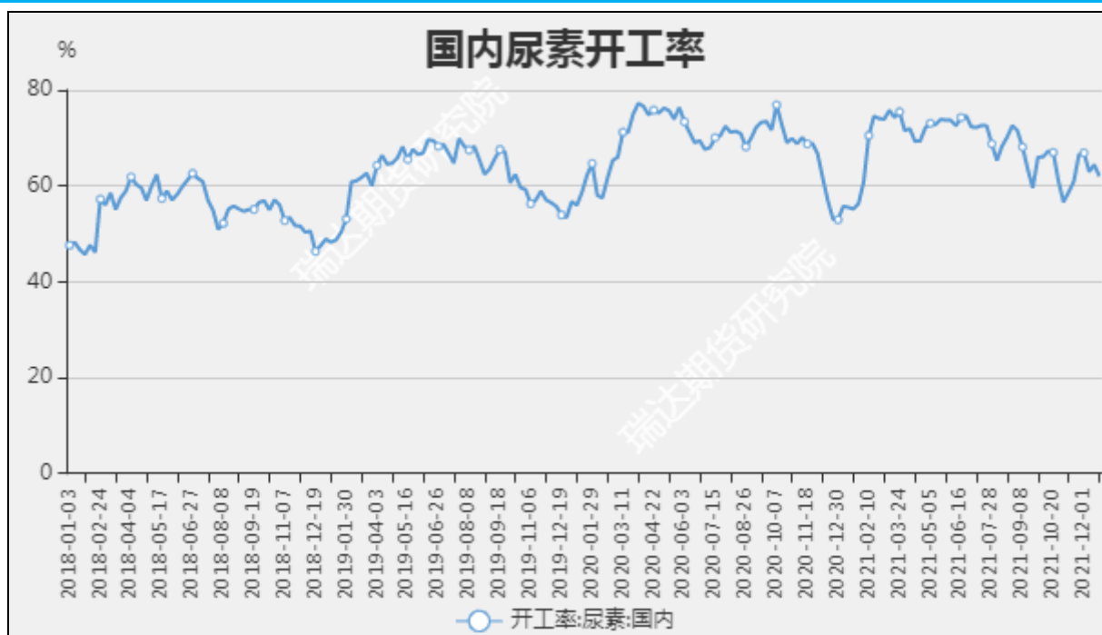
图8 国内尿素开工率