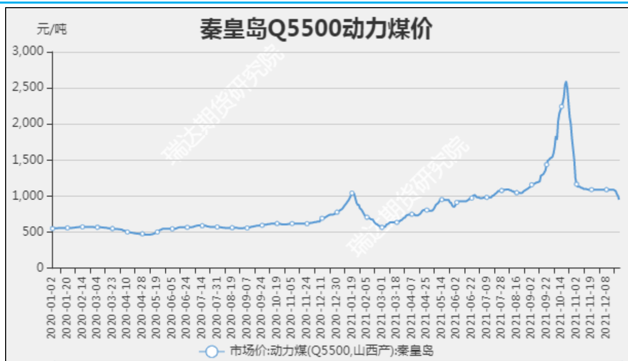
图1 秦皇岛动力煤市场价