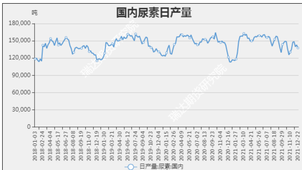
图7 国内尿素日产量