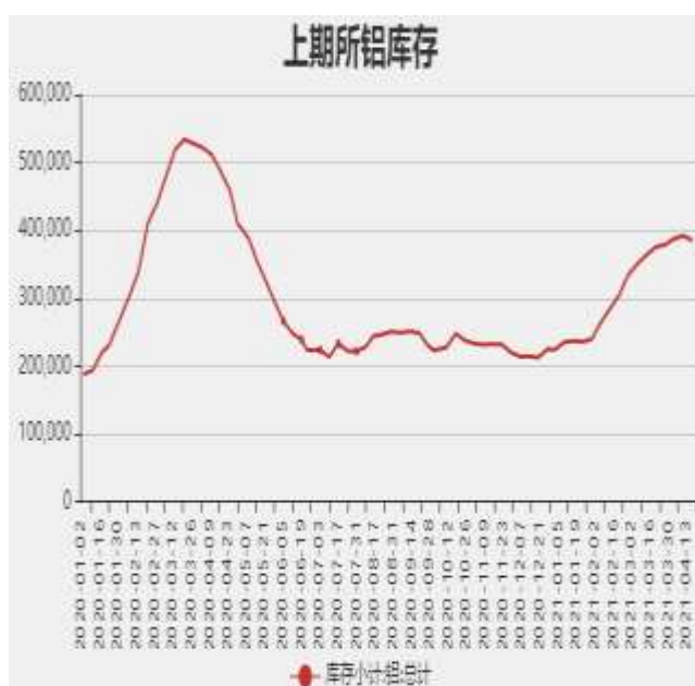
图8：上海期货交易所电解铝库存