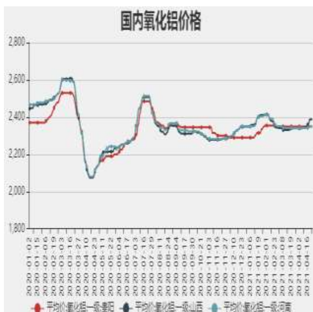
图3：国内氧化铝价格