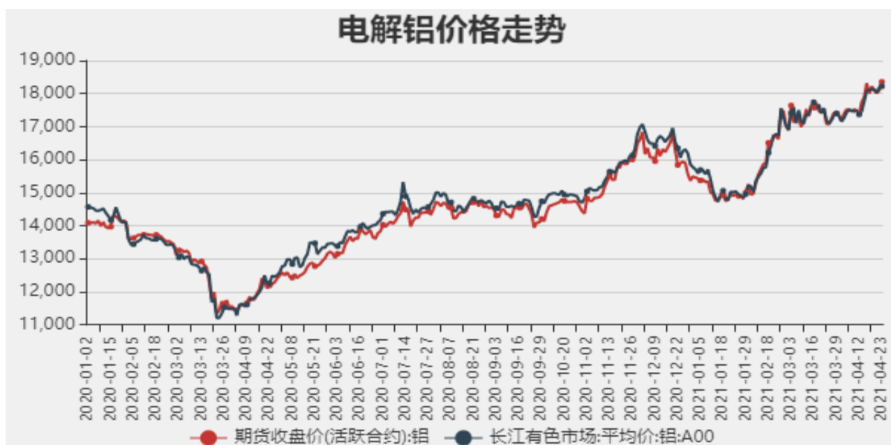
图1：电解铝期现价格

截止至2021年4月23日，长江有色市场1#电解铝平均价为18355元/吨，沪铝期货价格为18220元/吨。