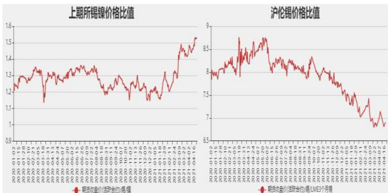
图8：沪伦锡价格比率

截止至2021年4月23日，锡镍以收盘价计算当前比价为1.5280，沪伦锡比值为6.9064。