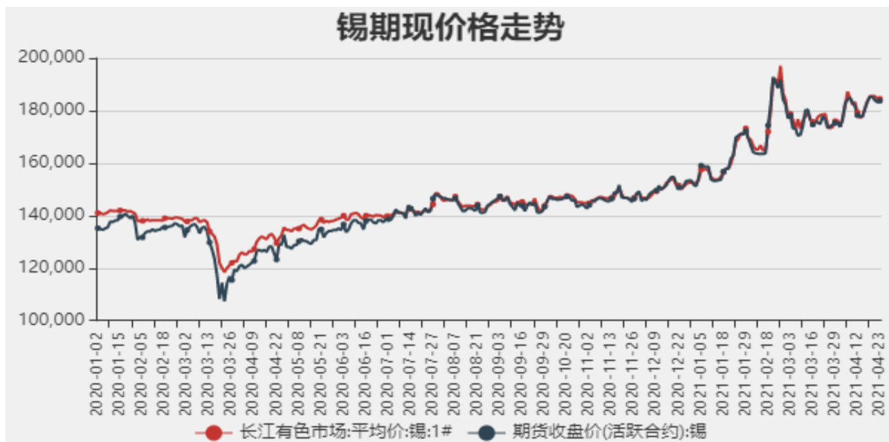
图1：国内锡现货价格

截止至2021年4月23日，长江有色金属市场1#锡平均价为184500元/吨，沪锡期货价格为183730元/吨。