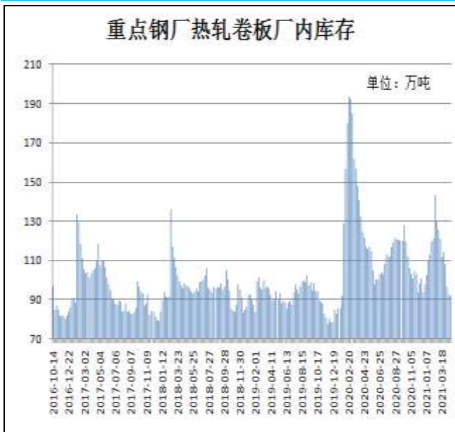
图9：样本钢厂热卷厂内库存

4月22日，据Mysteel监测的全国37家热轧板卷生产企业中热卷厂内库存量为92.13吨，较上周减少0.32万吨，较去年同期减少29.2万吨。