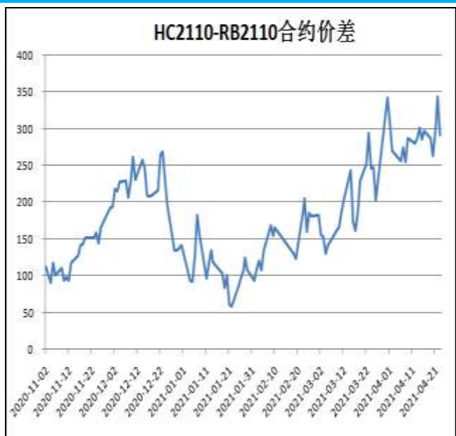
图6：热卷与螺纹跨品种套利

本周，HC2110合约走势弱于RB2110合约，23日价差为291元/吨，周环比-6元/吨。