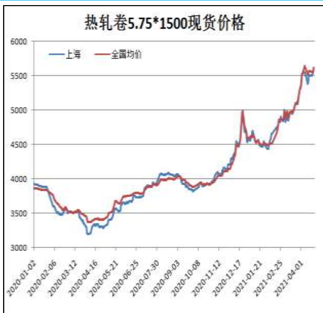
图1：热轧卷板现货价

4月23日，上海热轧卷板5.75mm Q235现货报价为5610元/吨，周环比+110元/吨；全国均价为5621元/吨，周环比+55元/吨。