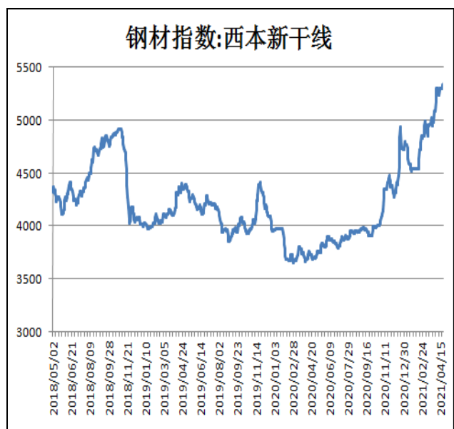
图2：西本新干线钢材价格指数

4月23日，上海热轧卷板5.75mm Q235现货报价为5610元/吨，周环比+110元/吨；全国均价为5621元/吨，周环比+55元/吨。