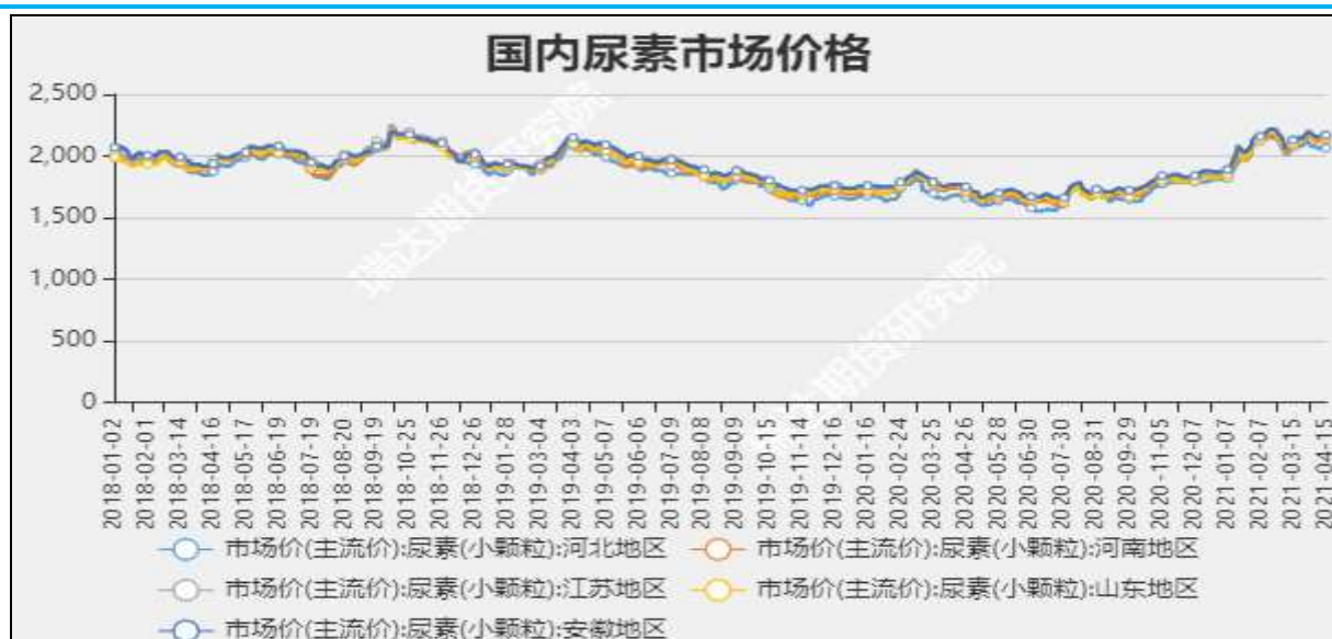
图3 国内尿素市场主流价

截至4月22日, NYMEX天然气收盘价2.75美元/百万英热单位, 较上周+0.09美元/百万英热单位。