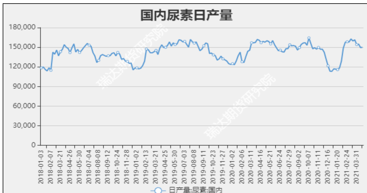
图7 国内尿素日产量