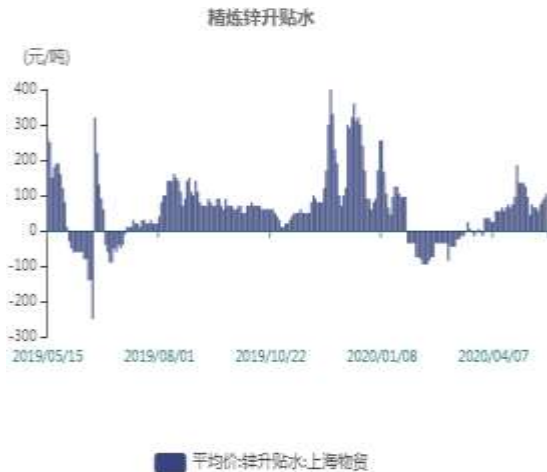
图10：上海精炼锌贴水走势图

截止至2020年05月14日，LME3个月锌期货价格为1968美元/吨，LME锌现货结算价为1939美元/吨。