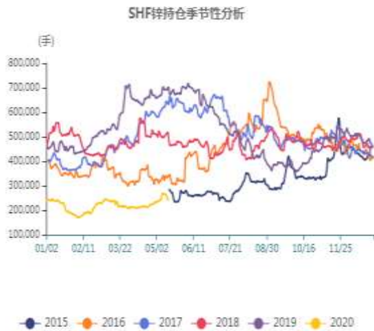
图5：沪锌季节性持仓走势图