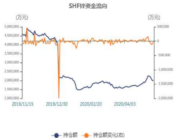
图4：期锌持仓资金走势图