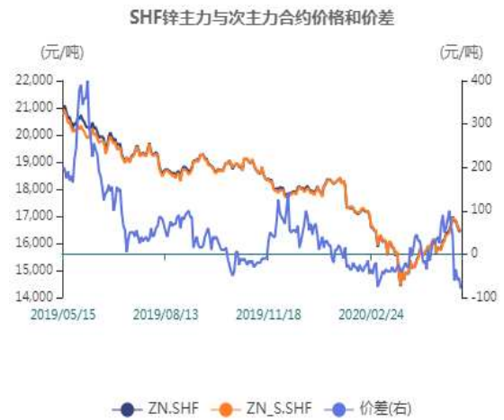
图6：沪锌主力与次主力价差走势图