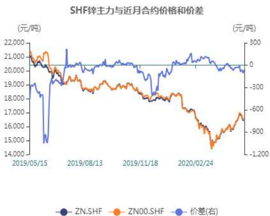
图7：沪锌近月与远月价差走势图