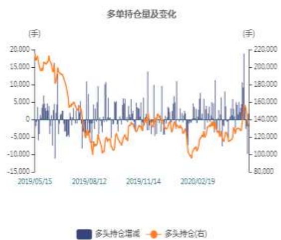
图2：沪锌多头持仓走势图