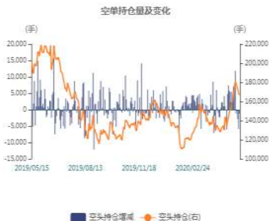
图3：沪锌空头持仓走势图