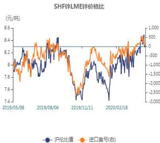
图1：锌两市比值走势图