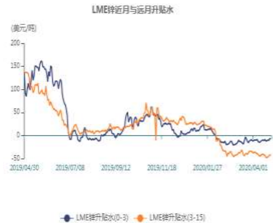
图11：LME锌现货升水走势图

截止至2020年05月14日，LME近月与3月价差报价为1.25美元/吨，3月与15月价差报价为贴水38.75美元/吨