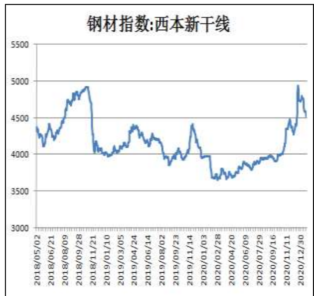
图2：西本新干线钢材价格指数