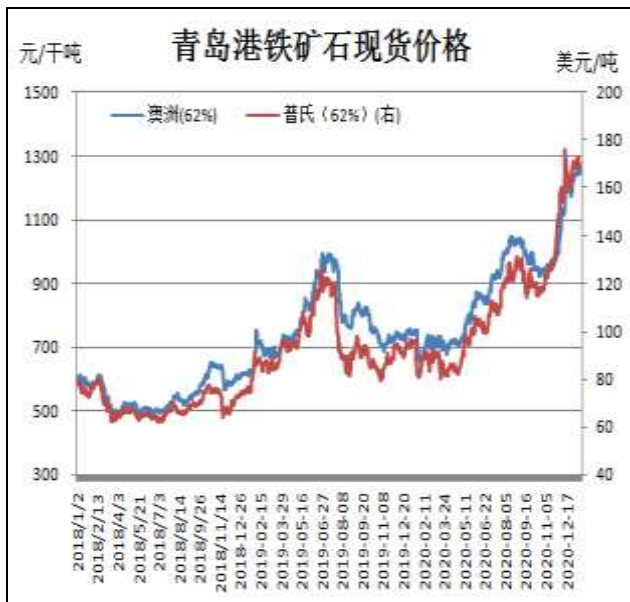
图1：铁矿石现货价格走势