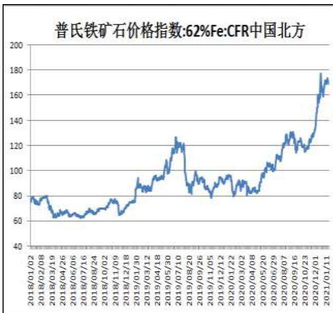
图9：62%铁矿石普氏指数

本周，62%铁矿石普氏指数小幅回落，21日价格为170.55美元/吨，周环比-2.25美元/吨