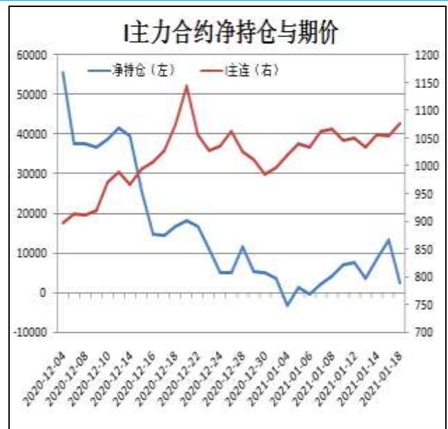
图14: 铁矿主力合约前20名净持仓

I2105合约前20名净持仓情况，15日为净多6896手，22日为净多2384手，净多减少4512手，由于主流持仓多单减幅略大于空单。