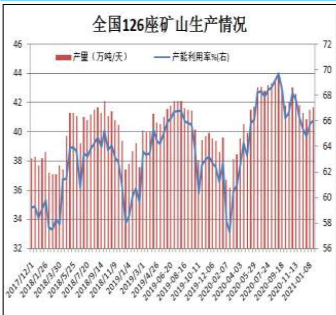
图13: 全国126座矿山产能利用率

据Mysteel统计，截止1月22日全国126座矿山样本产能利用率为66.03%，环比上期调研增0.24%；库存103.4万吨，增1.74万吨。