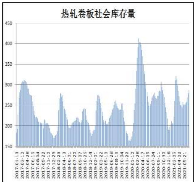
图10：全国33城热卷社会库存

7月15日，据Mysteel监测的全国33个主要城市社会库存为291.64万吨，较上周增加4.29万吨，较去年同期增加22.56万吨。