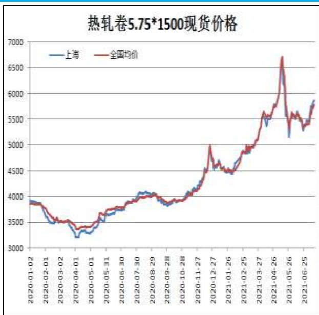
图1：热轧卷板现货价

7月16日，上海热轧卷板5.75mm Q235现货报价为5870元/吨，周环比+150元/吨；全国均价为5786元/吨，周环比+176元/吨。