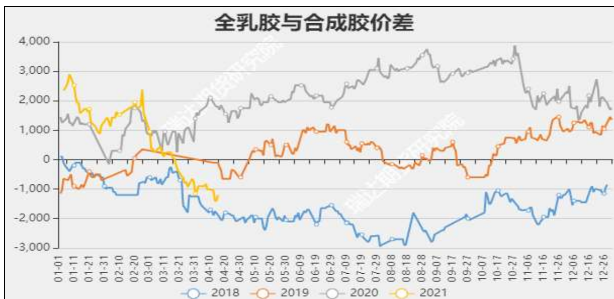
图10 全乳胶与合成胶价差

截至4月15日, 华东市场丁苯橡胶14200元/吨, 较上周-200元/吨; 华北市场顺丁橡胶报12920元/吨, 较上周-700元/吨。