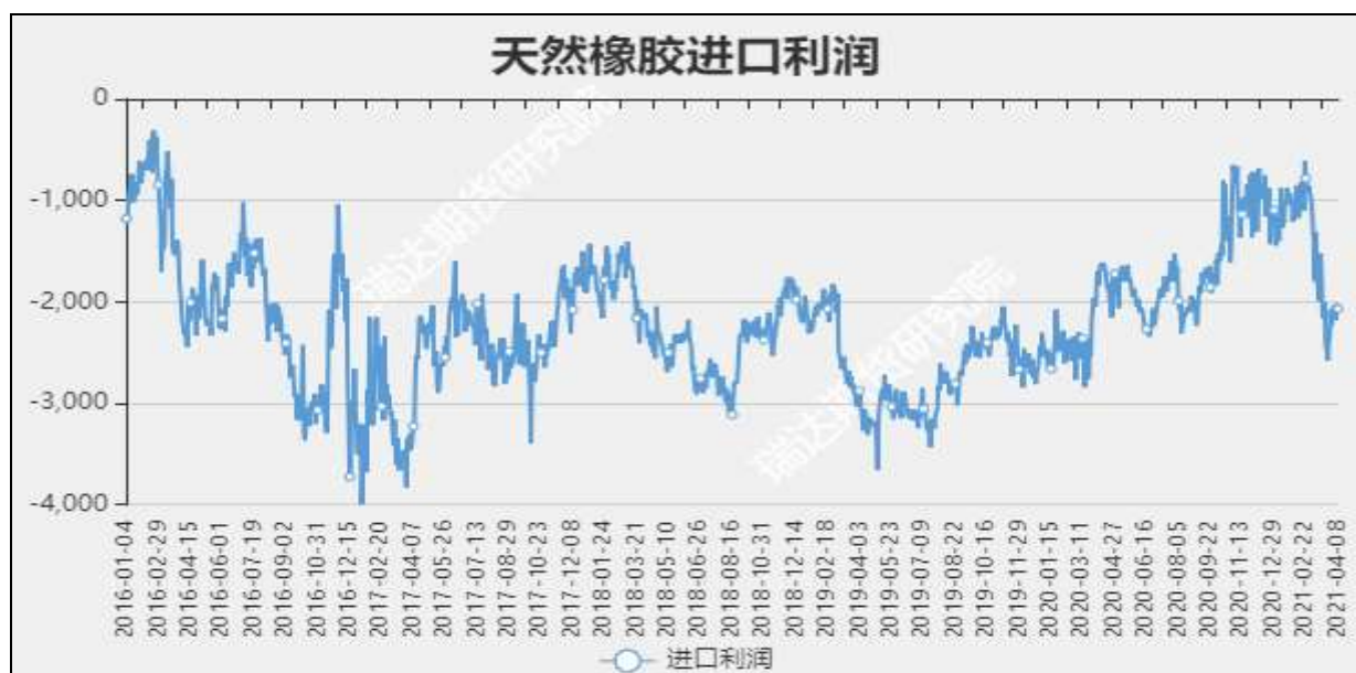
图14 天然橡胶进口利润

截至4月12日，烟片胶加工利润53.26美元/吨，较上周-12.1美元/吨；标胶加工利润-16.08美元/吨，较上周-20.28美元/吨。