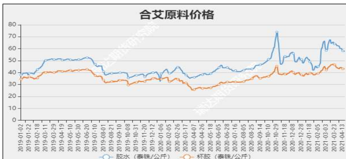
图1 国内天然橡胶市场价