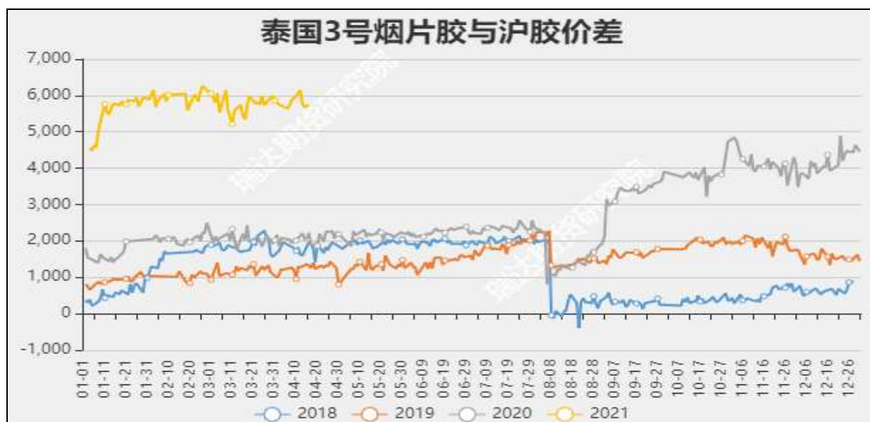
图8 泰国3号烟片胶与沪胶价差