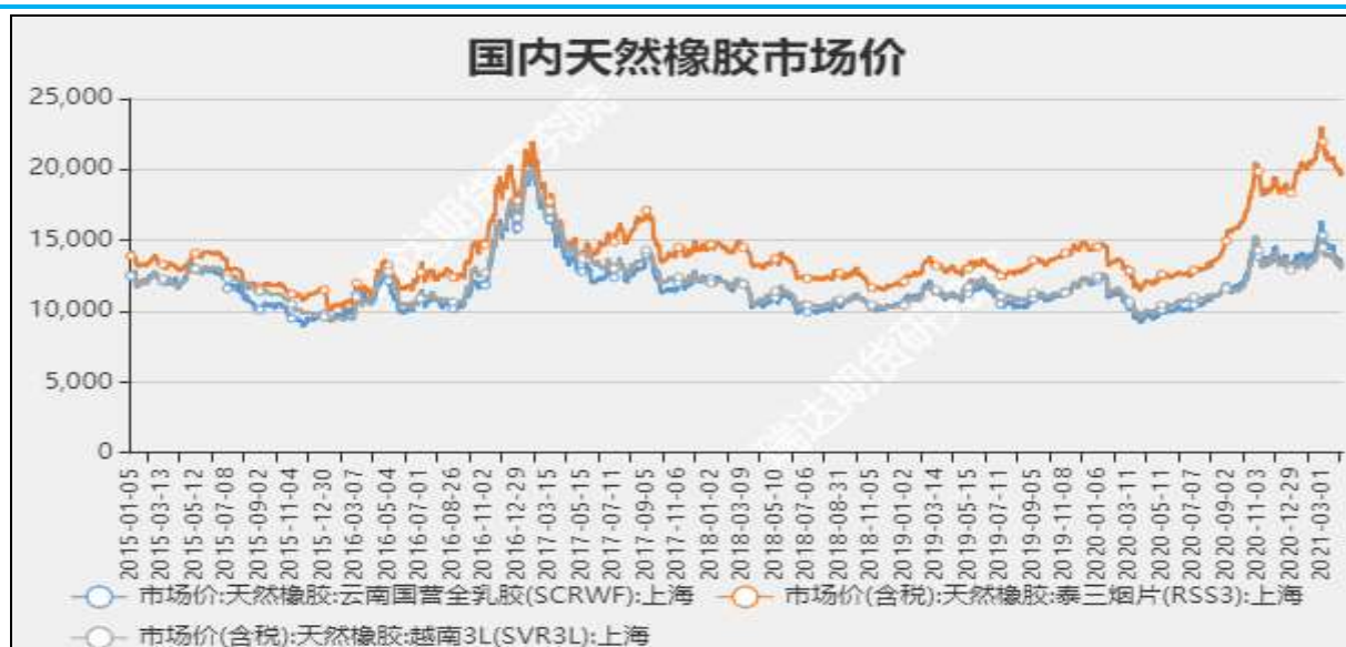
图2 国内天然橡胶市场价