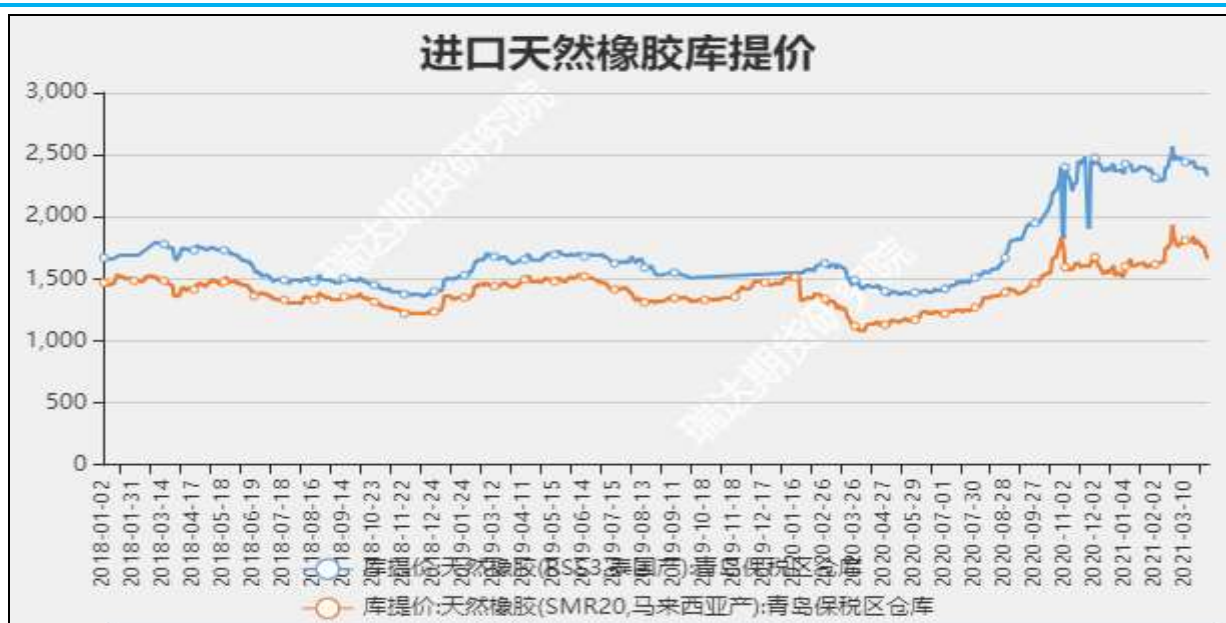
图3 进口天然橡胶库提价

截至4月16日, 上海市场19年国营全乳胶报13100元/吨, 较上周-100元/吨。