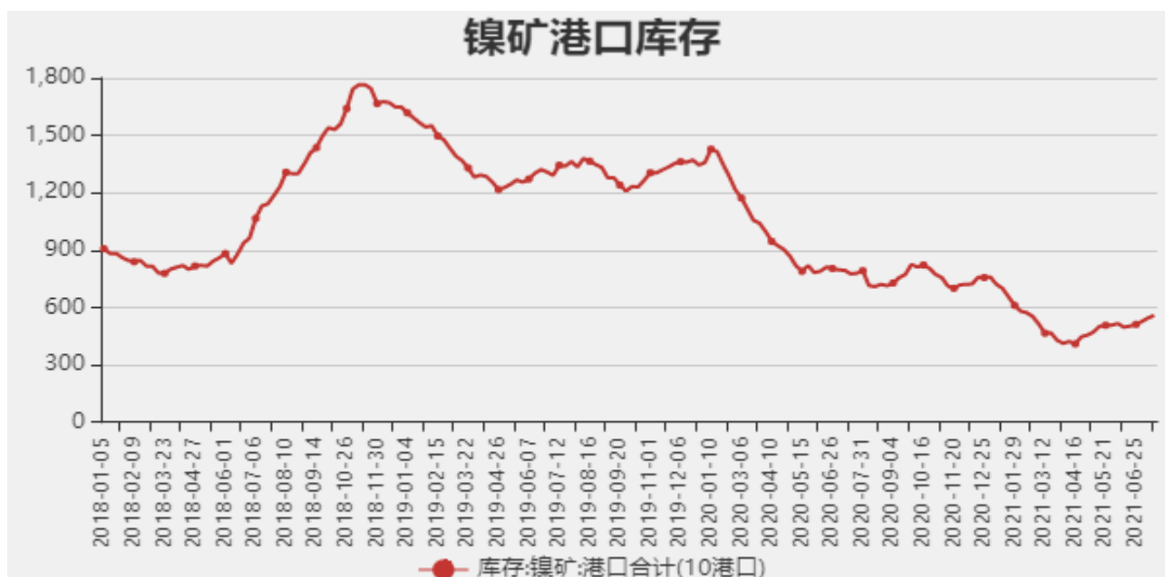
图3：国内镍矿港口库存