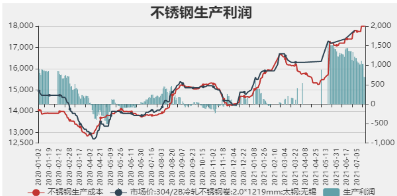
图9：不锈钢生产利润