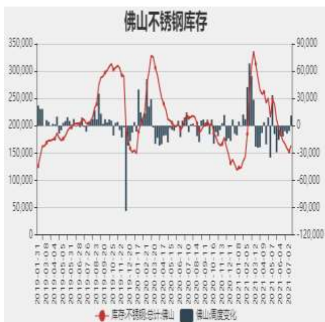
图5：佛山不锈钢月度库存