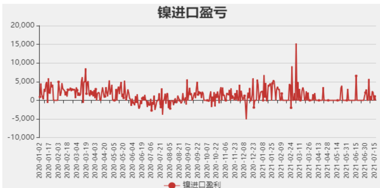
图4：镍进口盈亏分析