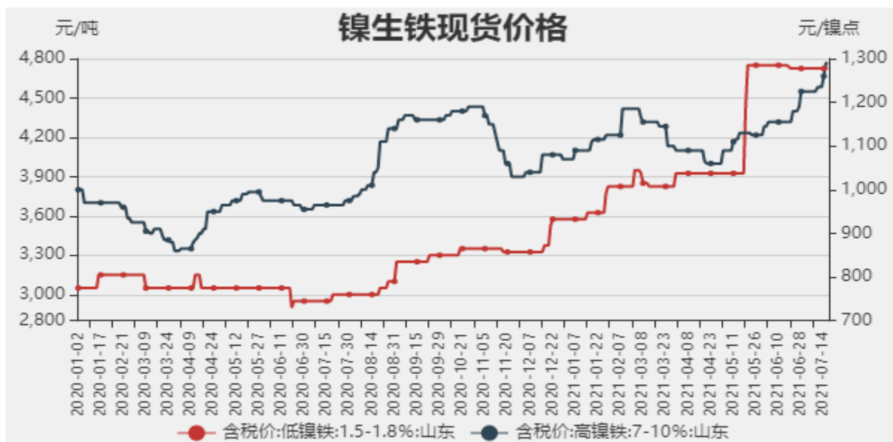
图1：镍生铁现货价格

截止至2021年7月16日，以山东地区为例，低镍铁(FeNi1.5-1.8)价格为4725元/吨，高镍生铁(FeNi7-10)价格为1290元/镍点。