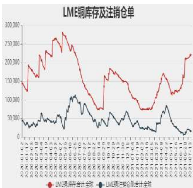
图7：LME铜库存及注销仓单