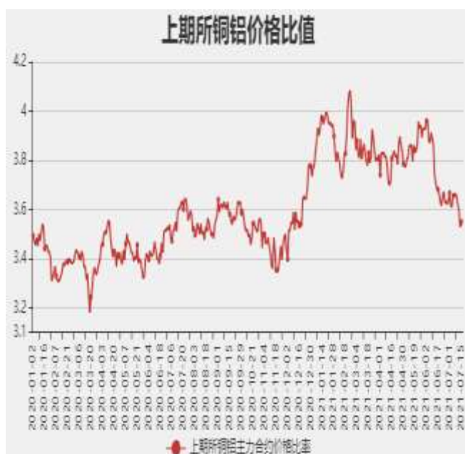
图9：沪铜和沪铝主力合约价格比率