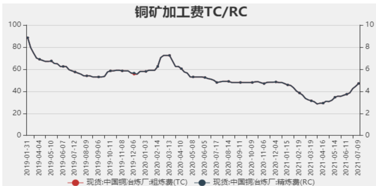
图2：中国铜冶炼加工费

2021年7月9日中国铜冶炼厂粗炼费（TC）为47.1美元/干吨，精炼费（RC）为4.71美分/磅，较上周上调4.7美元/干吨。