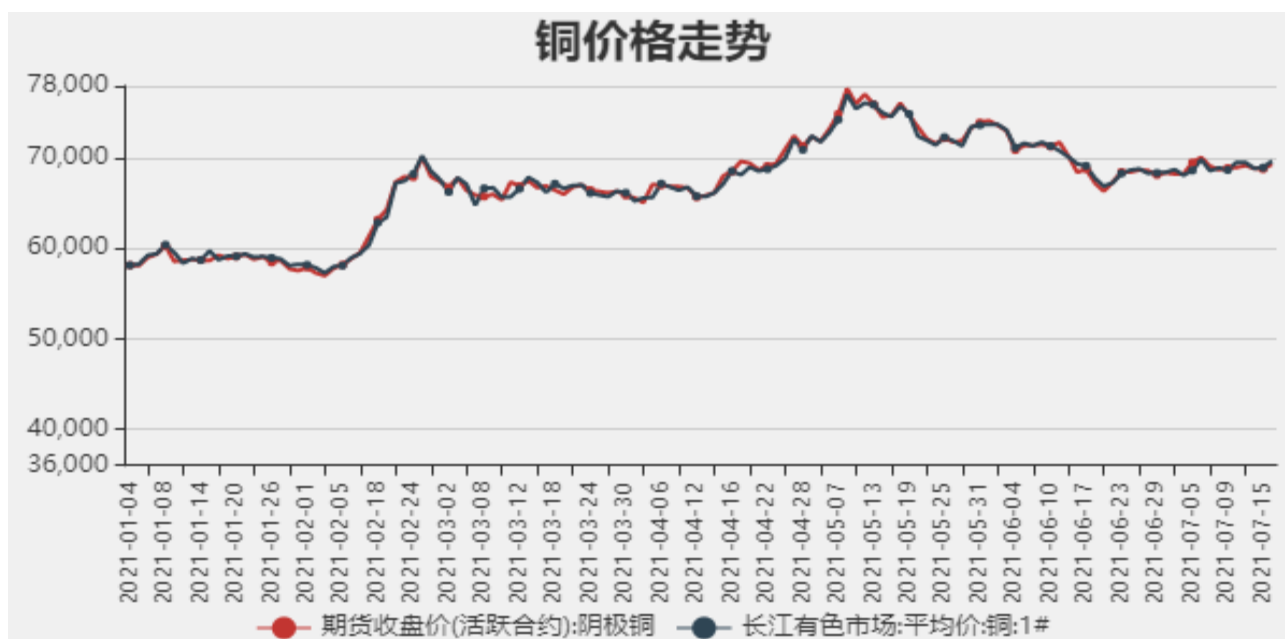
图1：铜期现价格走势

截止至2021年7月16日，长江有色市场1#电解铜平均价为69340元/吨；电解铜期货价格为69710元/吨。