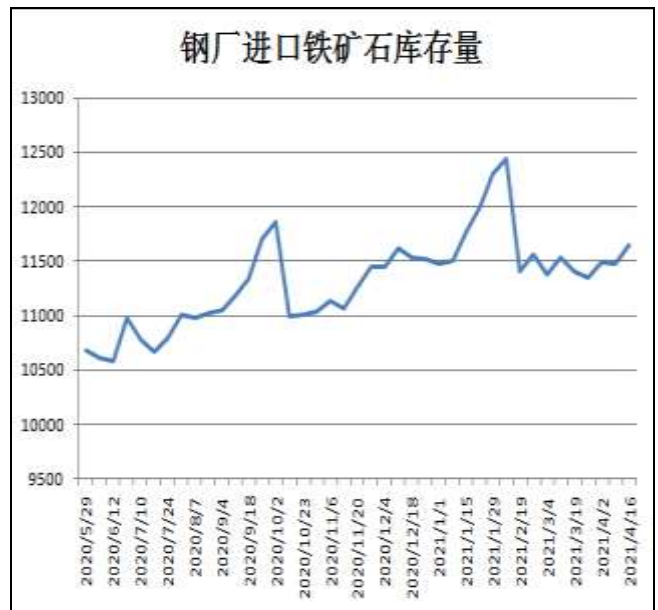
图10：钢厂铁矿石库存量

16日据Mysteel统计样本钢厂进口铁矿石库存总量11641.1万吨，环比增加172.37万吨；当前样本钢厂的进口矿日耗为290.29万吨，环比增加2.67万吨