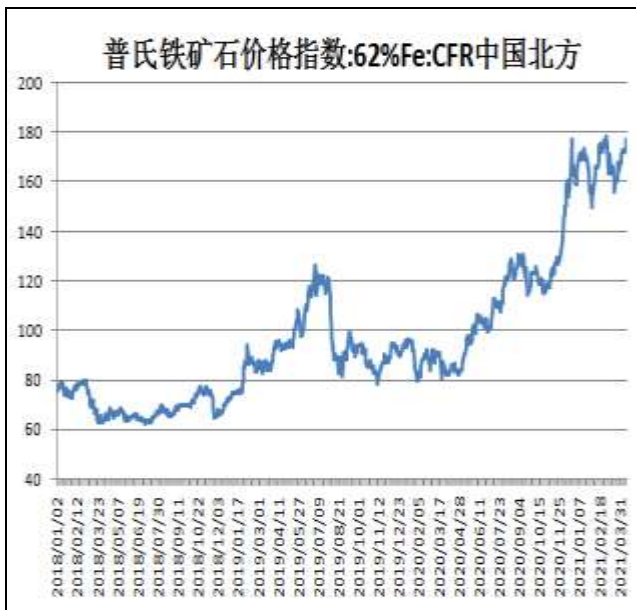
图9：62%铁矿石普氏指数

本周，62%铁矿石普氏指数震荡上行，15日价格为177.3美元/吨，周环比+4.95美元/吨。