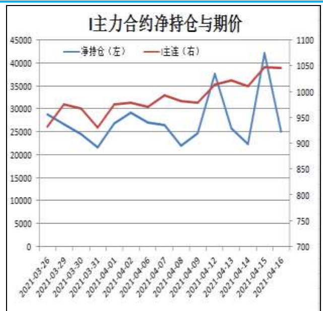
图14: 铁矿主力合约前20名净持仓

I2109合约前20名净持仓情况，9日为净多24656手，16日为净多25097手，净多增加441手，由于主流持仓多单增幅略大于空单。