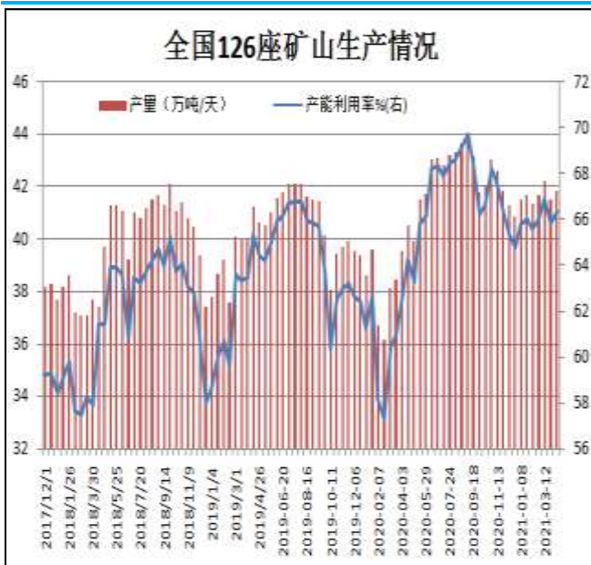
图13: 全国126座矿山产能利用率

据Mysteel统计，截止4月9日全国126座矿山样本产能利用率为66.36%，环比上期调研增0.51%；库存141.85万吨，增11.1万吨。