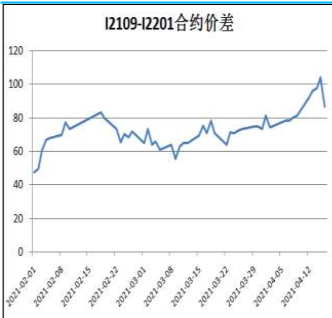
图5：铁矿石跨期套利

本周，I2109合约走势强于I2201合约，16日价差为86.5元/吨，周环比+5.5元/吨。