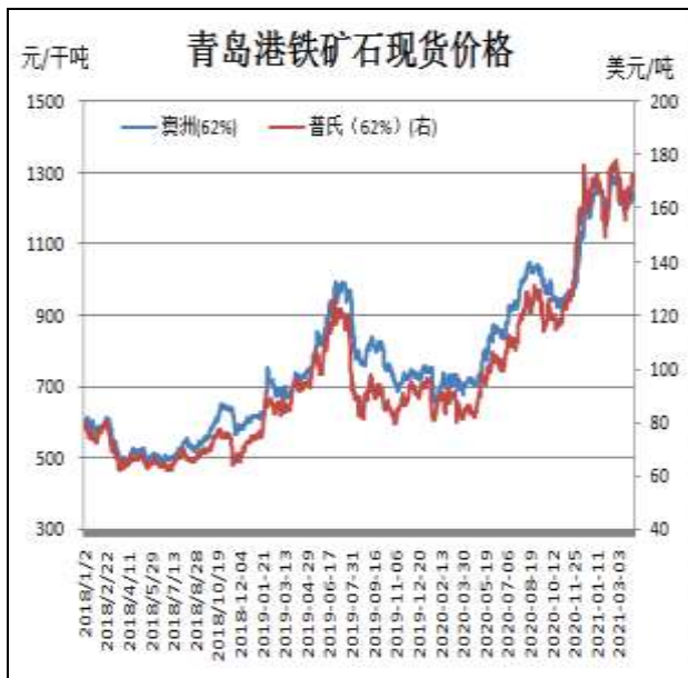
图1：铁矿石现货价格走势