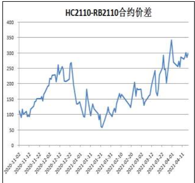
图6：热卷与螺纹跨品种套利

本周，HC2110合约走势强于RB2110合约，16日价差为297元/吨，周环比+10元/吨。