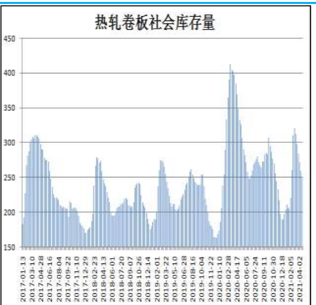
图10：全国33城热卷社会库存

4月16日，据Mysteel监测的全国33个主要城市社会库存为249.4万吨，较上周减少10.29万吨，较去年同期减少119.55万吨。