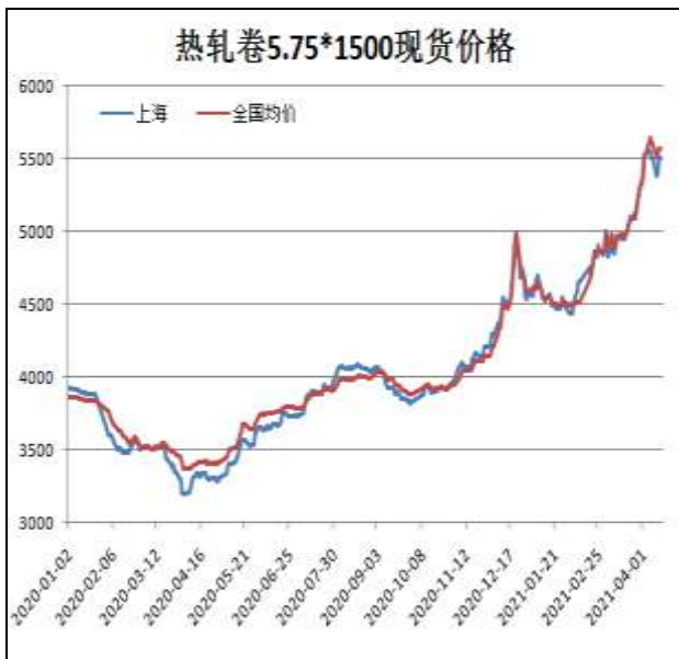
图1：热轧卷板现货价

4月16日，上海热轧卷板5.75mm Q235现货报价为5500元/吨，周环比+0元/吨；全国均价为5566元/吨，周环比-33元/吨。