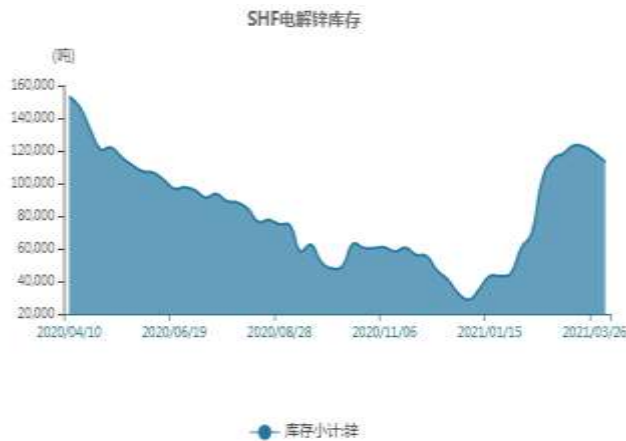
图11: 上海锌库存走势图

截止至2021年4月16日，上海期货交易所精炼锌库存为111663吨，较上一周减625吨。