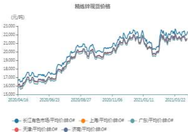
图7、国内锌锭价格走势图

截止至2021年4月16日，长江有色市场0#锌均价22400元/吨；上海、广东、天津、济南四地现货价格分别为21580、21440、21550、21600元/吨。