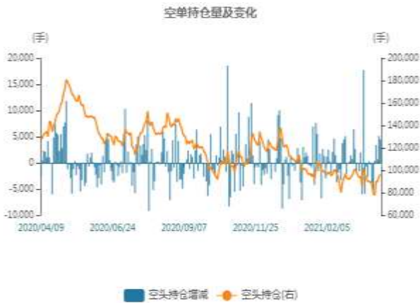
图5：沪锌主力与次主力价差走势图