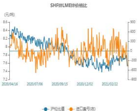
图1：锌两市比值走势图