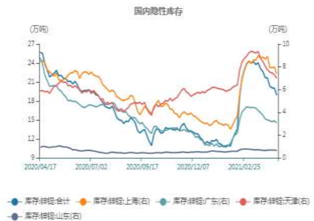
图14: 国内隐性库存走势图