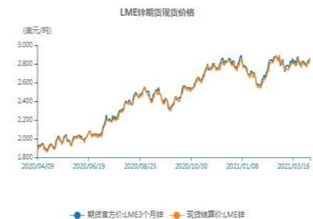
图8、LME锌现货价格走势图

截止至2021年4月15日，LME3个月锌期货价格为2870美元/吨，LME锌现货结算价为2809.5美元/吨。