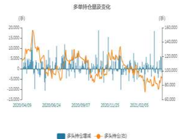
图2：沪锌多头持仓走势图