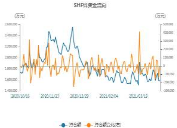
图6：沪锌近月与远月价差走势图