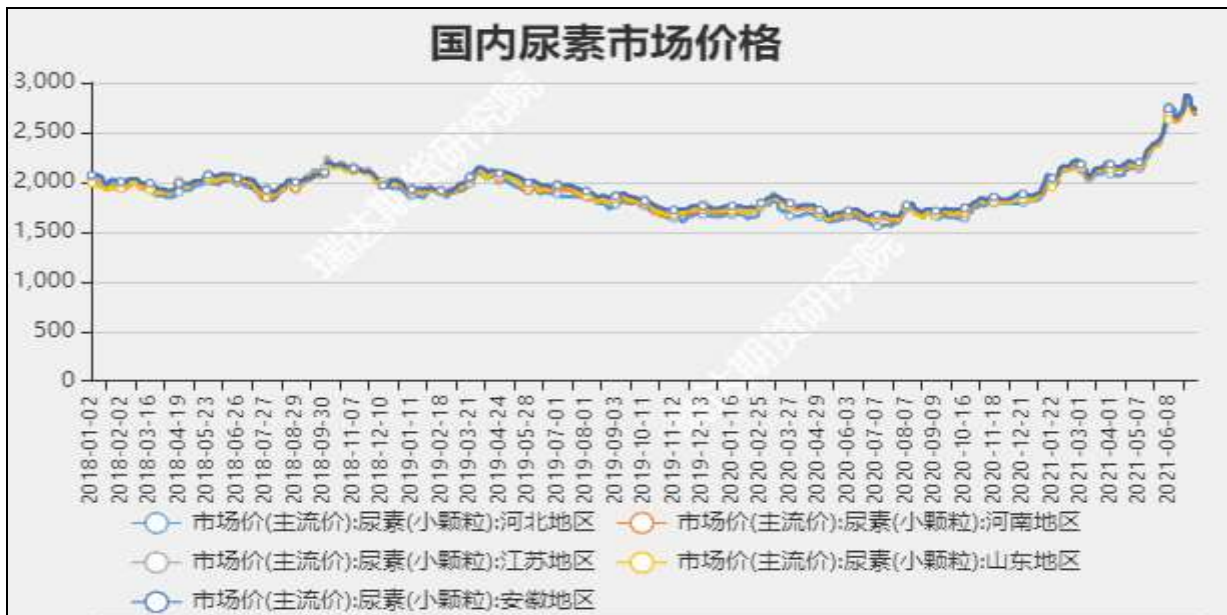
图3 国内尿素市场主流价

截至7月8日，NYMEX天然气收盘价3.69美元/百万英热单位，较上周+0.03美元/百万英热单位。