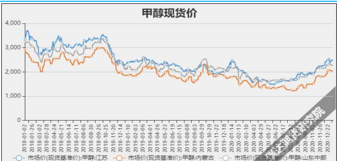
图3 甲醇现货市场主流价

截至1月14日, NYMEX天然气收盘价2.67美元/百万英热单位, 较上周-0.01美元/百万英热单位。