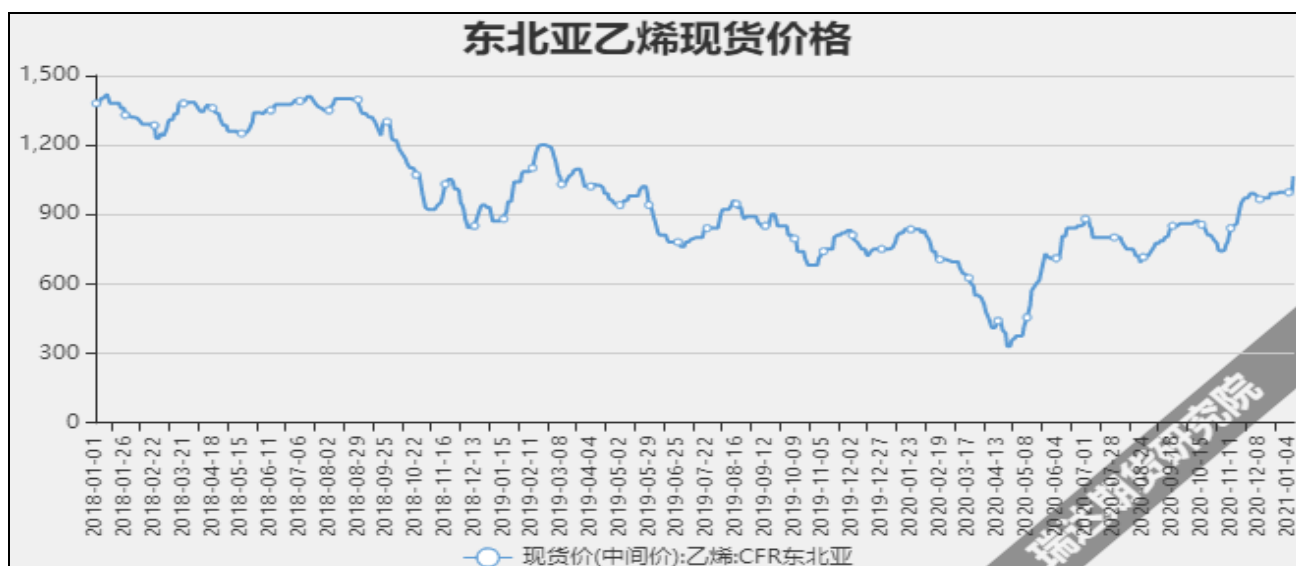
图13 东北亚乙烯现货价

截至1月13日当周，内陆地区部分甲醇代表性企业库存量25.49万吨，较上周-1.57万吨。