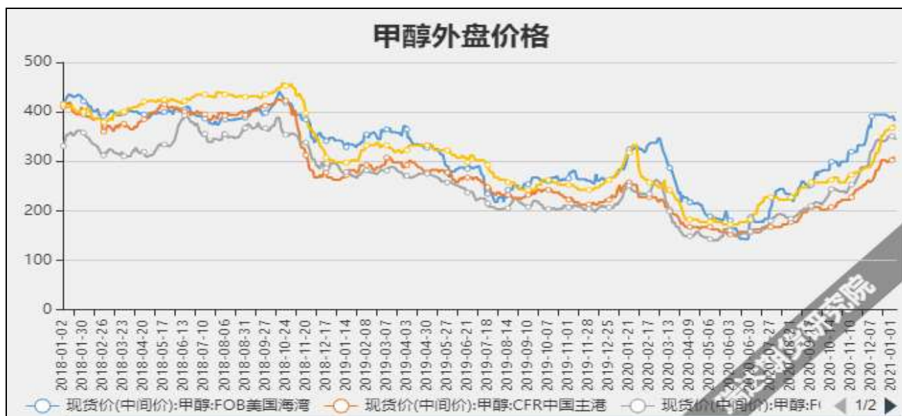
图5 外盘甲醇现货价格