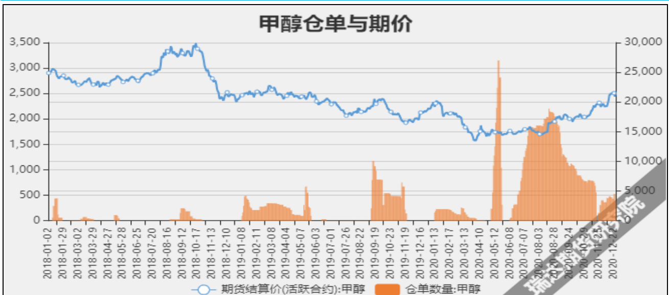
图7 甲醇期价与仓单数量