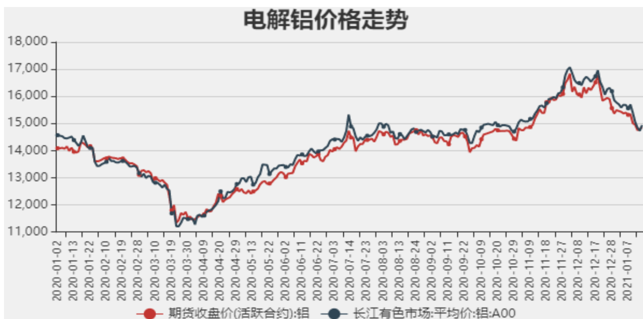
图1：电解铝期现价格

截止至2021年1月15日，长江有色金属1#电解铝平均价为14865元/吨，沪铝期货价格为14940元/吨。