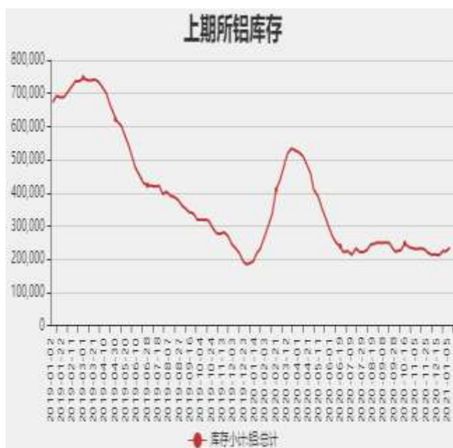
图8：上海期货交易所电解铝库存