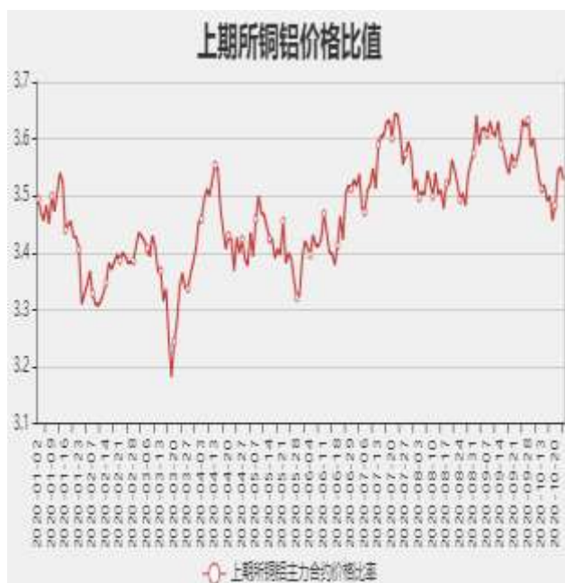
图9：沪铜和沪铝主力合约价格比率