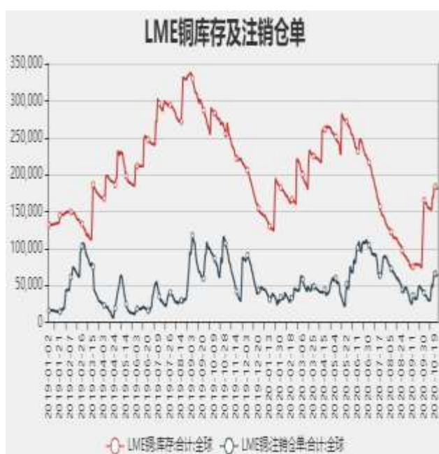
图7：LME铜库存及注销仓单