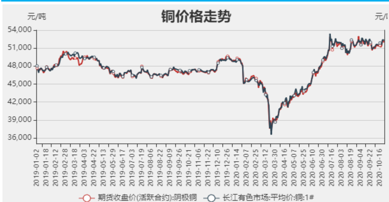
图1：铜期现价格走势

截止至2020年10月23日，长江有色市场1#电解铜平均价为51950元/吨；电解铜期货价格为52250元/吨。