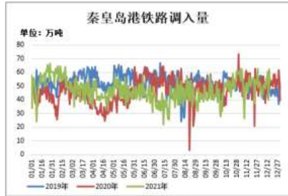
图8：秦皇岛港铁路调入量

截止 12 月 16 日，秦皇岛港铁路调入量为 52.9 万吨，较前一周增加 1 万吨。