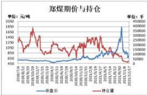
图3：郑煤期货价格与持仓量

截止 12 月 17 日，郑煤期货主力合约收盘价 740.6 元/吨，较前一周涨 63.8 元/吨；郑煤期货主力合约持仓量 24262 手，较前一周增加 1689 手。