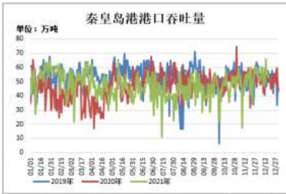
图9：秦皇岛港港口吞吐量

截止 12 月 16 日，秦皇岛港港口吞吐量 52.9 万吨，较前一周增加 6 万吨。