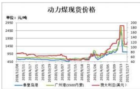
图1：动力煤现货价格

截止 12 月 17 日，秦皇岛港山西（Q5500，S0.6，MT8）平仓含税价报 1050 元/吨，较上周跌 25 元/吨；广州港内蒙优混 Q5500，V24，S0.5 港提含税价 1400 元/吨，较上周跌 20 元/吨；澳大利亚动力煤（Q5500,A<22,V>25,S<1,MT10）CFR（不含税）报 121 美元/吨，较前一周涨 9 美元/吨。