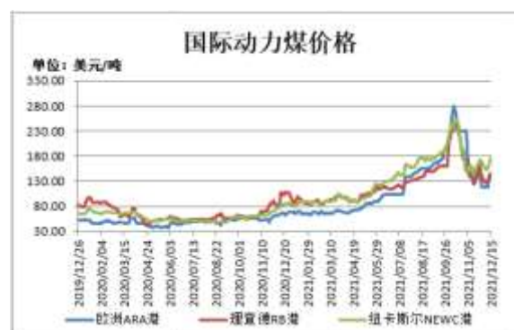
图2：国际动力煤现货价格

截止 12 月 15 日，欧洲 ARA 港动力煤现货价格报 141 美元/吨，较前一周涨 21.5 美元/吨；理查德 RB 动力煤现货价格报 145.25 美元/吨，较前一周涨 15.31 美元/吨；纽卡斯尔 NEWC 动力煤现货价格报 176.51 美元/吨，较前一周涨 20.05 美元/吨。