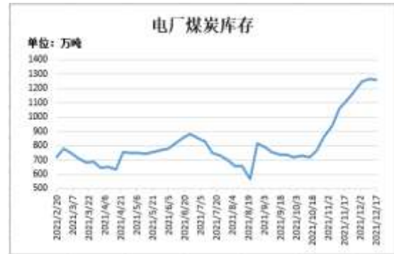
图12：电厂煤炭库存量

截止 12 月 17 日，Mysteel 数据：全国电厂样本区域煤炭库存 1260.36 万吨，较前一周减少 4.7 万吨。