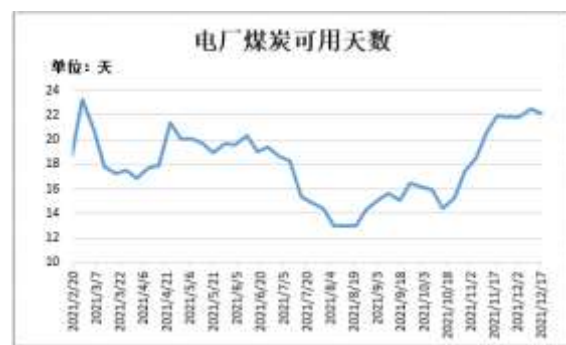
图14：电厂煤炭库存可用天数

截止 12 月 17 日，Mysteel 数据：全国电厂样本区域煤炭可用天数 22.18 天，较前一周减少 0.35 天。