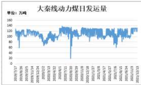
图11：大秦线动力煤日发运量

截止 12 月 13 日，大秦铁路动力煤日发运量 118.86 万吨，较前一周减少 11.82 万吨。