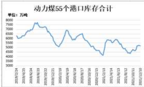
图7：动力煤55个港口库存

截至 12 月 10 日，动力煤 55 个港口库存合计 5172.4 万吨，较上一周减少 51.1 万吨。