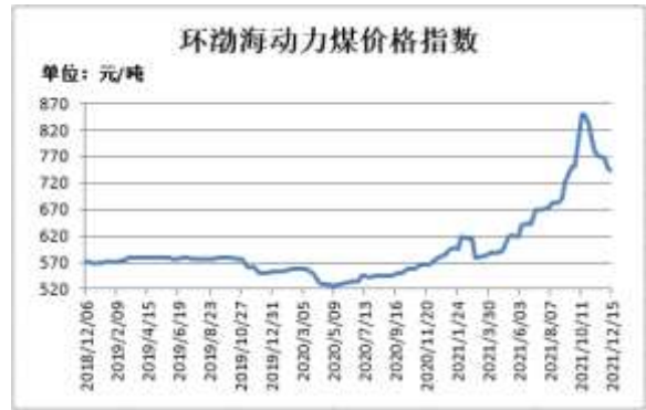
图4：环渤海动力煤价格指数

截止 12 月 15 日，环渤海动力煤价格指数报 743 元/吨，较上一期跌 3 元/吨。