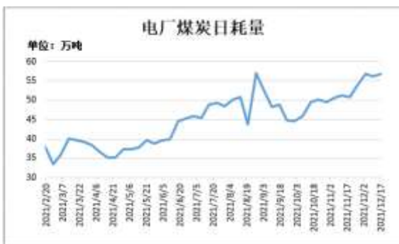
图13：电厂煤炭日耗量

截止 12 月 17 日，Mysteel 数据：全国电厂样本区域煤炭日耗量 56.83 万吨，较前一周增加 0.67 万吨。