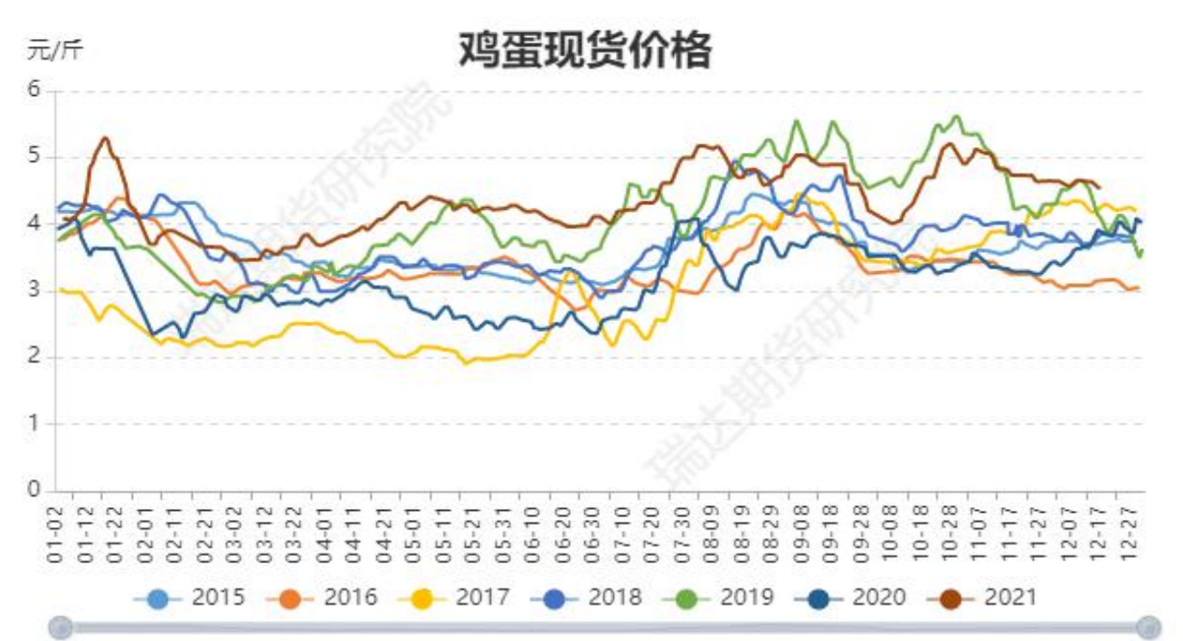
图4：全国鸡蛋现货均价季节性走势图