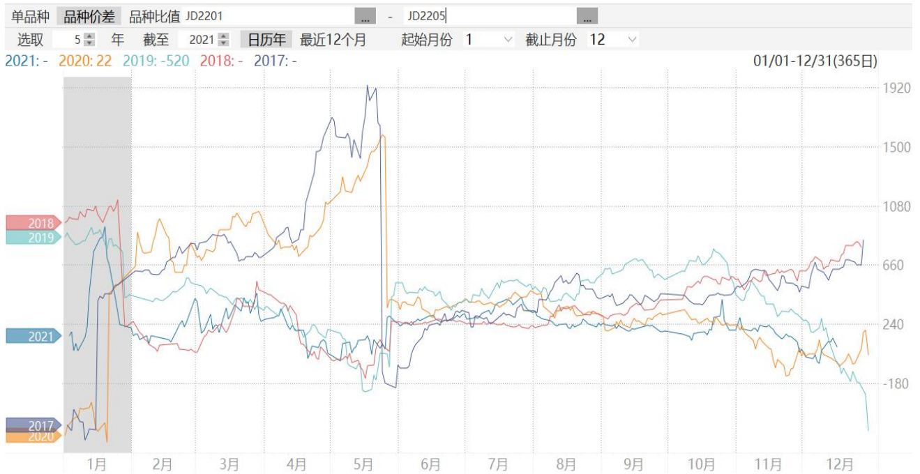
图8：鸡蛋2201合约与2205合约期价价差走势图

8、截至周五，鸡蛋2201合约与2205合约价差报+79元/500千克,处于同期次低水平。