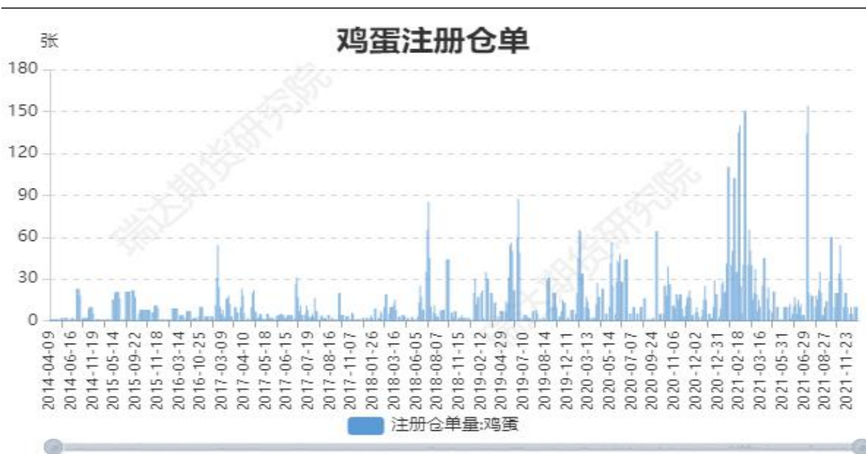
图5：大商所鸡蛋期货注册仓单量