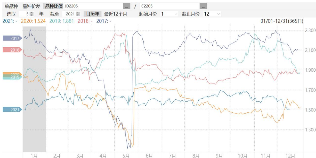
图9：鸡蛋2205合约与玉米2205合约期价比值走势图

9、截至周五，鸡蛋2205合约与玉米2205合约期价比值为2.101,处于同期较高水平。