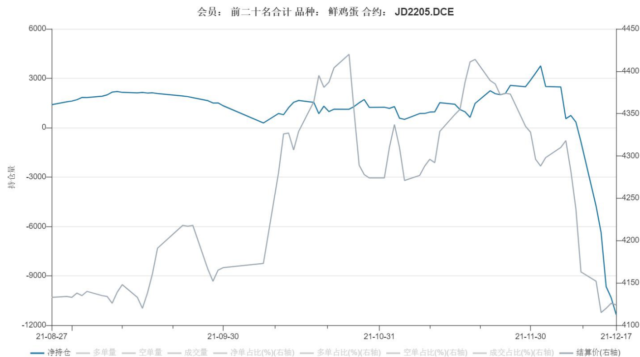
图6：鸡蛋 2205合约前二十名主力资金净持仓情况

6、本周期价继续下跌，2205合约净持仓-11363，净空持仓大幅增加，偏空氛围较浓。