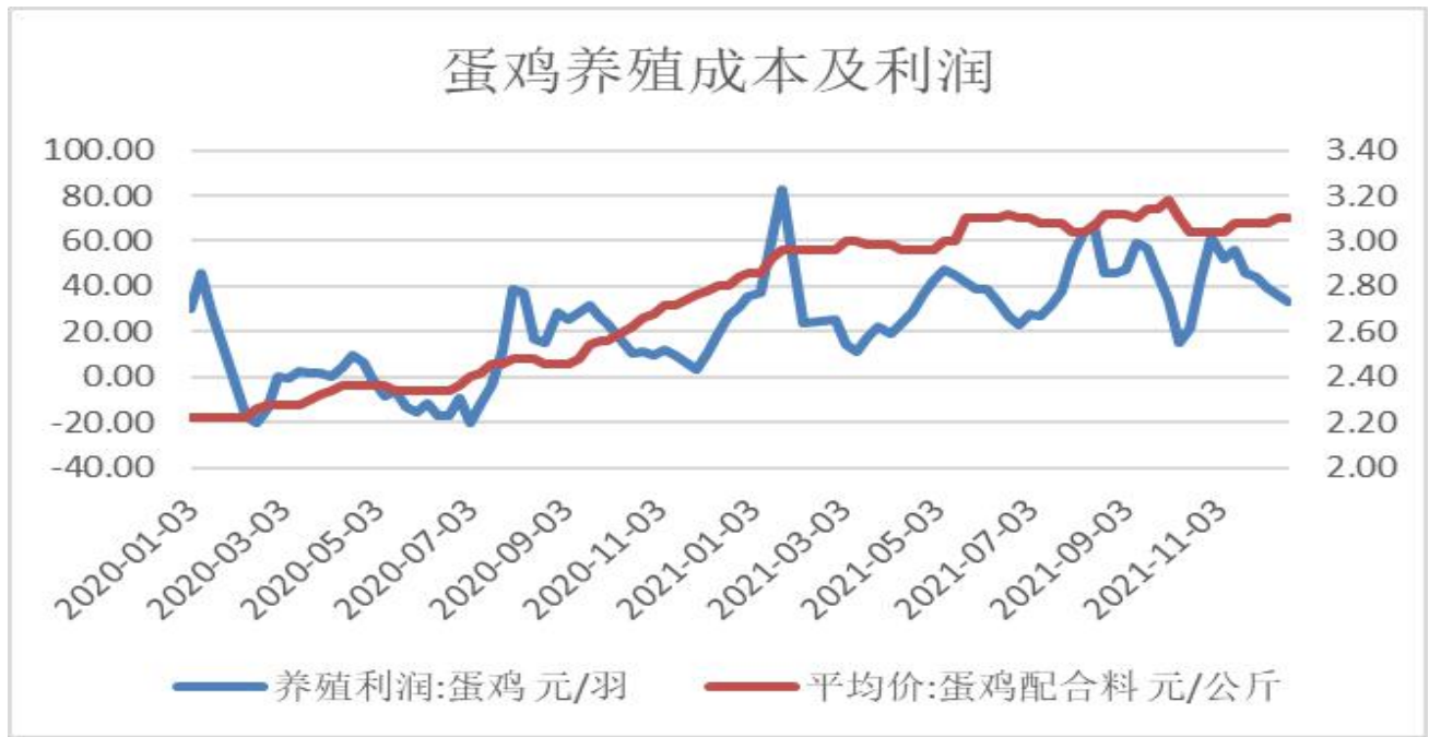
图3：蛋鸡养殖利润变化图

3、截止12月17日，蛋鸡养殖利润报+33.07元/羽，较上周-3.69元/羽；蛋鸡配合料价格报3.10元/公斤。