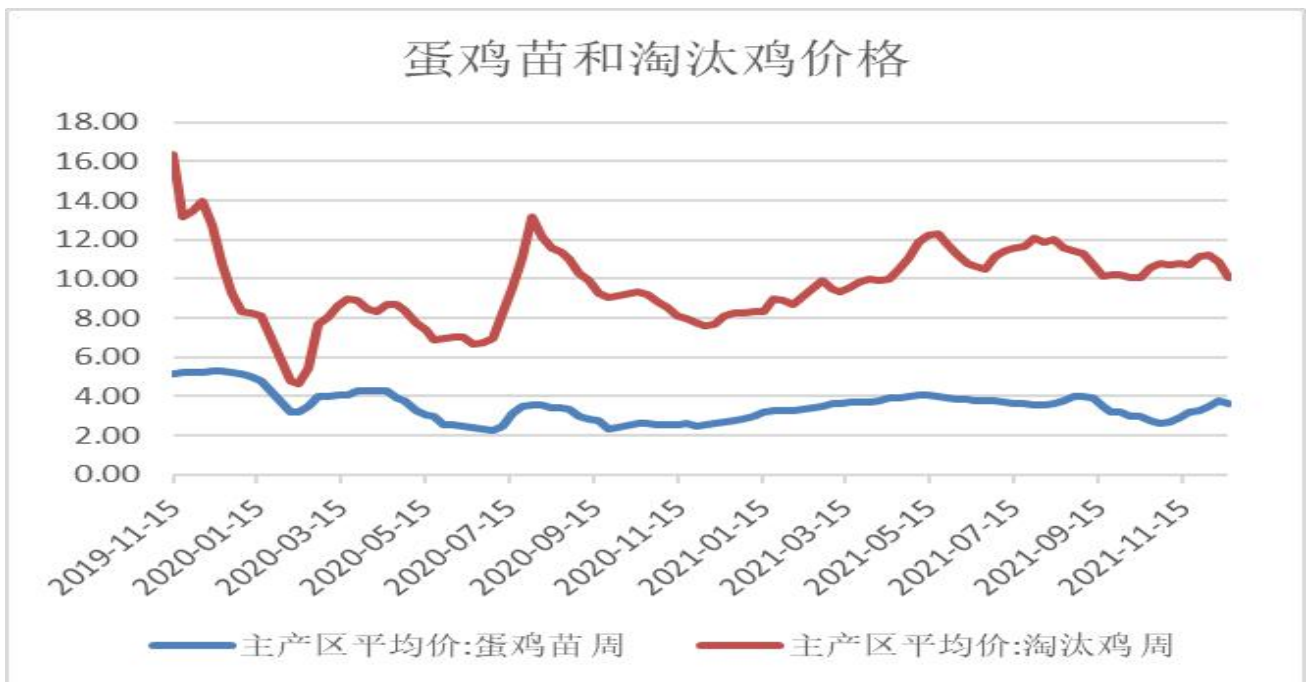
图2：淘汰鸡和蛋鸡苗主产区均价图

2、截至12月17日，蛋鸡苗3.60元/羽，周度-0.20元/羽，淘汰鸡10.06公斤，周度-0.82元/公斤。