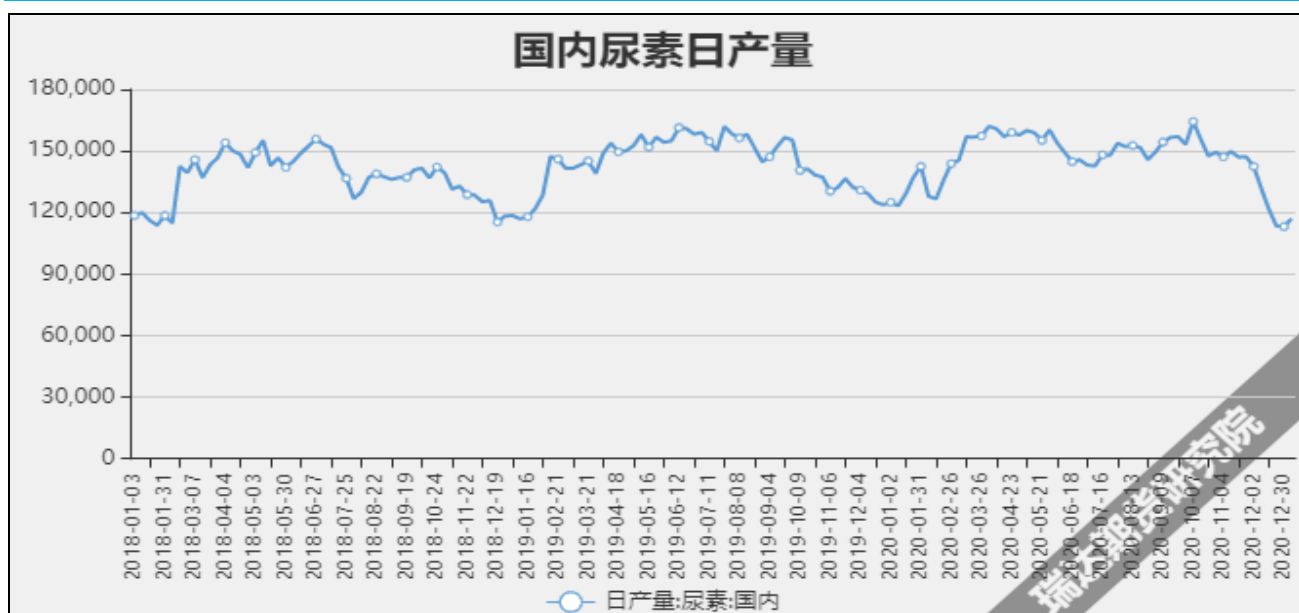
图7 国内尿素日产量