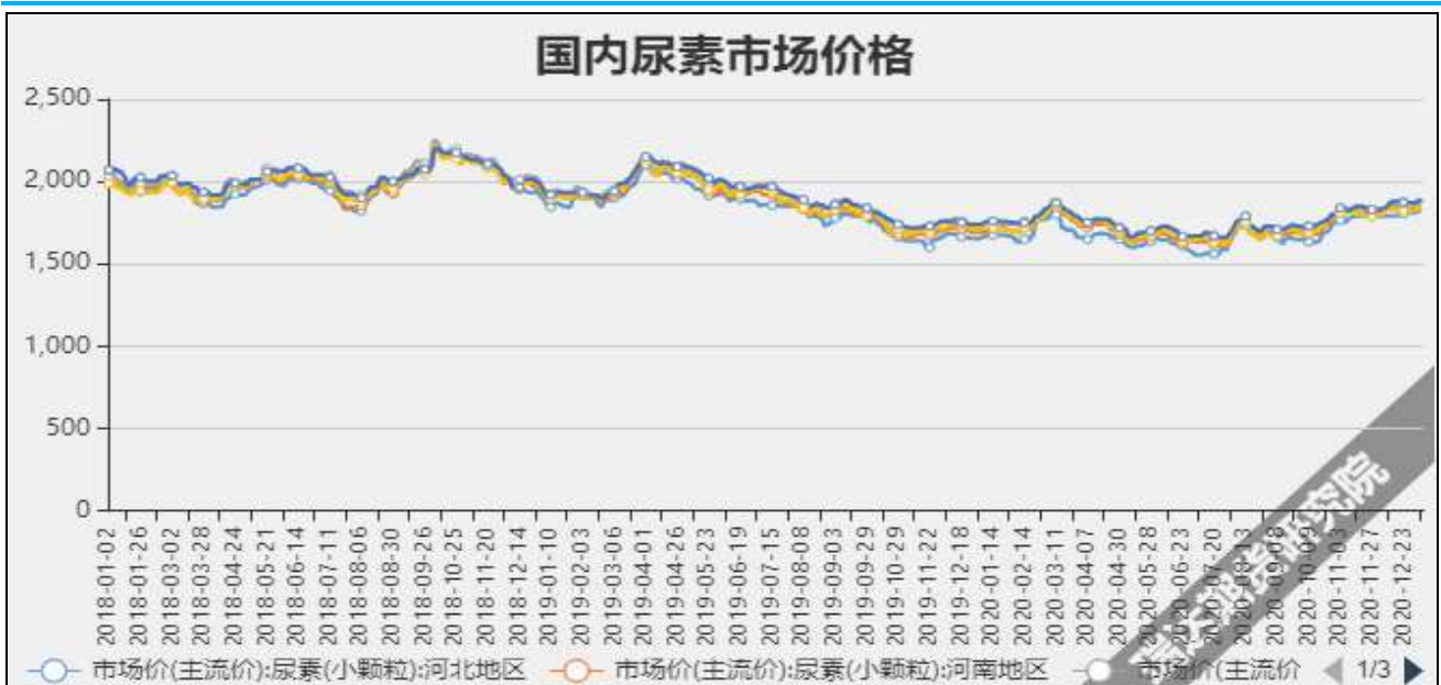
图3 国内尿素市场主流价

截至1月7日, NYMEX天然气收盘价2.68美元/百万英热单位, 较上周+0.25美元/百万英热单位。