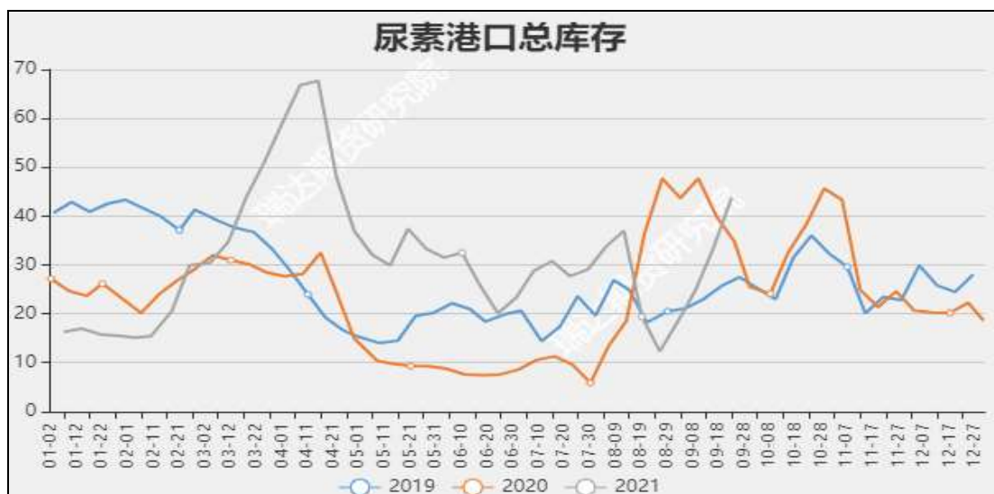
图9 国内尿素港口库存