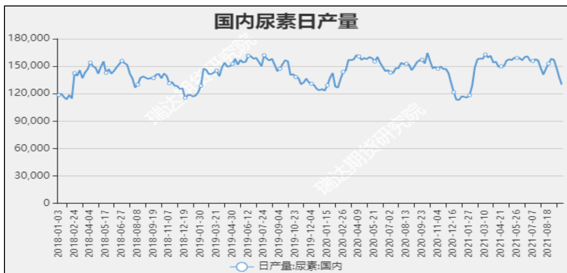
图7 国内尿素日产量